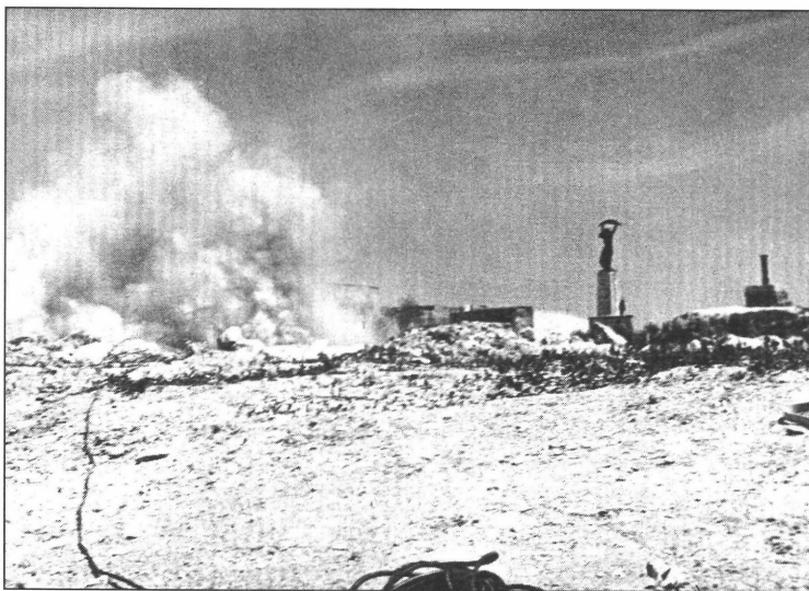
5. kép. Tereprendezés robbantással a Citadella mögött az 1950–60-as években