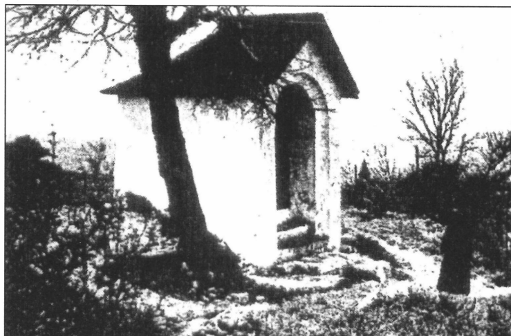
3. kép. Stáció-fülke a Gellérthegyen. (Pesti Napló, Képes Műmeléklet 1927. május 1.)