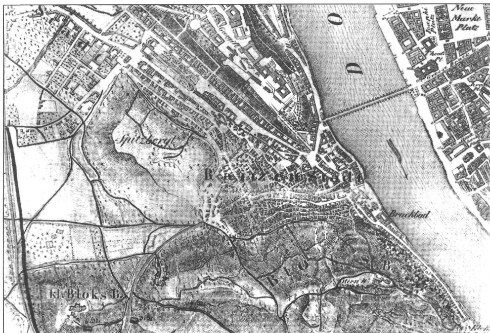
2. kép. 1836-ból származó térkép részlete a gellérthegyi Kálvária stációinak jelölésével (Hadtörténelmi Intézet G.I.h. 77/10 és 6)