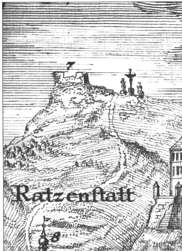
1. kép. Werner-Glässer 1740-ben készült metszetének kinagyított részlete