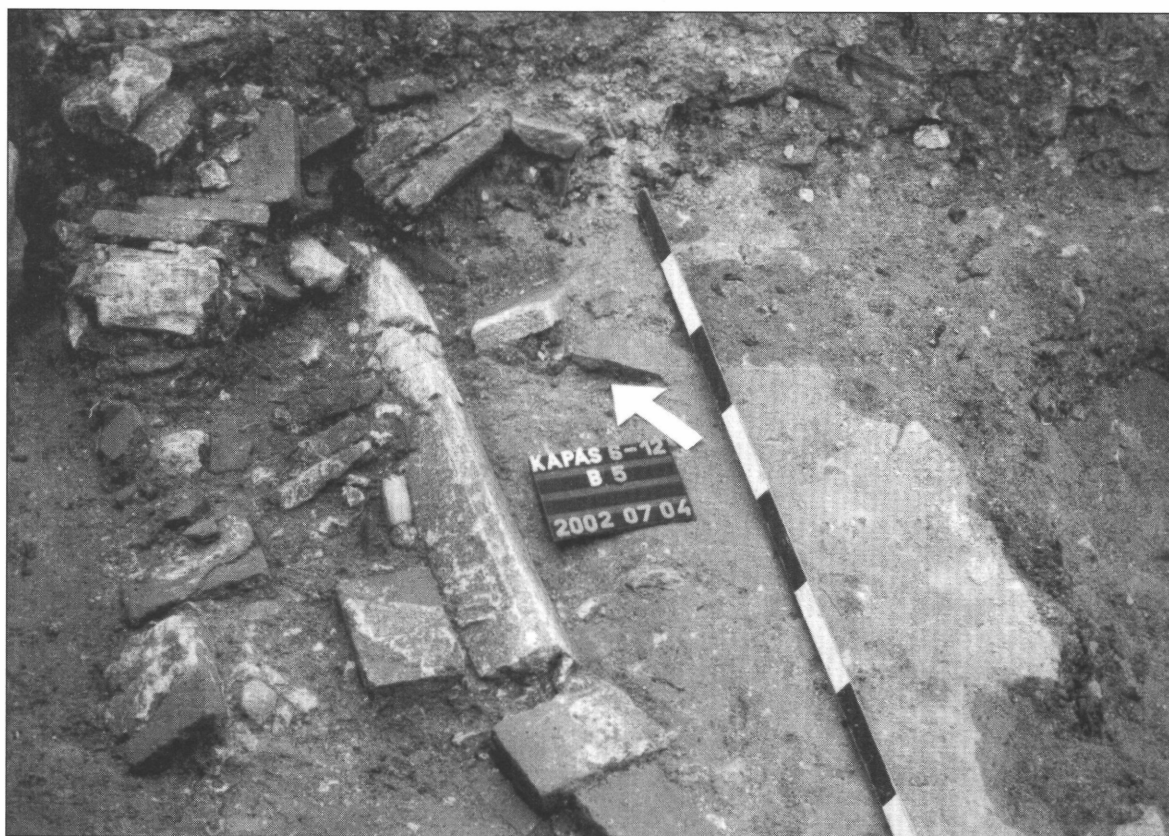
3. kép. A kerengő beomlott boltozata