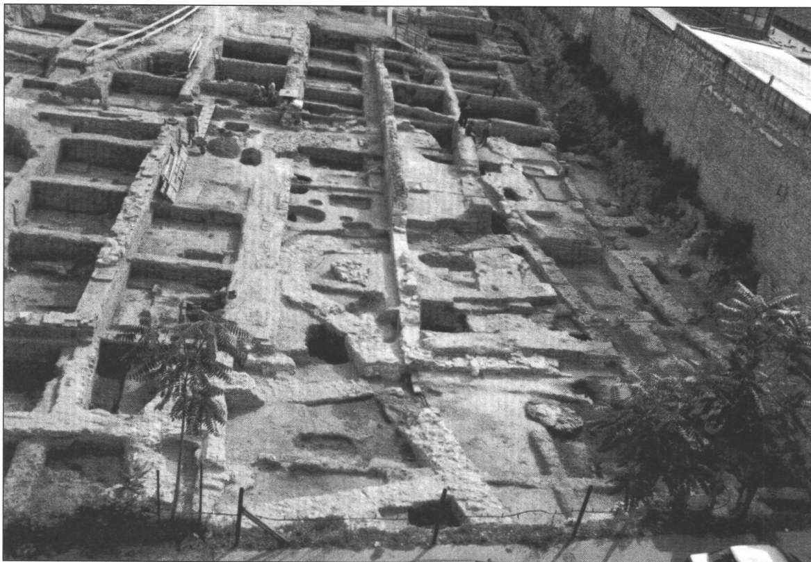
2. kép. Távlati fotó a feltárásról