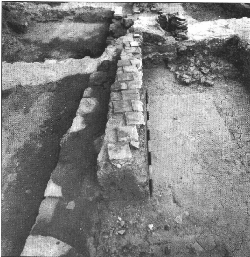
6. kép. Téglapadló maradványa a délkeleti helyiségben