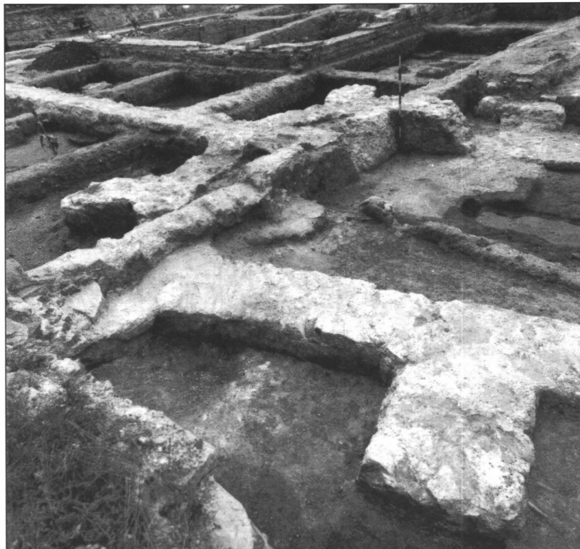
4. kép. A káptalanterem szentélybővítése