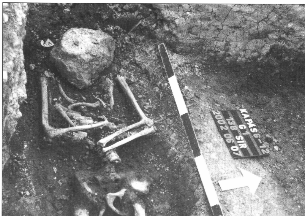
7. kép. A lefejezett férfi csontváza