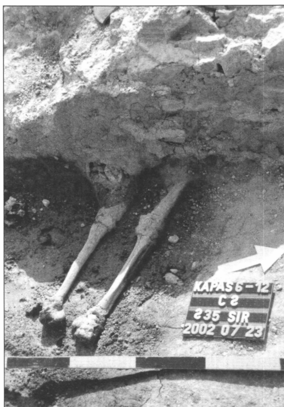
5. kép. A káptalanterem fala által elvágott sír