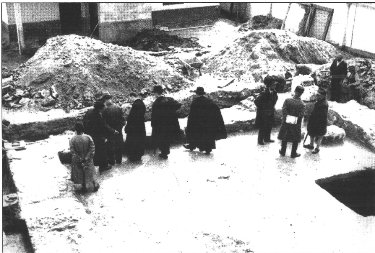
3. kép. Szemlélődők csoportja a csillaghegyi őrtoronynál