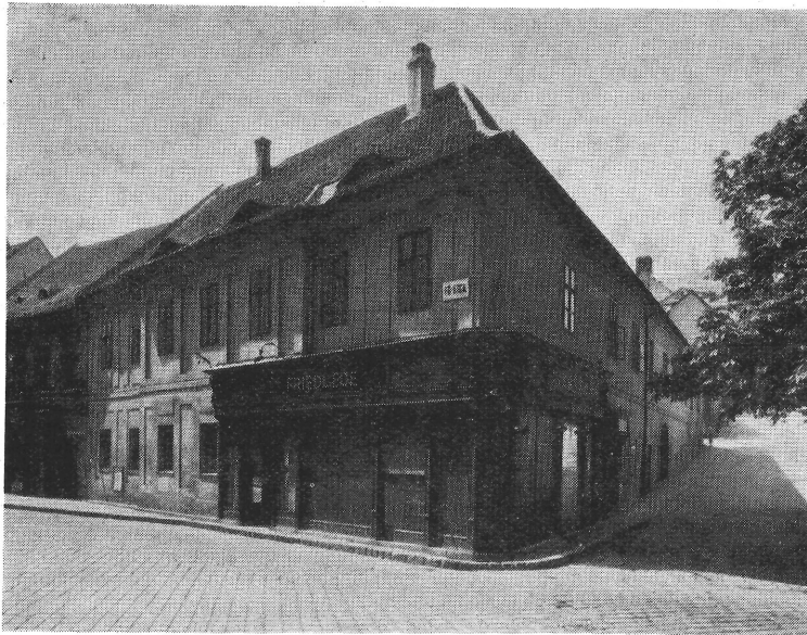
5. kép. A Friedl cukrászda a XX. század elején Die Friedlsche Zuckerbäckerei zu Beginn des 20. Jahrhunderts