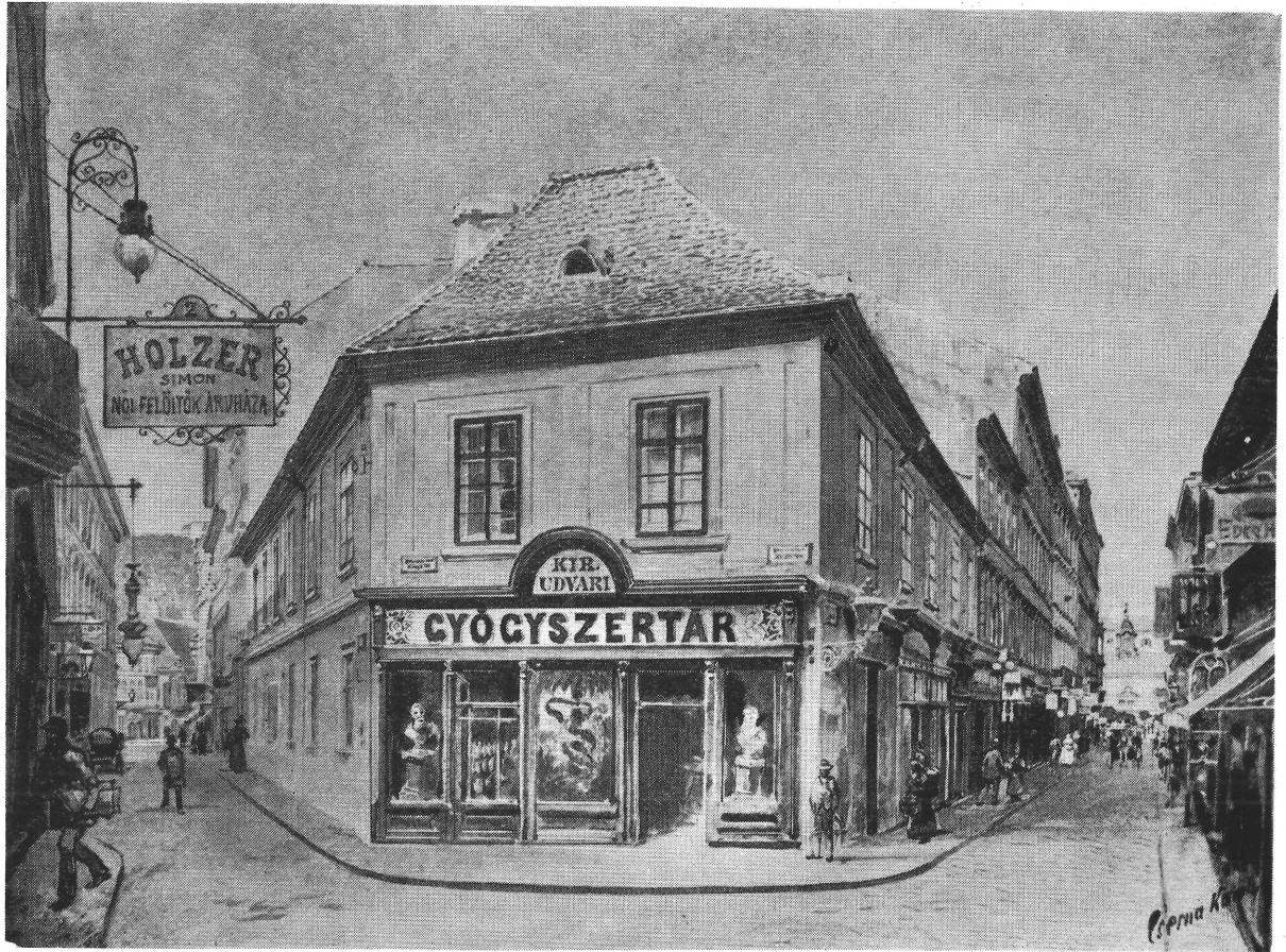
1. kép. Boltcímer elhelyezése portaléba foglalva. A Kígyó patika a XIX. században. Cserna Károly vízfestménye In das Ladenportal eingebautes gemalenes Schild. Die Schlangenapotheke im 19. Jahrhundert. Aquarell von K. Cserna

kedvező anyagi körülmények között élő festők szívesen vállaltak boltcímerfestést. Boltcímereink az egyéni ízű, sajátos pest-budai biedermeier festészet alkotásai. Festőik, nem egy esetben akadémiai festők 8 .