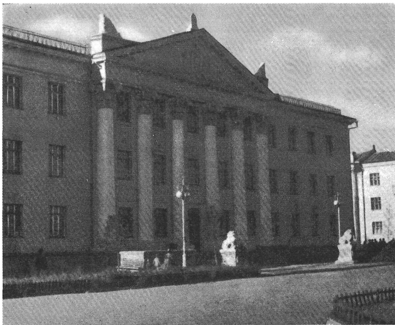
1. kép. A Központi Múzeum Ulan-Batorban

A mai mongol kutatás elsősorban a korai mongol korszakra, valamint tágabb értelemben a Dzsingisz kán-korszakra helyez súlyt, és ez a múzeum kiállításán is erősen megnyilvánul. Az utóbbi korszak tárgyi emlékein kívül az ujjúr—mongol írásos emlékek, ezenkívül a sámánizmus tárgyi-néprajzi anyaga egészíti ki a rendkívül életszerű és e helyen egyúttal korszerű kiállítást. Meg kell említenünk, hogy a XIII—XIV. századi emlékek egy része nem ásatásból, hanem családi örökségként került múzeumba; ez a tény valószínűleg még fokozza azt a feltűnő érdeklődést, amely a legegyszerűbb embereknél is megnyilvánul a régiség, a történelem s a múzeumok iránt. A régi mongol-kori gyűjtemény igen alkalmas a nemzeti öntudat emelésére, a kiállításoknak is ez a része a leglátogatottabb. A közönség azonban a hunoktól kezdve az egész mongóliai történelmet sajátjának érzi.