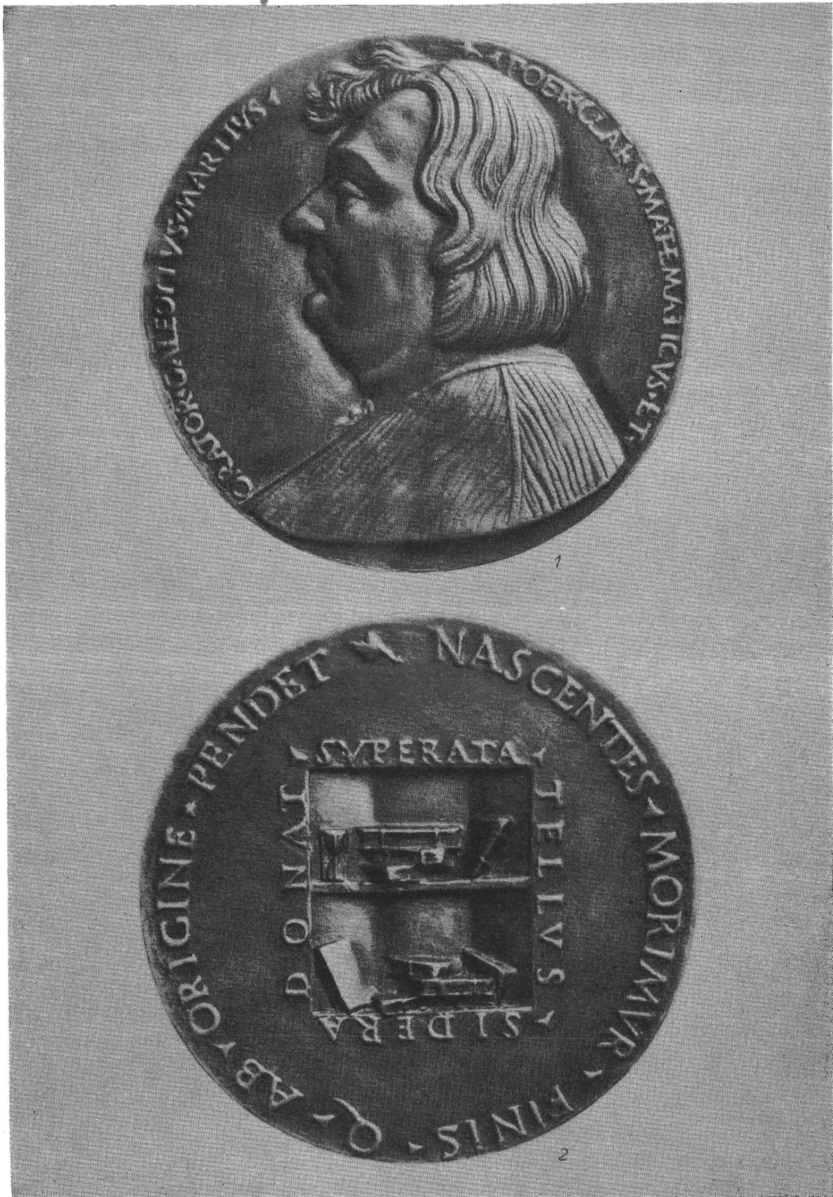
1. kép. Galeotto Marzio emlékérmé