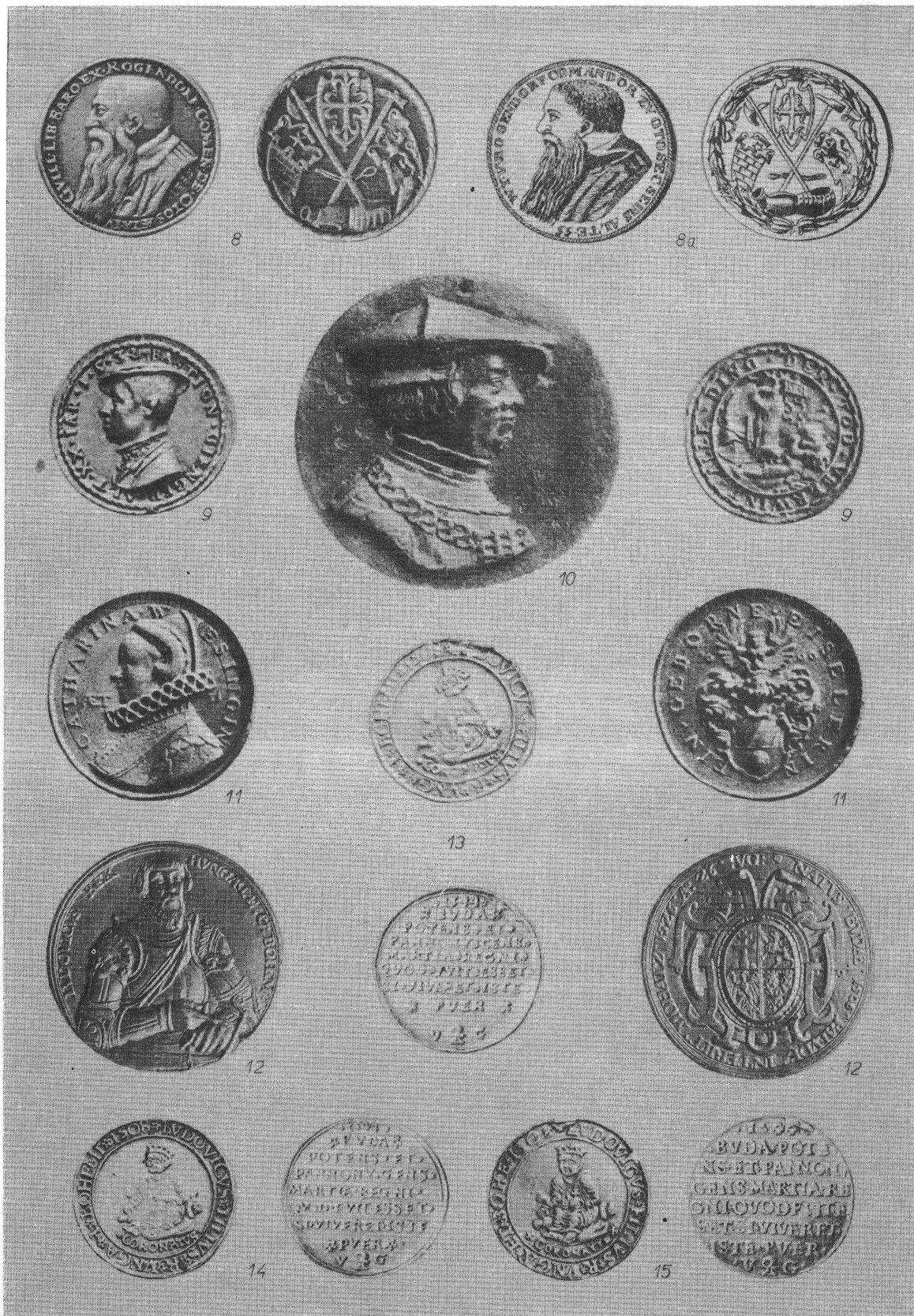
3. kép. Budai és pesti vonatkozású reneszánsz emlékérmek