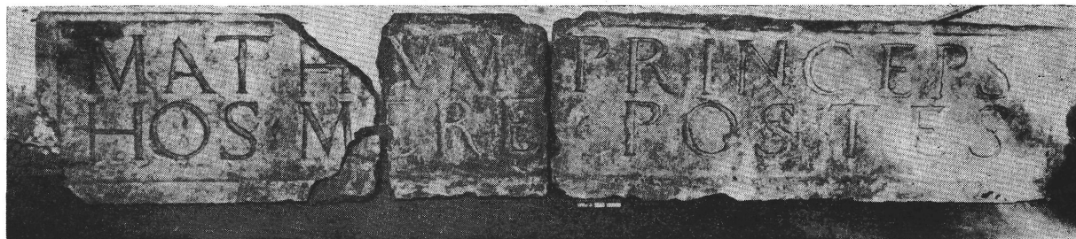
1. kép. A Mátyás-feliratos töredékek

A lelőhely területe középkori helyrajzának lehető tisztázása, a feliratos kőlapokkal egy helyről előkerült ornamentális faragványoknak, valamint esetleg az ugyanott előkerült kincseletnek 9 ezekkel való összefüggése, ezenkívül az esetleg lehetséges rekonstrukció, 10 és Mátyás király pesti palotájának, vadaskertjének és a középkori pesti ferences kolostornak kérdése még oly sok és kiterjedt kutatást igényel, hogy az idő rövidsége miatt kénytelenek vagyunk a részletesebb ismertetést későbbre elhalasztani.