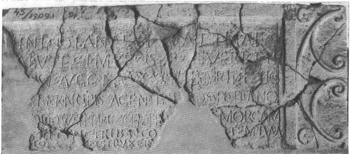
2. kép. Diana Tifatina intercisai szentélyének építési felirata L. Baebius Caecilianus helytartósága idejéből

A jelen összefüggésben vizsgálva a rendelkezésünkre álló adatokat, elfogadhatatlannak tartjuk azt a legutóbb elhangzott javaslatot, amely szerint a 199-ben hivatalba lépő Baebius Caecilianus még 202-ben is Alsó-Pannóniát kormányozta volna. 57 Az Óbuda Tavasz utcai építési felirat 58 hiányzó negyedik sorába szerintünk erőszakoltan helyezték el az utóbb említett helytartó nevét, mely nem tölti ki az átlagosan 24—25 betűs felíratrészt. Minthogy ide a 202-ben kormányzó Caecilius Rufinus teljes vagy rövidített neve sem illik, ezért az utolsó két sor Septimius Severus és Antoninus (Caracalla) helyett Antoninus (Caracalla) és Geta consulpár neveire egészíthető ki. Az ily módon megkapott 205. vagy 208. év alsó-pannóniai helytartóját jelenleg azonban még nem