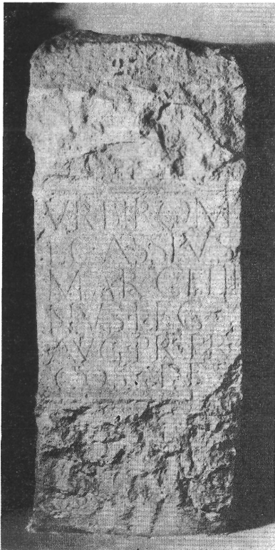
4. kép. L. Cassius Marcellinus helytartó Urbs Roma ajánlott aquincumi oltárköve (212—214)