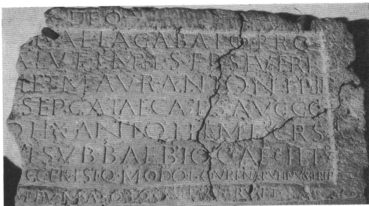
3. kép. L. Baebius Caecilianus helytartósága idejében (199—200) épült intercisai Sol Aelagabalus-szentély felirata

ismerjük. A Tavasz utcai felirat mellett az aquincumiaktól Septimius Severus és M. Aurel. Antoninus salusáért állított oltárkönek 59 sincs köze a 202. évi császárlátogatáshoz. A feliraton Caracalla még Caesar, s ezért vagy 196-ban, vagy 197 júniusa előtt állították ezt az oltárt. Majdnem bizonyosra vehető, hogy a Clodius Albinus elleni belháború idején adtak kifejezést ily módon az aquincumiak császárhűségüknek. Amikor a syriai triasnak ajánlott kapuzat épületfelirata 60 sem keltezhető pontos évre, a császárok aquincumi látogatásával legutóbb kapcsolatba hozott feliratos emlékek, mint más összefüggésekbe tartozók, elesnek. A látogatás ténye természetesen ennek ellenére sem vitatható. Ugyancsak nem érthetünk egyet a Diana Tifatina, 61 valamint a Sol Aelagabalus 62 tiszteletére Intercisában emelt szentélyek építési feliratainak a 202. évre keltezésével sem, minthogy a feliratokon említett L. Baebius Caecilianus legfeljebb 201-ig kormányozhatta Alsó-Pannóniát.