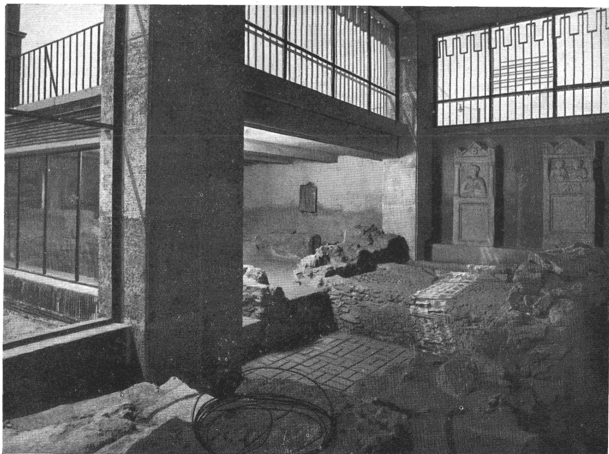
2. kép. A nagyterem belső képe

A pillérek elkészítése után 1950 őszén az emléket ismét földdel borították, hogy a fagytól és a házépítkezéssel kapcsolatos egyéb káros behatásoktól megóvják. A múzeum építésének 1953-ban történt meg-