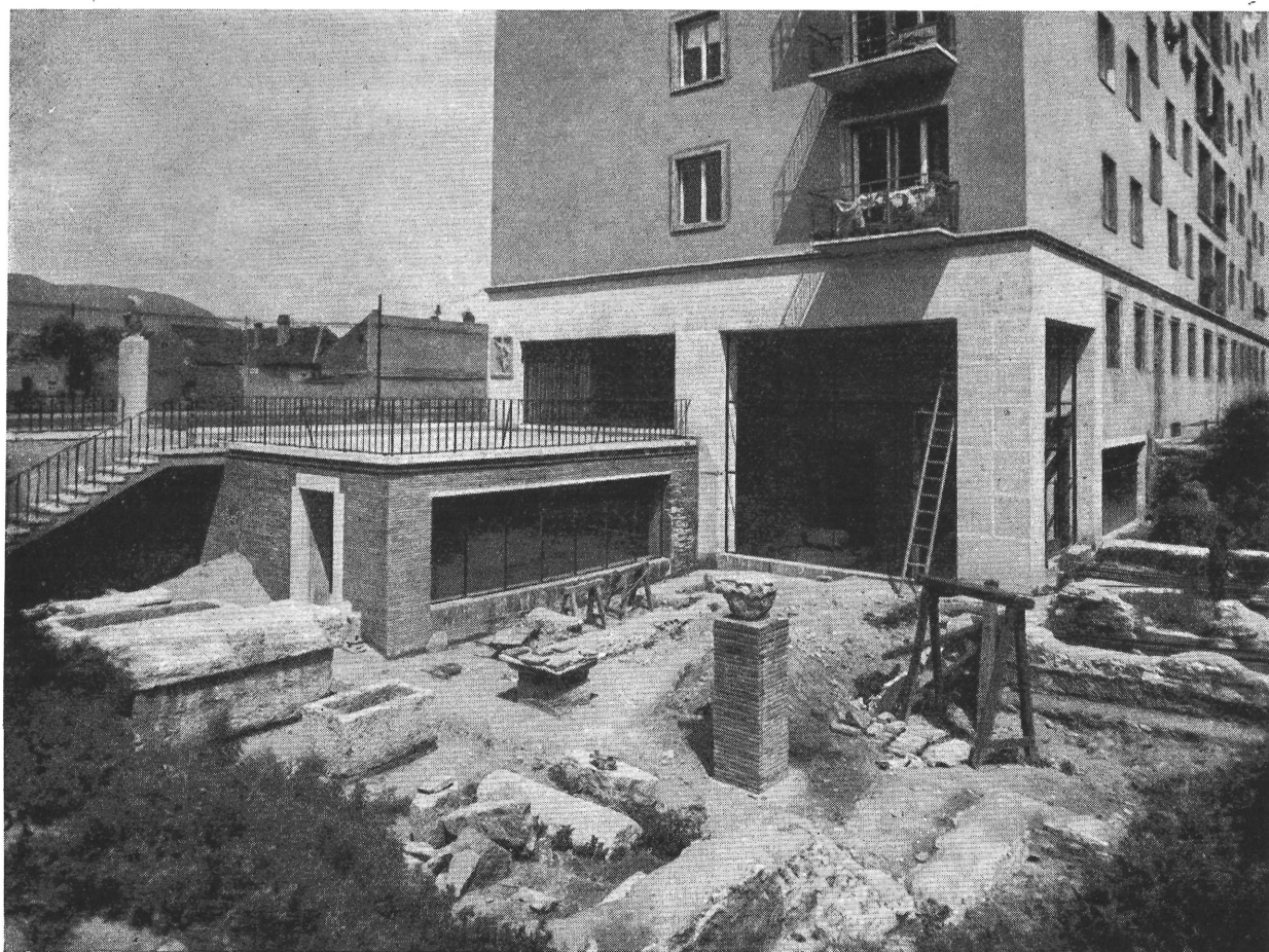
4. kép. A rommező délről.

További fontos követelmény volt az, hogy a rommező nyitott és zárt részei ne szakadjanak el egymástól; a rommező szintje beléfolyjon az üvegcarnokba és a nyílt térből a múzeumi rész, ebből pedig a szabadban folytatódó romok egyaránt könnyen áttekinthetőek legyenek. Hiszen éppen a különböző rendeltetésű részeknek ez az érdekes egymásba folyása teszi a táborvárosi múzeumot oly egyedülállóan eredetivé, amihez hasonló példákkal külföldön sem igen találkozunk. A teljesen földbe süllyesztett megoldásúakkal (Március 15. téri és Flórián téri földalatti múzeumok) ellentétben a lüktető főforgalmi ér mellett a múlt és jelen egymásba fonódó alkotásainak ez a váratlan feltárulása szinte lecsalogatja a romkertbe, majd abból a múzeumi térbe az arra haladókat.