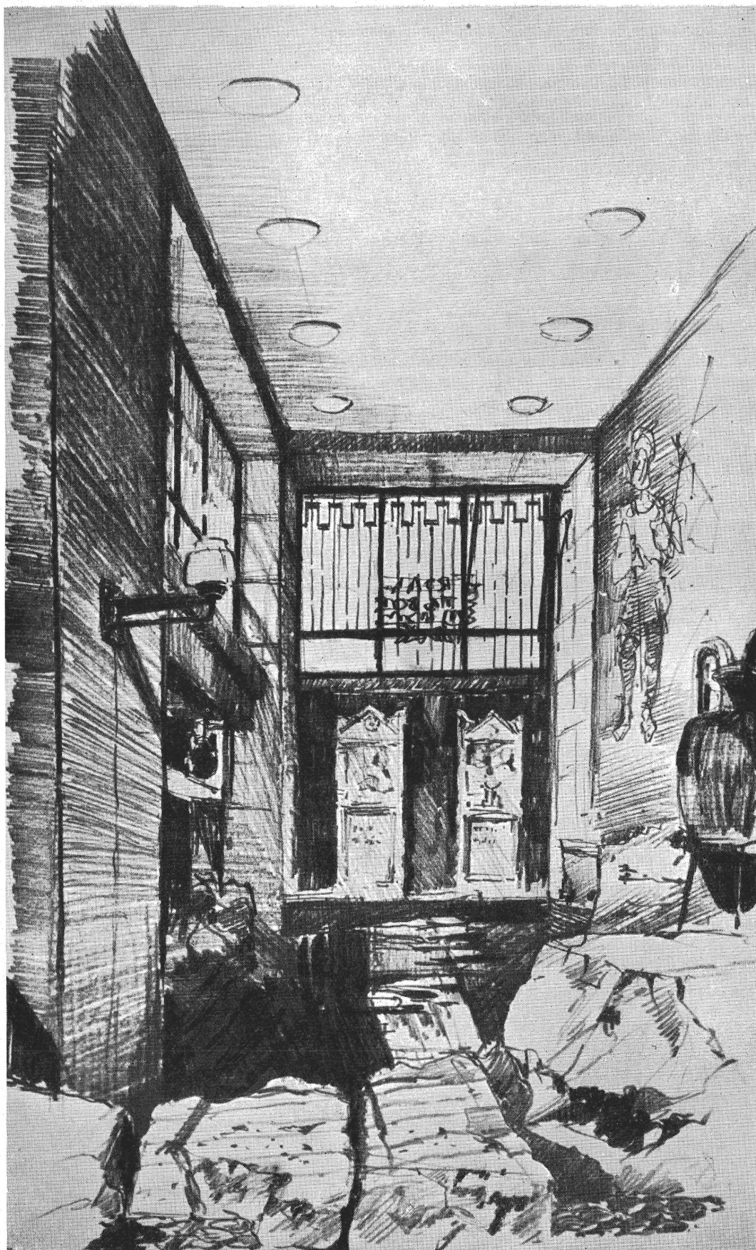
5. kép. A nagyterem belseje. Pfannl Egon rajza