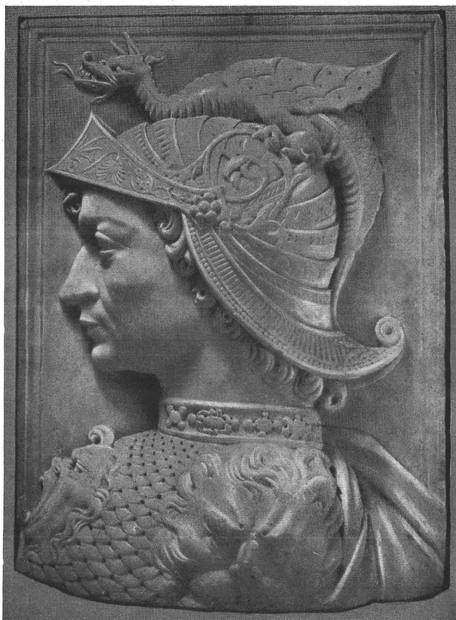
2. kép. Harcos-fej. London

technikai megoldásában is találunk feltűnő egyezéseket. A két faragvány megmunkálásának különbségeit eltérő anyaguk (márvány, ill. homokkő) és eltérő rendeltetésük (különböző magasságban alkalmazott faragványok) indokolja. A londoni darab az aukció-közlemény szerint a múlt század közepe óta van Angliában; a pistoiái Forteguerrri síremlékkal való formakapcsolatai miatt Verrocchio munkájának tartják 3 (2. kép).