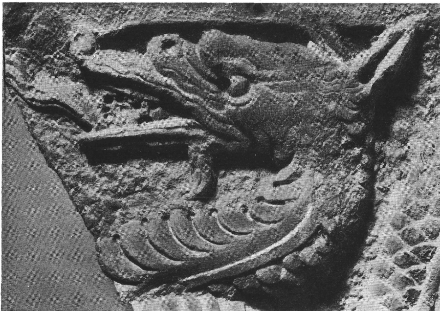
3. kép. A budai kő részlete