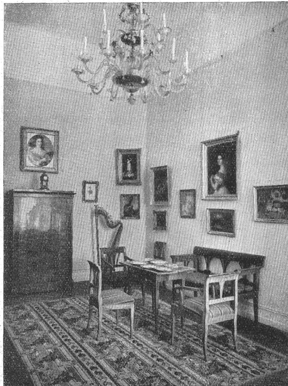
2. kép. Magyar polgári otthon 1830 körül. »Magyar otthonok« kiállítás.