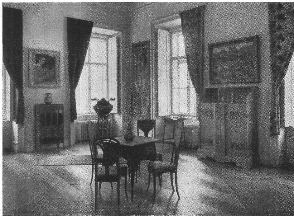
4. kép. Polgári szoba 1900 körül a secessió korából. »Magyar otthonok« kiállítás.