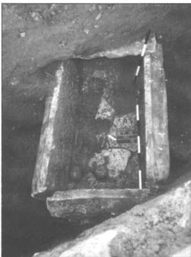
2. A 2. számú szarkofág kibontva Figure 2. The opening of sarcophagus Nr.2

A sírok maradványainak helyzetéből ítélve a temetőnek ez a szaka-