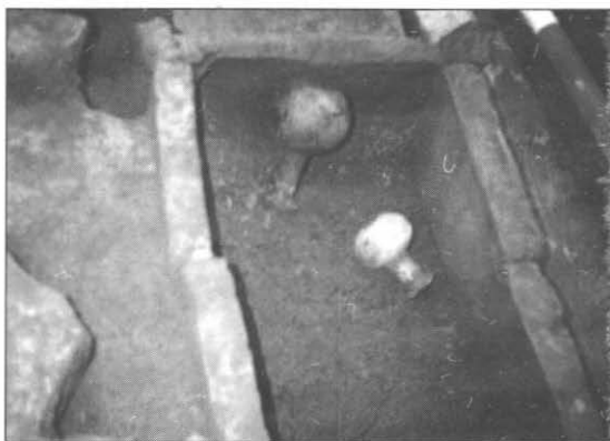
2.kép: Üvegedény mellékletek gyermeksírból Figure 2: Glass goods from a children's grave

A központi kősírok köré csoportosulnak folyamatosan a téglasírok. Az egyik csoportban öt, melléklet nélküli újszülött egy egy téglából épített háztető alakú sírjait, s egy bepólyázott csecsemő vázát tártuk fel, akinek – talán bajelhárító amulettként egyetlen állatcsont volt a nyakába kötve. A nagyobb gyermekek gazdag melléklettel voltak ellátva, nem ritka egy egy sírban a két- három üvegedény. (2.kép) Egy körülbelül hatéves kislány üveg-