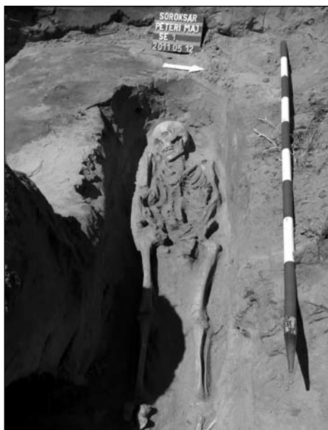
4. kép: Árpád-kori(?) csontváz sír (Budapest, XXIII. ker., Péteri major)

élesen rajzolódó, egynemű, tömött, sötétbarna betöltésű folt rajzolódott ki. Kibontása során egyenes, függőleges oldalú, 80 centiméter széles árok bontakozott ki, amely valószínűleg lövészárk lehetett, s szerencsésen éppen elkerülte a csontváz koponyáját.