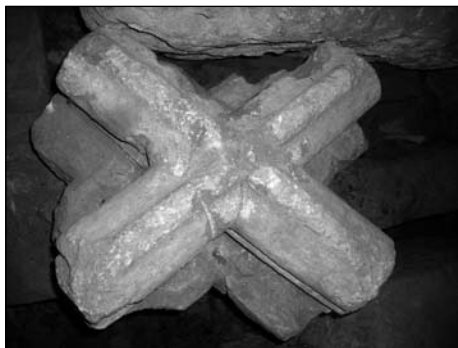
3. kép: 14. századi keresztboltozati csomópont (Budapest I. ker., Fő utca 30–32.)

A kisterületű (14 m 2 ) ásátás közvetlen környezetét tehát jól ismertük (BENDA 2005, 181–182), de még így is meglepetéssel szolgált a kéthetes feltárás. Az ása-