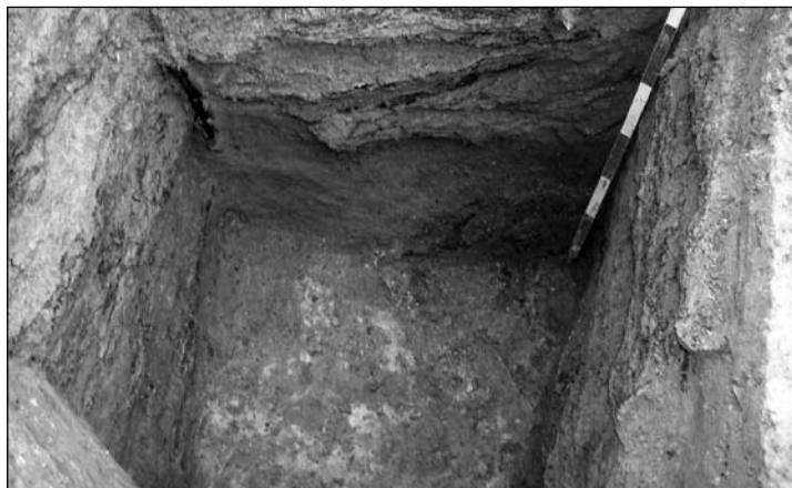
2. kép: Fabélelésű verem alján az agyagtapasztással (Budapest, I. ker., Szabó Ilonka utca 9.)

KOVÁCS 2001 – Kovács E.: Toldy Ferenc utca 8–10. – Szabó Ilonka utca 7. RégFüz I.51 (2001) 176.