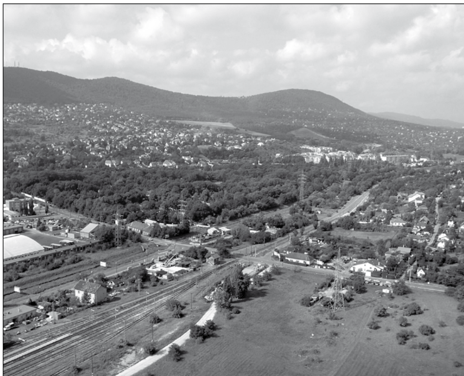
2. kép: Légi fotó az Aranyhegyi árok menti temető területének jelenlegi állapotáról, kelet felől (Budapest, III. ker., Budapest–Esztergom vasútvonal Keled utcai szakasza)