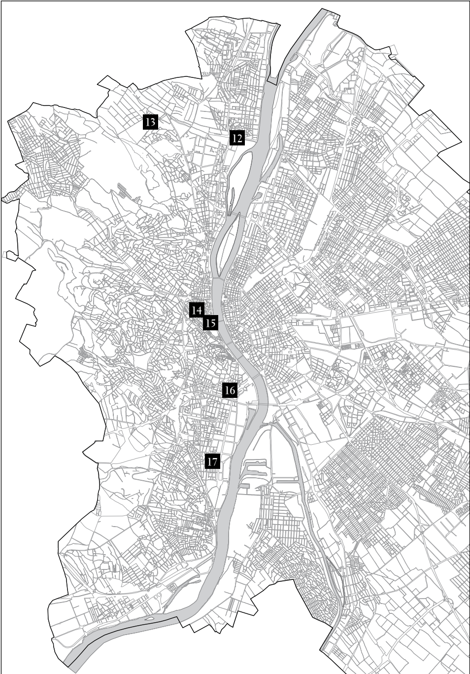
1. kép: A Budapesti Történeli Múzeum kisebb feltárásainak helyszínei