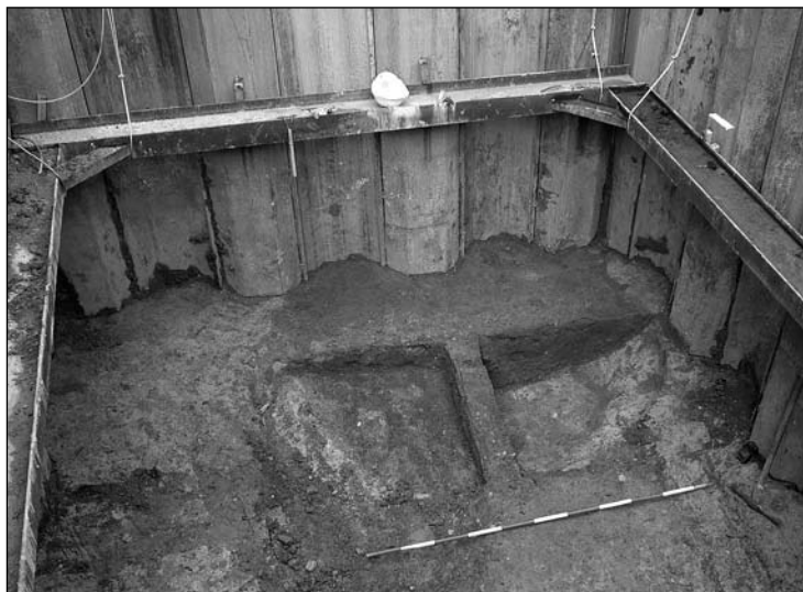
8. kép: Kora császárkori gödör bontás közben (Budapest, XI. ker., Október 23. út)

a Fő utca 2. számú telek teljes felületét fel kell tárnai a tervezett beépítés előtt.