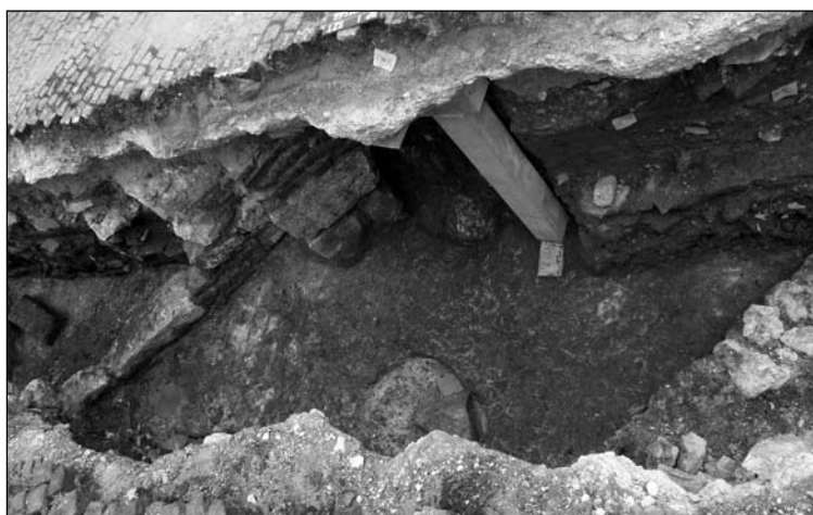
4. kép: A kéthelyiségű pince részlete délnyugat felől fotózva (Budapest, I. ker., Szentháromság tér)

A 39 és 40 m közti szakaszon részben már a nyugati metszetalak alá nyúló, a sziklafelszínbe mélyített aknaszerű nyílást figyeltünk meg. Pár méterrel odébb, 43 és 46 m között az előbbihez hasonló, de itt már szinte teljesen a keleti metszetalakban jelentkező kialakítást észleltünk. Sajnos