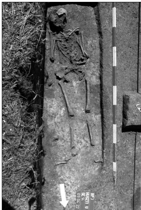
4. kép: Csontvázas sír koporsós temetkezésre utaló vasszőgekkel

A feltárás során egyetlen csontvázas, észak-déli irányú temetkezés került elő (4. kép). A váz körül megmaradt, szabályos formát kirajzoló vasszőgek koporsós