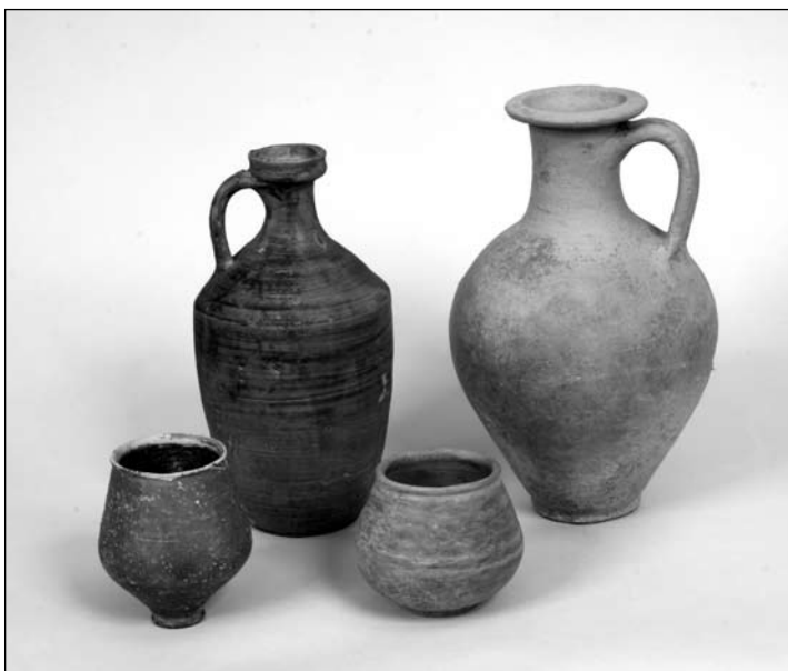
3. kép: Hamvasztásos sírokból előkerült kerámia edények Fig. 3: Ceramic vessels from cremation burials