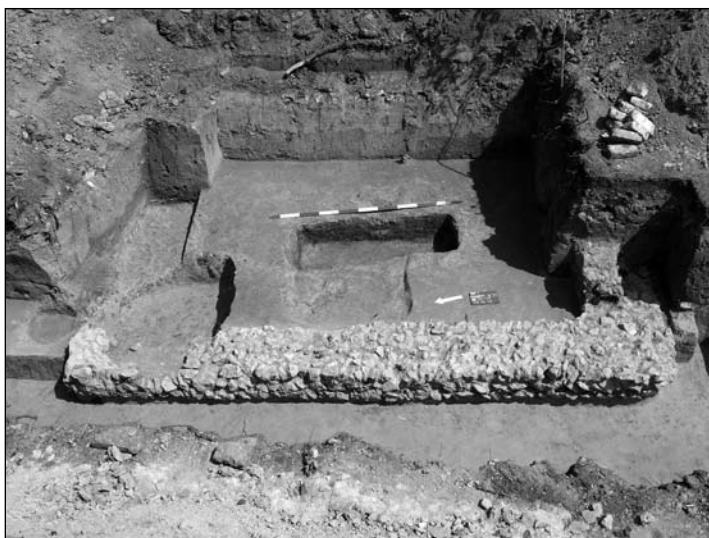
2. kép: Sírkert hamvasztásos sírral Fig. 2: Grave yard with cremation burial

long. The wall foundation was built from small limestone blocks without binding matter, over which larger limestone blocks were placed in mortar. The grave construction could not completely be unearthed since it ran beyond the investigated territory in the east (Fig. 2).