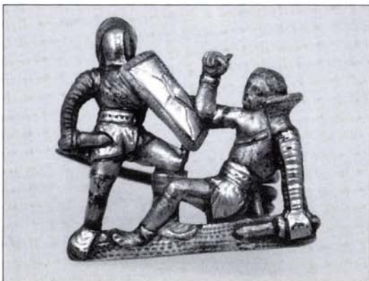
2. kép: Győzelmi jelenetes fibula (Budapest, III. ker., Selmeci utca 29. sírmelléklet)

szomszédos San Marco utca 24–26. (Hrsz.: 174000–174001) telek nyugati részén zárult, ahol a Fischer-Bau Kft. megbízásából folytattunk megelőző feltárást. Itt a katonaváros nagyobb lakóházának részlete került elő, a ház kelet felé, a San Marco utcai úttest alatt folytatódik. A feltárt épületrészlet a 3. század első felére keltezhető, többszörös átépítés nyomaival. Az utolsó átépítések során alakították ki a fűtésrendszert, többperiódusú, egymást kiváltó praefurniumot és fűtőcsatornát sikerült megfigyelnünk.