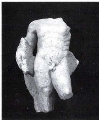
1. kép: Iuppiter szobor töredéke (Budapest, III. ker., Ladik utca 9.)

A gépi bontás megkezdésekor, még az újkori, épülettörmelékes rétegből körülbelül 50 centiméter magas római kori Iuppiter szobor torzója került elő, (R 2318, 1. kép)