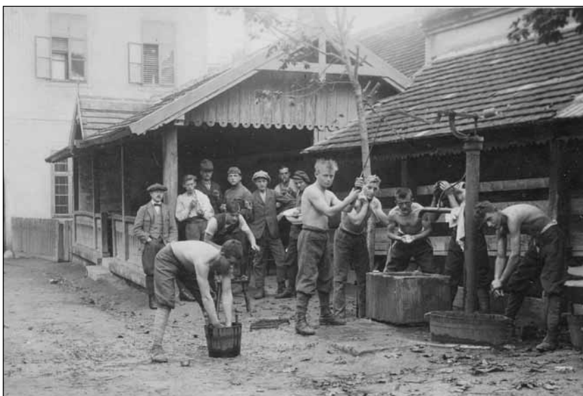
Felkelőélet 1921 októberében (SM fotótár)

őrnagynak és alakzatban betagozódtak a vezetése alatt álló csendőrzászlóaljba V. tiszti század néven. 19