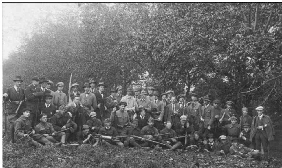
Főiskolás hallgatók Nagymarton térségében