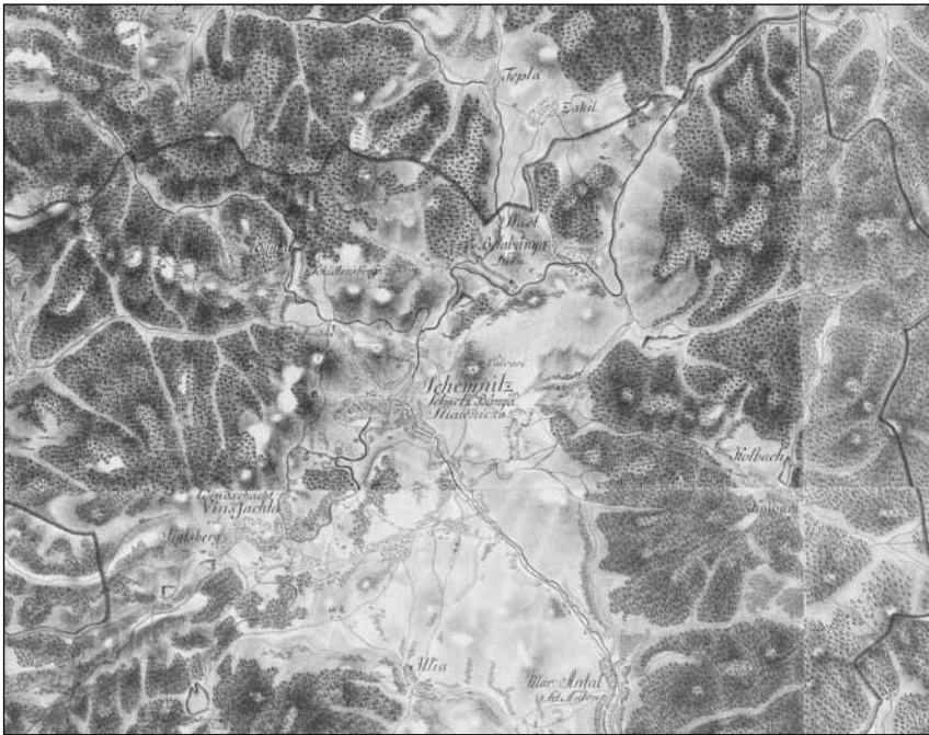
Selmecbánya (Schemnitz) és környéke az I. katonai felmérés térképén (Térképszelvények: XIII-11 (1782), XIII-12 (1782), XIV-11 (1782, 1784), XIV-12 (1784), 1: 28 800, Hadtörténeti Térképtár)

Vallási szempontból római katolikus dominancia jellemezte a várost, hiszen a lakosság 81,5 %-a tartozott ehhez a felekezethez. Rajtuk kívül 14 % evangélikus, 3,5 % izraelita élt a városban. A reformátusok, görögkatolikusok, unitáriusok és ortodoxok aránya 1 % alatt volt. Mivel a népszámlálás nem tért ki a felekezethez kötődő nemzetiségre, ezért erre vonatkozó adatok helyett annyit érdemes megjegyezni, hogy szlovákság és a magyarok jelentős része egy felekezethez, a római katolikushoz tartozott. Mindkét népcsoport elsősorban saját nyelvén misézhetett, hiszen a külutcákban nagyrészt szlovákul is tudó, a századfordulótól erős szláv identitással rendelkező plébánosok vezették az egyházközségeket. Bár egy felekezethez tartoztak, a nyelv miatt bizonyos nemzetiségi elkülönülés ez esetben is megfigyelhető.