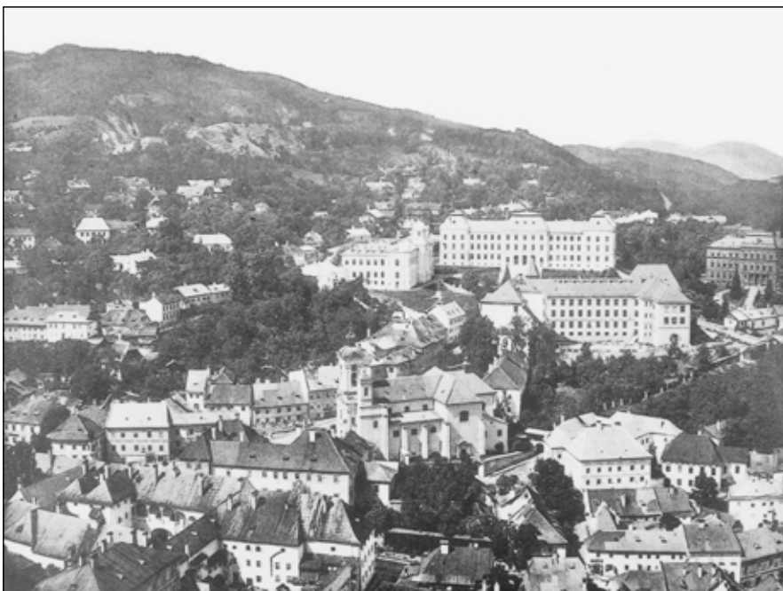
Selmecbánya látképe az áttelepüléskor

mények –, a hanyatló város és az elzártság okozta hangulat is. Mindez azért is érdekes, mert a főiskolai tanárok többsége aktív szereplője volt a helyi közéletnek, nemcsak kulturális, hanem társadalmi, politikai és gazdasági szempontból egyaránt. Ennek tükrében ők bizonyosan tudhatták, mit is jelenthetne a nagy múltú, a város identitásának alapját jelentő főiskola elköltöztetése Selmecbányának.