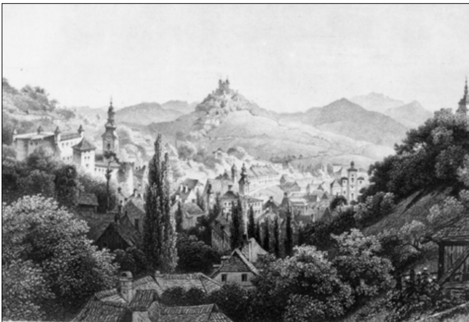
Selmecbánya látképe (XIX. század) (Hunfalvy J.: Magyarország és Erdély eredeti képekben, G.G. Lange, Darmstadt, 1860)

már megvalósított reform volt, de tekintetbe vették a sajátos magyarországi viszonyokat. Az országot kilenc tankerületre osztották, Magyarországon nyolc, Horvátországban egy tankerületet szerveztek, a középiskolák ellenőrzése a tekintélyes főnemeseik közül kiválasztott főigazgatók, az alsó fokú iskoláké a melléjük rendelt tanfelügyelők kötelessége lett. Az iskoláztatás rendjét, az oktatás tartalmát Ratio Educationis részletesen szabályozta. Megállapította az iskolák hierarchiáját az elemi iskoláktól fel az egyetemig, bevezette a falusi iskolákba is a számtant, a középiskolákban pedig Magyarország földrajzának és történelmének tanítását. Az oktatás nyelve alsó fokon a tanulók anyanyelve, magasabb szinten a latin volt. A Ratio Educationis megszüntette az egyházak oktatási monopóliumát. Pozsonyban 1775-ben megkezdte működését egy állami tanítóképző, létrejöttek – főleg alsó fokon – az első állami iskolák. Mindez persze távolról sem jelentette az iskolaügy szekularizációját. A nevelés továbbra is vallásos maradt, de hogy mit és hogyan tanítsanak, azt nem az egyházak, nem a szerzetesrendek, hanem a katolikus államhatalom szabta meg. Emiatt a protestáns egyházak tiltakoztak iskoláik állami felügyelete ellen, s miután az állam nem alkalmazott erőszakot, sikeresen szabotálták a Ratio rendelkezéseit. Az iskolaügy reformja határozott, ha nem is mindenben következetes lépés volt a korszerűség, a felvilágosodás szellemében.