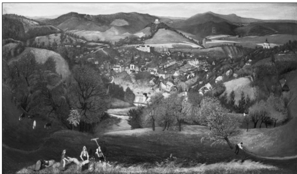
Csontváry Kosztka Tivadar: Selmecebánya látképe, 1902 (Janus Pannonius Múzeum, Pécs)

is, érthető érdekük a főiskola megtartása, nem pedig eleresztése volt. Szitnyai József, majd Horváth (Krausz) Kálmán selmeci polgármesterek közel három évtizedig fáradoztak azon, hogy meggyőzzék a tanári kart, a szakmai szervezeteket, a minisztériumokat, miközben számos város versengett a főiskola odatelepitése érdekében. A legvégső időkben is úgy vélték, hogy a megalakuló csehszlovák államban tovább működhet a főiskola önálló magyar intézmény formájában, és Selmec exklávéként megmaradhat magyar városnak. Ez az illúzió 1919. február 24-ére szertefoszlott, minden remény elveszett a főiskola Selmecen tartására. A polgármesteri törekvéseket a kritikus időszakban pusztító spanyolnátha-járvány is nehezítette, továbbá hogy Horváth Kálmán váratlanul elhunyt 1918 októberében. Selmec végül végleg elvesztette a több mint másfél évszázadon át vele szervesen együtt élő felsőfokú oktatási intézményét, Sopron ugyanakkor alig három hónapos versengés során nyert egy főiskolát. Ebben Thurner Mihály polgármesternek és Laehne Hugó államtitkárnak elévülhetetlen érdemeket tudunk be egy évszázada, de máig kérdéses, hogy az előnyösebb feltételeket nyújtó többi városnak, főképpen a tanári kar és több minisztériumi vezető által is előnyben részesített Gödöllőnek végül is miért kellett alulmaradnia.