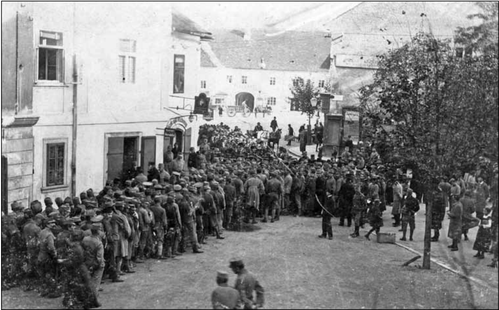
4. kép. Dohányosztás az Előkapuban a nagytrafikban. 1915.

amelyet 1916. január 10-étől vezettek be. 43 Mindenkinék naponta 240 gramm lisztet volt lehetősége elfogyasztani főzésre, illetve kenyérsütés céljára. A liszt- és kenyérjegyeket szintén a városi lisztüzletben lehetett beváltani, és a megadott kereten belül tetszés szerinti arányban válthatták ki a kenyeret, avagy a lisztet. 44