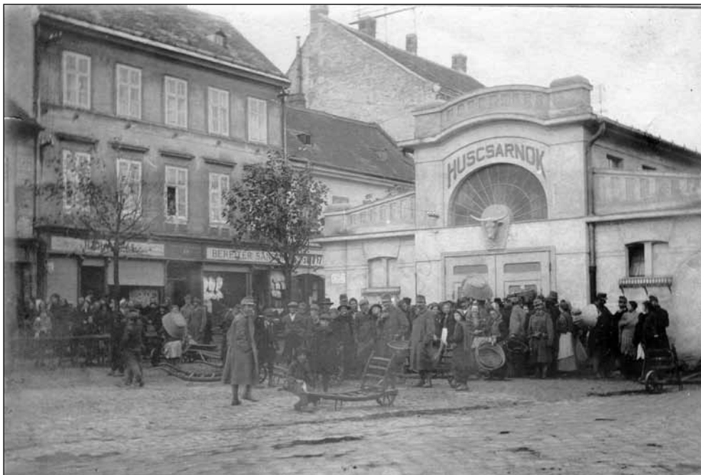
5. kép. Sorbanállás a városi Húscsarnoknál a Kisvárkerületen. Fotós: Gantner Antal, 1915 körül (Soproni Múzeum)

a másik. Az ügyben a Sopronmegyei Gazdasági Egyesület és az Iparkamara szakvéleményét is kikérték. Heimler Károly elmarasztaló ítéletet hozott az ügyben, de dr. Szilvássy Márton fellebbezett. 47