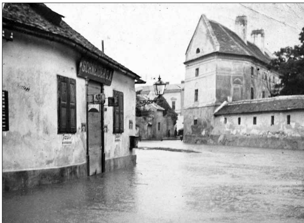
1. kép. Az Ikva áradása. Fotós: Gantner Antal, 1914. július 18. (Soproni Múzeum)

papírkereskedésében (Széchenyi tér 20.) tette ki közszemlére. 24 Az érkező hírek hatására július 26-án az utcák benépesültek. A hömpölygő tömeg éltette a királyt és a háborút. A szerbek ellen szitkok hangzottak el, és a tüntetést a rendőrségnek kellett szétoszlatni. 25 A Soproni Napló szerkesztőségét folyamatosan ostromolták az érdeklődők, és az új nyomdaépület előtt (a Röttig G. és fia nyomda 1914 nyarán költözött új épületébe – Deák tér 56. – de üzlethelyiségét megtartotta a Várkerület 72. alatt) tolongás alakult ki. A Várkerületen összegyűlt tömeg általában a Tschurl-házon keresztül ment a nyomda elé, ahol várta az új különkiadásokat. 26