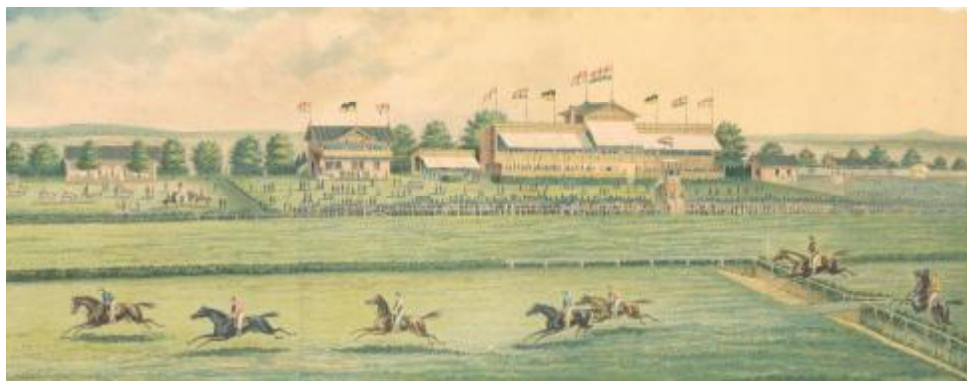
1. kép. Thirring Lajos: Soproni Lóversenyter, 1875 körül. Színezett litográfia. Soproni Múzeum, SOM-KP 54.737.1

osztrák tagok egyaránt tartoztak, akik között Jockey Club tagokat is találunk, így magát az elnököt, vagy herceg Esterházy Pált, valamint az egyik titkári pozíciót betöltő Francis Cavaliero-t 5 , aki egyben a Jockey Club titkára is volt.