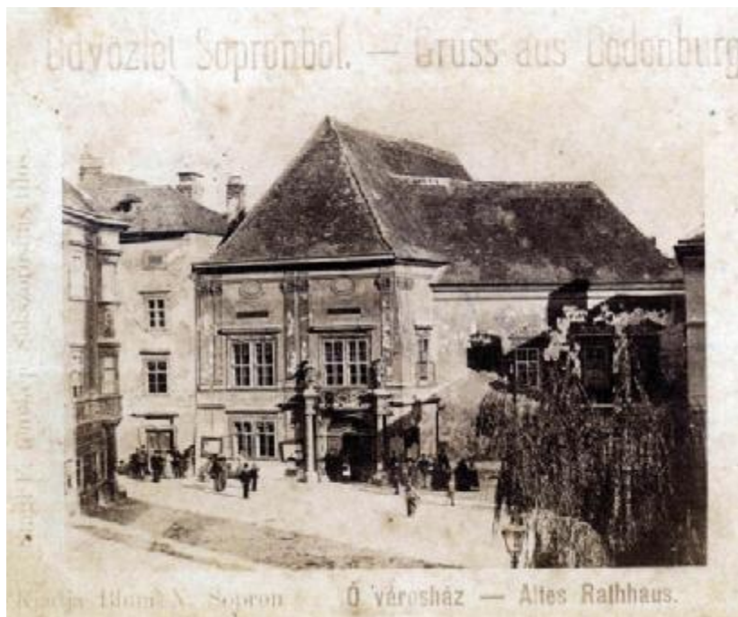
2. kép. A soproni Régi Városháza egy 19. század végi képeslapon

frissebb kutatásokból ismert 81 – a Városháza tanácsterme mindhárom alkalommal az országgyűlés egyik táblájának (1622-ben és 1625-ben a felsőtáblának, 1681-ben pedig az alsőtáblának), azaz a magyar rendek tanácskozásainak helyszíne volt (3. kép).