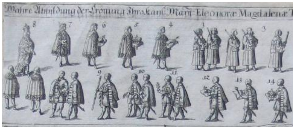
1. kép. A magyar koronázási jelvények Eleonóra Magdolna magyar királyné soproni koronázásán (1681. december 9.)

század vége felé készített, majd utólag többször átfestett – napjaikban az egykor kö-zépiskoláit Sopronban végzett Novák Krizosztom pannonhalmi főapátsága (1802–1828) idejéből származó, 1802-es évszámú, ám az 1850-es évek közepén szintén meg-újított – latin nyelvű díszes felirat emlékeztet. 80 Másrészt Kalmár Katalin házában (legfeljebb egy-két hétig); végül pedig III. Ferdinánd koronázásán a nevezetes négy ég-táj felé való uralkodói kardvágás helyszínén, a soproniak által – többek között az 1915-ben emelt emlékműnek köszönhetően – napjainkban is jól ismert Koronázó-dombon (németül Königsberg , kb. egy rövid órán át). E helyszínek mellett a történeti kutatásnak újabbakkal, a soproniaknak pedig eddig ismeretlen korona-emlékhelyek-vel érdemes számolniuk.