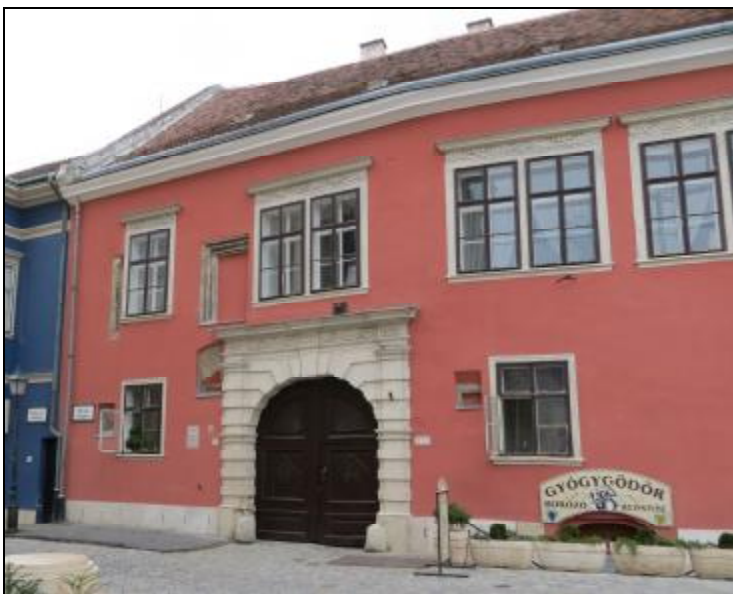
4. kép. Az egykori Natl Lipót-féle, mai Kossow-ház (Fő tér 4.), az uralkodói szállás 1681-ben (a korabeli forrásokban Burg, Aula)

komát a császári-királyi szálláson tartották, ezért 1622. július 26-án és 1625. december 8-án kora délután a városkapitányi házban, 1681. december 9-én pedig a Natl-féle épületben a legfőbb magyar felségjelvény komolyabb szerephez jutott. 86 Az előbbi két alkalommal egy aranytálba helyezve még az asztalfőre került, majd 1681-ben – a német-római királykoronázások hatására 1655-ben Pozsonyban meghonosított gyakorlatnak megfelelően – egy vörös bársonnyal borított, oldalt álló kis asztalra helyezték. A bécsi udvari és a magyar királysági politikai elit egy szűkebb része itt a két magyar koronaőr őrizete alatt, azaz úgymond egyfajta szűkebb körű közszemle keretében meg is tekinthette – ám csakis a koronát, a többi koronázási jelvényt a 17. században ugyanis már nem hozták be az ünnepi bankettekre. Sőt, 1681 decemberében a korona különleges módon még a szomszédos – egykori kapitányi – házban (az akkori Esterházy grófi palotában) is „megfordult”, hiszen ekkor a királyi udvar megfelelő színvonalú berendezése, valamint a lakoma és az audienciák számára is megfelelő nagyságú „lovagterem” kialakítása érdekében a polgármesteri házat összenyitották a szomszédos épülettel. 87