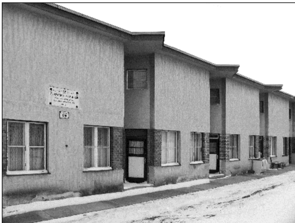
6. kép. Brennerbergi út 19. sz.

A 19–20. század polgári társadalmá fokozott szociális érzéket mutatott a munkavállalókkal szemben. Ennek dokumentumai a Sopronban is megszorodó munkáslakás-építkezések. Maga a város is épített bérházakat, így 1927-ben, a Városi Mérnöki Hivatal tervei szerint monumentális házsort emeltek a Győri úton (5.–11. sz.). Munkáslakásnak épült a Vasárugyár Rt. 48 lakásos épületegyüttese a Bánfalvi út 10. szám alatt. 51 A Fésűsfonógyár Rt. vezetőinek és munkásainak 1941–1943 között Franz Schuster bécsi építész terveinek felhasználásával három lakóházat építettek a Besenyő utcában (17 – 19. sz.). Sajnos itt a védelmi javaslat már későn érkezett, hiszen az Ágfalvi út sarkán álló épületet emeletráépítéssel a felismerhetetlenségig eltorzították. Az Aggyag utcai, nyerstéglából épült munkáskolónia jellegzetes épületeire Hadas László építész hívta fel figyelmünket.