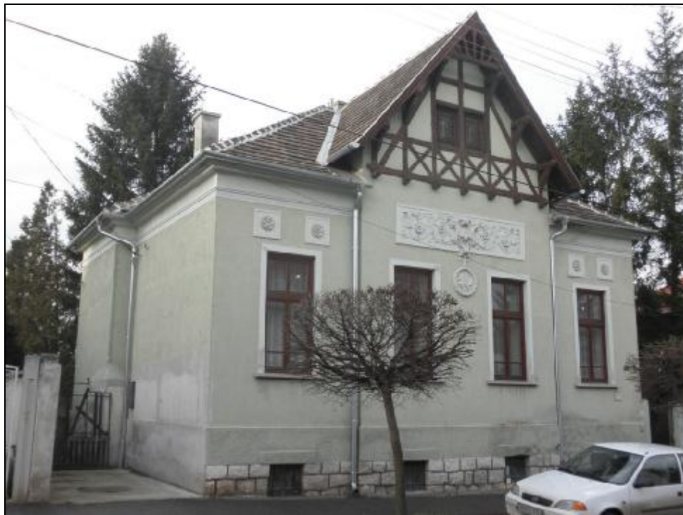
5. kép. Zrínyi Miklós u. 22. sz.