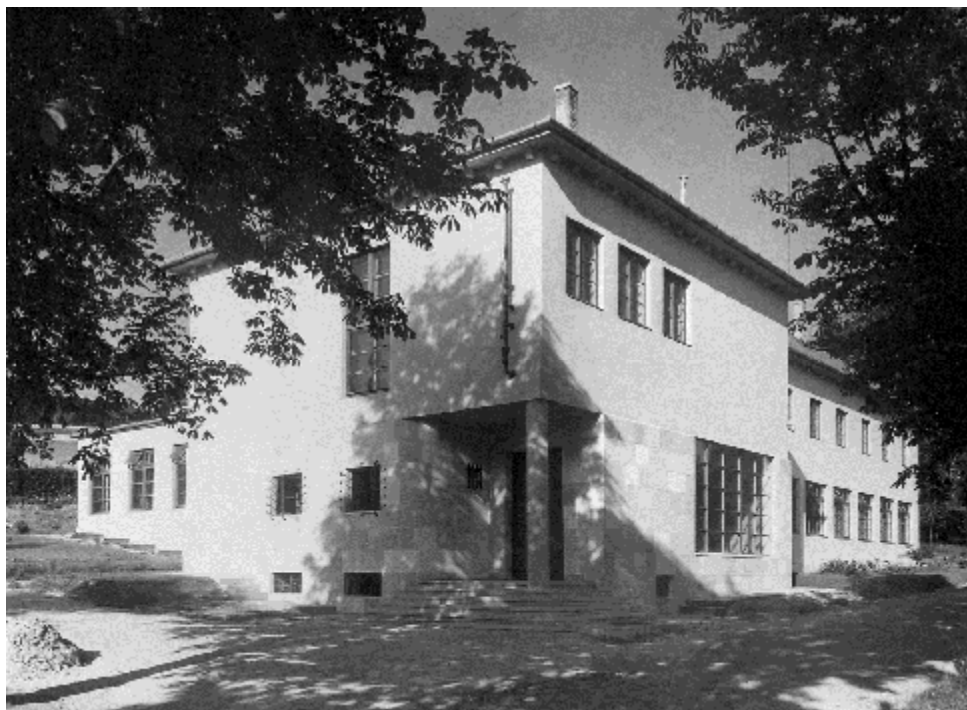
13. kép. Bajcsy-Zsilinszky u. 4. sz. Matematikai épület

parkot keretez. Összképét az elmúlt évtizedben, a Mátyás király úti szárnya fölé épített, aránytalan saroktömeg előnytelenül befolyásolja. A szocialista-realista stílus reprezentatív emléke az 1955-ben, az Ady Endre út 10. szám alatti telken felépült Sotex kultúrház (1950–1952). Itt az igényes belső terek megtartása is indokolja a teljes körű helyi védelmét. 60 A Templom utca 24. számú háromemeletes lakóház Füredi Oszkár tervei alapján 1959-ben épült: kialakítása még erősen mutatja a letűnt „szocreál” stílusát. Az ipari építészeti európai híré alkotása a Vándor Sándor út 2. számú, egykori épületasztalosáru-gyár. 61