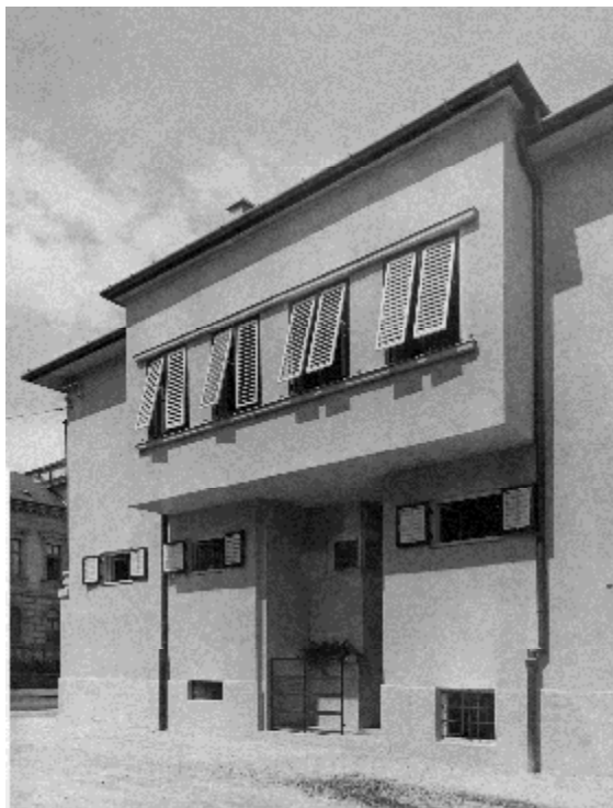
10. kép. Damjanich utca 1. sz. spalettás ház

A Mátyás király utca kiépítése a Belváros felé történt megnyitása után (1938) gyorsult meg. Egységes, korai modern házsora színvonalában Budapest, Újlipótváros 57 korszerű beépítésével vetekszik. A Mátyás király utca számú kétemeletes modern lakóházai az 1–3. számú háztól a 17. számú házig 1935–1940 között épültek fel Somlai Aladár, Winkler Oszkár és Füredi Oszkár 58 tervei alapján. Harmonikus térfal jött létre az Alsó-Lóverekben is (Bajcsy-Zsilinszky utca 1. – Batthyány tér 1. sz.). Utóbbi házsor egységes homlokzati kialakítását kívánjuk védeni (10. kép).