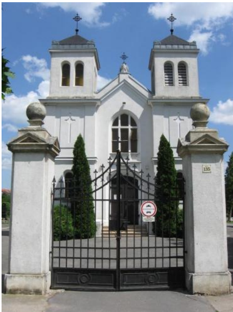
1. kép. Balfi út, evangélikus temető ravatalozója (Wallon-Hárs Viktor felvétele)

Az egyházak, mint kollektív építetők, a 19–20. században is jelentős értékeket hoztak létre Sopronban. Vidéki építészetünk sajátos emléke a r.k. temető Szent Mihály út – Pozsonyi út sarkán álló neogót ravatalozó épülete, melyet 1911-ben Schármár Károly épített. A Balfi úti evangélikus temető hellénizáló halottsházának és gondnoki lakásának épületepárját 1886-ban historizáló modorban, Schmid és Alber brünni építészek tervezték. A soproni szecessziós ravatalozója (1905). 42 Érthető, hogy itt is a teljes épület-együttes védelmét szorgalmazzuk (1. kép).