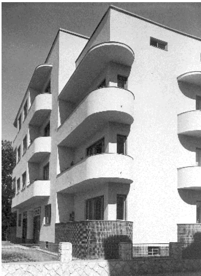
8. kép. Frankenburg u.6. sz.