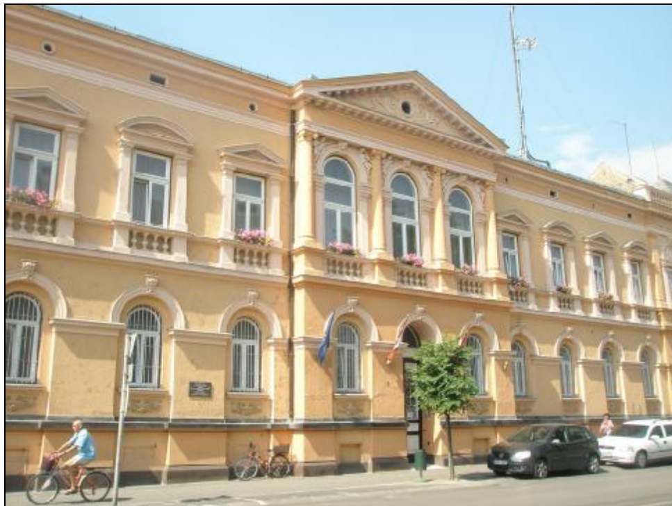
3. kép. Lackner Kristóf u. 5. sz.