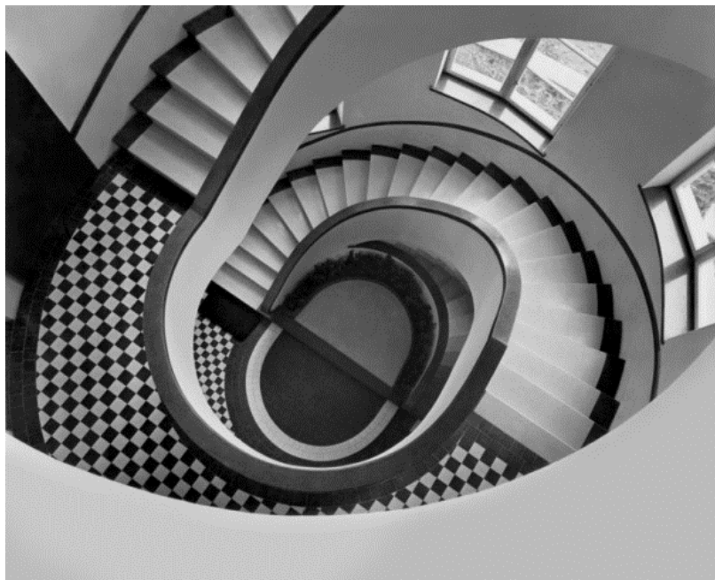
9. kép. Deák tér 49. sz. lépcsőháza

A lakóházépítésben a 20. század első felében a bérházformát mindinkább a társasházak váltották fel. Sopronban egy sor, komfortjában és építészeti kialakításában egyformán kiemelkedő minőségű lakóház épült. A Frankenburg út 6. számú háromemeletes társasházat 1930-ban Winkler Oszkár tervezte (8. kép). 55 Szomszédságában több lakóház is hasonló stílusban épült (pl. Frankenburg út 4.). Dél felől tekintve az épületsor egységes, korszerű arculatot ad a történeti Belvárosnak. A Vörösmarty utca összképét is modern házai határozzák meg (3–5. és 10. szám).