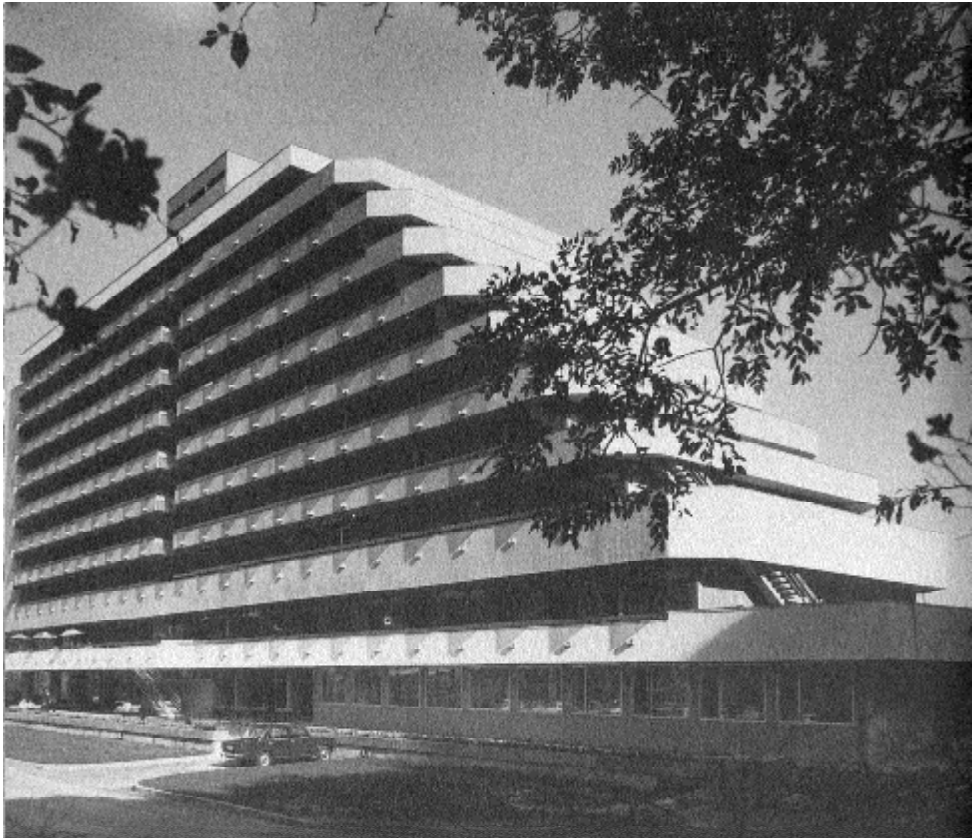
14. kép. Lóver körút 37. sz.

tömege Cserhalmy József 62 és munkatársai tervei alapján, 1973-ban épült (14. kép). A Ferenczy János utca 7. számú Vas-és Villamosipari Szakközépiskola Lang János 63 alkotása 1988-ból. A Lenkey utca 5. számú rendelőintézet épületét Ujváry Rudolf 64 1970 körül új szárnyal bővítette. Az ő alkotása a környezetéhez jól alkalmazkodó Új utcai 23. számú Palatinus Szálloda is. A Szent Mihály temető új bejáratát Solt Herbert 65 tervezte 1993-ban.