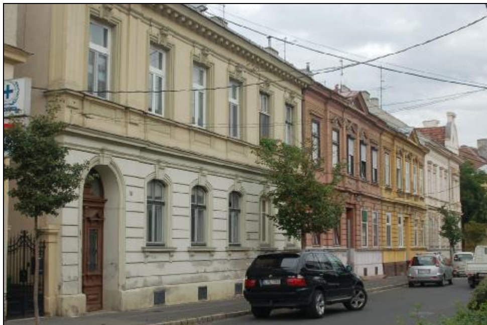
4. kép. Wesselényi utca 13-23. sz.

A közlekedés emlékei közül a Vitnyédi utcai, egykori villamos kocsiszín épületét már nem találtuk meg. Szomszédságában védelmet érdemel a kőszén alapú gázgyár Flandorffer Ignác emléktáblájával megjelölt földszintes téglapülete. Legalább egy-egy típusát meg kellene tartani a vasúti pályák mellett álló őrház-épületeknek (GYSEV őrház a Batsányi utca közelében, Déli pályaudvar fogadóépülete és irányító-tornya a Baross úton.) Mivel ezek az épületek eredeti rendeltetésüket elvesztették, számukra új hasznosítást kell keresni.