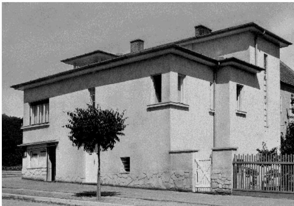
7. kép. Hunyadi János u. 32.-Mikoviny u. 21. sz.