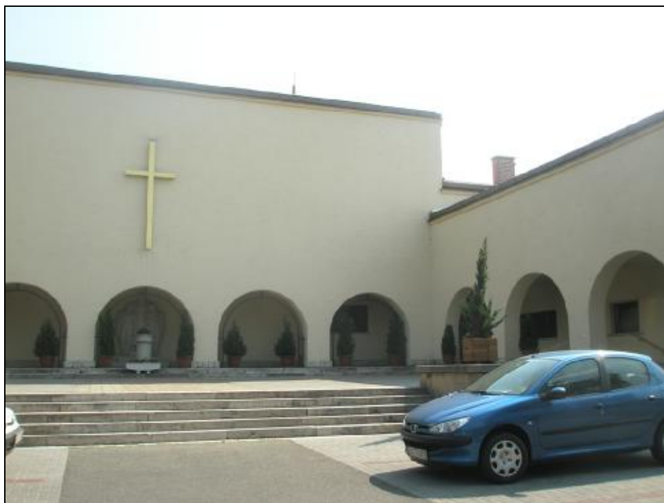
2. kép. Szt. István-park

A Szent Margit út 4. számú Szent Margit kápolna és plébánia Schármár Károly elképzelései alapján lakóháznak épült (1909-ben), a tipikus, „lőver-formájú” épület csak később kapott egyházi rendeltetést. A reformátusok Deák tér 2. számú templom- és plébániaépületét Hárs György építette 1926–1929 között, a neobarokk késői stílusában. A korai modern építészet első egyházi emléke a Szent István park 1. szám alatti Szent István r.k. templom, mely 1939-ben Körmeny Nándor tervei alapján valósult meg. Nem csak markáns külső megjelenése, hanem félkör alaprajzú, árkádos belső tere is kiemelkedő alkotás (2. kép).