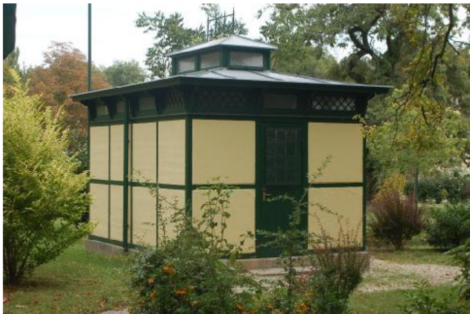
15. kép. Sopron Erzsébet kert nyilvános illemhely

Balf fő utcájának népi épületei közül néhány még megtartotta eredeti fésűs beépítését és karakteres oromfalas homlokzatát (Fő utca 54., 56. 58. sz.). Különös helytörténeti emlék a Bozi utca 2. kora historizáló fogadóépülete.