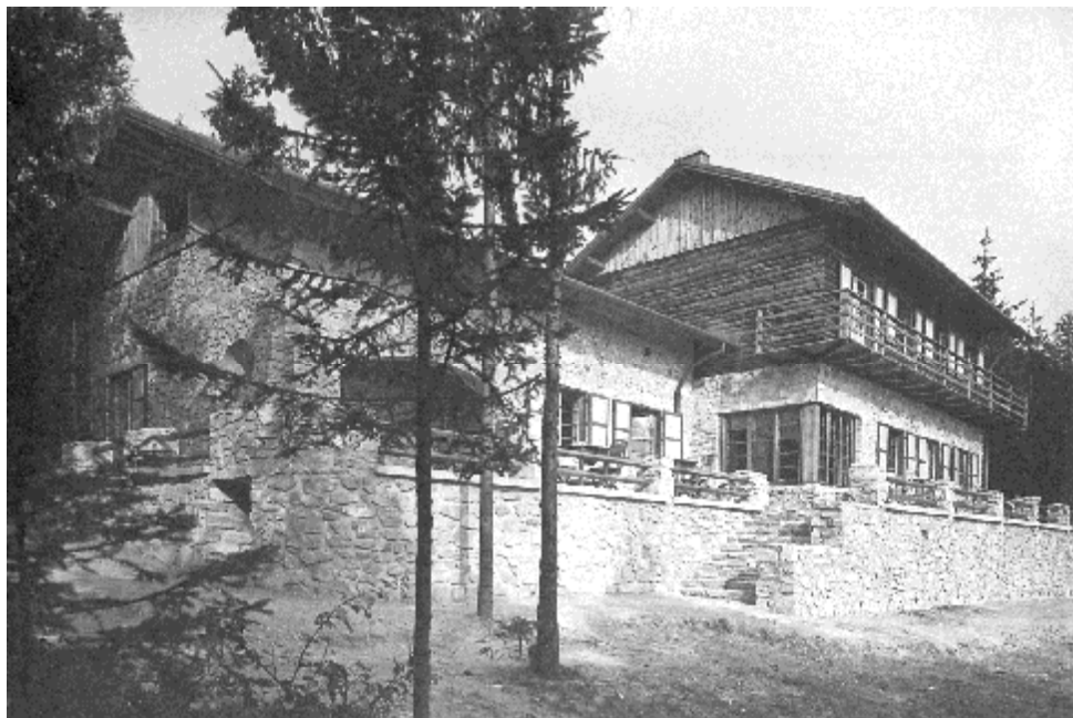
11. kép. Turistaház a Nyíresen.

ben Winkler Oszkár 1936-ban építtette az István-menedékházat: a tájba illő, szép épület csak részben maradt fenn (11. kép). Szerencsés módon megőrizte jellegzetes külső megjelenését a Füredi Oszkár tervei alapján, 1938-ban épült „Hernfeld-panzió” a Deákúti út 10. szám alatt. Tömböly Dénes 1942-ben készült üdülőegyüttes tervét – Váris út 2. szám – a háború kitörése miatt csak részben kiviteleztek. 59 Az idegenforgalmat szolgálta a Károly magaslat kilátójának dinamikus architektúrája, Winkler Oszkár alkotása (1933) (12. kép).