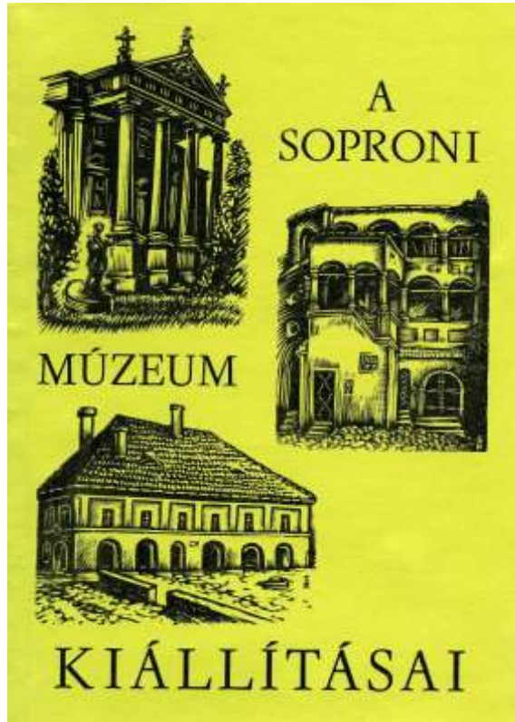
9. kép. A Soproni Múzeum kiállításai. Katalógus címlap. 1966.

bácsi metszeteivel (9-11. kép). Csatkai Endre száznál több különkiállítása mind Sterbenz Károly közreműködésével készült. Munkái bemutatták a város művelődéstörténetét, évtizedeken át szolgálták az iskolai oktatást, a közművelődést. Mi fiatalok, a „fiai” rendkívül sokat tanultunk e kiállítások révén a „soproniensiából”. Módszertanilag is kiemelkedő volt egy-egy grafika, festmény „előképének” felderítése és bemutatása.