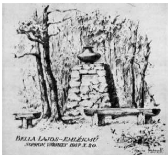
7. kép. Bella Lajos-emlékmű a Várhelyen. Tusrajz. SSz. 12 (1958), 369.