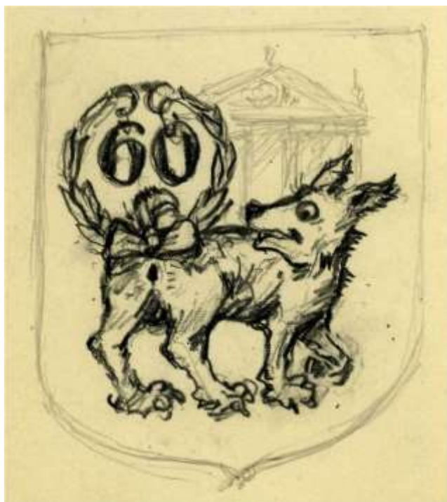
12. kép. „A jutalom” 1976. tusrajz.