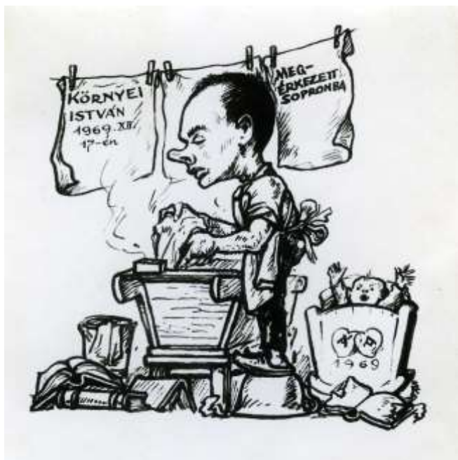
5. kép. Környei István születésének értesítője, Tuszrajz, 1969.