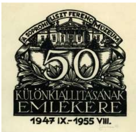
3. kép. Az 50. különkiállítás emléklapja, 1955.