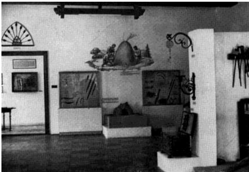
1. kép. A soproni vasipar története. Falikép, Lábasház, 1955.