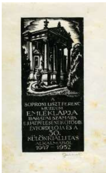
2. kép. A 30. különkiállítás emléklapja, 1952.