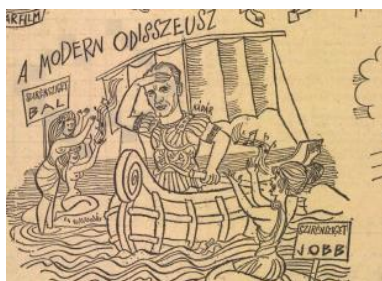
1. kép: Kádár, a modern Odisszeusz

A képes összeállítás központi szereplője Kádár, a mindennapok, a köznapi ember hősi figurájának 14 pózában tűnik fel, aki modern Odüsszeuszként vezeti az ország hajóját a jobboldal veszélyeinek (a revizionizmusnak) és a baloldal túlzásainak (a szélsőbalosságnak) a veszélyes szirtjei között (2. kép). A kétfrontos harc, a kompromisszumos közép pozíciójának elfoglalása, az egyensúlyteremtés a különböző szereplők között a mindenkor kádári politika egyik legfontosabb jellemzője volt, amit a rajz ismert toposzok (a hajó, mint az ország kormányzása és Odüsszeusz egyik kalandja) segítségével idéz meg. A csábításoknak nem engedő vezető a messze jövőbe tekint elő, az aktuális kísértések helyett a hosszútávú célokat részesíti előnyben.