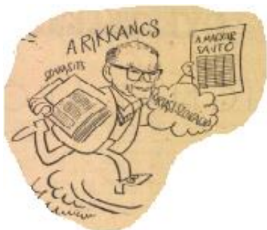
13. kép: Szakasits, a rikkancs

A 14. kép a tömegkapcsolatok fontosságát is kifejezi, a Népfrontot tematizáló képek ugyanezt a kérdéskört egy másik oldalról világítják meg. Szakasits Árpád nemcsak szociáldemokrata politikusként és a munkáspárti egyesítés előkészítőjeként volt ismert a kor közéletében, hanem újságíróként is. 1958-tól a Magyar Újságírók Országos Szövetségének (MÚOSZ) elnöke 24 – ebben az időben a publicisztika a konszolidáció egyik legfontosabb területe volt, hiszen korábban éppen az írók és zurnaliszták álltak ellen az új kádári hatalomnak, 1956 végén. Az óriási szenzációt kihirdető rikkancs-szereplő már egy újfajta, magazin-típusú (vagy bulvár) újságírást hirdet, ami jobban megfelelt a közélettől való elfordulásnak, a kádári társadalmi egyezség egyik előfeltételének.