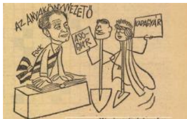
8. kép: Fock, az anyakönyvvezető

A következő, 9. képen szereplő politikustól, Fock Jenőtől vette át a Mezőgazdasági Osztályt Fehér Lajos 1959-ben, államgazdasági ügyekkel kezdett foglalkozni, majd 1961-től a Minisztertanács elnökhelyettese lett. Az anyakönyvvezető megnevezés valószínűleg az 1963. évi 33. rendeletre utalt, ami a Belügyminisztériumtól a Minisztertanács elnökére ruházta át az anyakönyvezés feletti ellenőrzést. 17 A Minisztertanács elnöke ekkoriban Kádár volt, aki vélhetően Fockra bízta a felügyeletet, így megkezdődhetett a házasságok futószalagszerű gyártása – az előző képhez hasonló tömegtermeléssel, de itt nem határozatokkal bevetve a földet, hanem ásó- és kapagyárként működve.