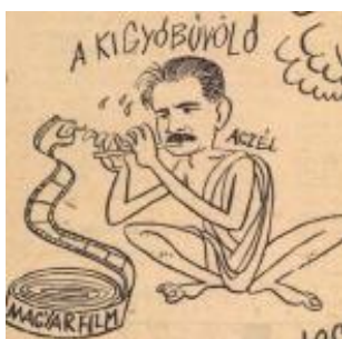
14. kép: Aczél, a kígyóbűvölő

A 14. kép a tömegkapcsolatok fontosságát is kifejezi, a Népfrontot tematizáló képek ugyanezt a kérdéskört egy másik oldalról világítják meg. Szakasits Árpád nemcsak szociáldemokrata politikusként és a munkáspárti egyesítés előkészítőjeként volt ismert a kor közéletében, hanem újságíróként is. 1958-tól a Magyar Újságírók Országos Szövetségének (MÚOSZ) elnöke 24 – ebben az időben a publicisztika a konszolidáció egyik legfontosabb területe volt, hiszen korábban éppen az írók és zurnaliszták álltak ellen az új kádári hatalomnak, 1956 végén. Az óriási szenzációt kihirdető rikkancs-szereplő már egy újfajta, magazin-típusú (vagy bulvár) újságírást hirdet, ami jobban megfelelt a közélettől való elfordulásnak, a kádári társadalmi egyezség egyik előfeltételének.