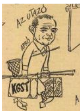
12. kép: Apró, az utazó

Kállai Gyula, a Minisztertanács elnökhelyettese szintén kötődött a Népfronthoz, hiszen az Országos Tanács elnöke is volt (Kállai egyébként a hatvanas évek elején rengeteg valódi és formális-reprezentatív tisztséggel rendelkezett) – ezért is tartja a kezében az „Éljen a Népfront” zászlócskát, ami szokatlanul kisfiússá teszi az ekkor 53 éves politikusról készült rajzot (12. kép). A függetlenné váló afrikai és ázsiai országok évtizedében a harmadik világ különösen vonzó célpontnak számított a kommunista rendszerek terjeszkedésének kontextusában: 1962-ben például Kállai nagy Afrika-körutat tett (ez magyarázza a címet), meglátogatta Guineát, Malit, Dahomey-t, Ghánát, Nigériát, Marokkót és Algériát. 22