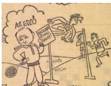
2. kép: Biszku, az edző

A képes összeállítás központi szereplője Kádár, a mindennapok, a köznapi ember hősi figurájának 14 pózában tűnik fel, aki modern Odüsszeuszként vezeti az ország hajóját a jobboldal veszélyeinek (a revizionizmusnak) és a baloldal túlzásainak (a szélsőbalosságnak) a veszélyes szirtjei között (2. kép). A kétfrontos harc, a kompromisszumos közép pozíciójának elfoglalása, az egyensúlyteremtés a különböző szereplők között a mindenkor kádári politika egyik legfontosabb jellemzője volt, amit a rajz ismert toposzok (a hajó, mint az ország kormányzása és Odüsszeusz egyik kalandja) segítségével idéz meg. A csábításoknak nem engedő vezető a messze jövőbe tekint elő, az aktuális kísértések helyett a hosszútávú célokat részesíti előnyben.