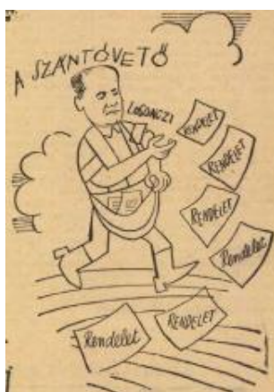
7. kép: Losonczi, a szántóvető