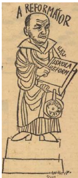
3. kép: Ilku, a reformátor

A katonai vonalról érkezett Ilku Pál hasonló (vagy még erőteljesebb) keménységet sugall önmaga szobraként (4. kép) – 1956 után ő is részt vett a megtorlásban, a karhatalom irányításában (később honvédelmi miniszterhelyettes lett), ebben az időben azonban már teljesen „polgári” foglalkozása volt. 1961-től 1973-ig művelődési miniszterként dolgozott, nevéhez fűződik az iskolareformot hivatalosan is bevezető, a magyar iskolarendszert átalakító 1961. évi. III. törvény (a Magyar Népköztársaság oktatási rendszeréről), amelynek egyik kulcsfogalma a politechnika, a munkára nevelés volt. A rajznak azonban másodlagos jelentéssrétegei is vannak: a tógaszerű öltözet utalhat az akadémiai jellegre, esetleg a klasszikus antikvitásra (bár itt nem világos ennek értelme, ellentétben Kádárral); a reformátor elnevezés pedig a protestantizmus mindent felforgató, az egyházi világot gyökeresen átalakító Luther tevékenységével rokonítja Ilku iskolareformját. Lutherhez hasonlóan Ilku is sziklaszilárdan áll, mert mást nem tehet a támadásokkal szemben; a miniszter gondolkodó, tépelődő arckifejezése is talán valami hasonlót fejez ki.