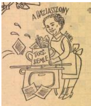
4. kép: Benke, a háziasszony

A katonai vonalról érkezett Ilku Pál hasonló (vagy még erőteljesebb) keménységet sugall önmaga szobraként (4. kép) – 1956 után ő is részt vett a megtorlásban, a karhatalom irányításában (később honvédelmi miniszterhelyettes lett), ebben az időben azonban már teljesen „polgári” foglalkozása volt. 1961-től 1973-ig művelődési miniszterként dolgozott, nevéhez fűződik az iskolareformot hivatalosan is bevezető, a magyar iskolarendszert átalakító 1961. évi. III. törvény (a Magyar Népköztársaság oktatási rendszeréről), amelynek egyik kulcsfogalma a politechnika, a munkára nevelés volt. A rajznak azonban másodlagos jelentéssrétegei is vannak: a tógaszerű öltözet utalhat az akadémiai jellegre, esetleg a klasszikus antikvitásra (bár itt nem világos ennek értelme, ellentétben Kádárral); a reformátor elnevezés pedig a protestantizmus mindent felforgató, az egyházi világot gyökeresen átalakító Luther tevékenységével rokonítja Ilku iskolareformját. Lutherhez hasonlóan Ilku is sziklaszilárdan áll, mert mást nem tehet a támadásokkal szemben; a miniszter gondolkodó, tépelődő arckifejezése is talán valami hasonlót fejez ki.