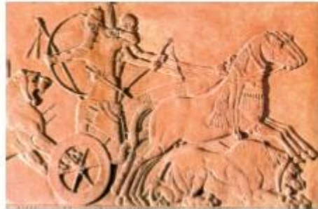
Asszír harci szakár, Kr. e. 8–7. század ● Hasonlítsa össze a két harci szakár ábrázolását! ● Milyen különbségek olvashatók le a képekről? ● Mi lehetett a változások jelentősége?