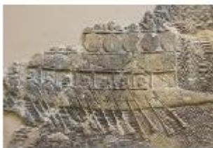
A föníciai hajók elérték a Brit-szigetek partjait és Nruusz-Af-át, sőt állítólag megkerülték Afrikát is. A tengeri kereskedelemben azonban egyre komolyabb vetéltséget jelentettek számukra a cörvények.

● Honnan tudhatjuk, mikor készült a jelentés? ● Mit mondtak a núbiaiak a sivatagról? ● Vajon miért jöttek Egyiptomba? ● Vajon miért küldték őket vissza a sivatagba?