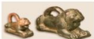
Asszír királati utastárára készített bronzlombok, Kr. e. 8. század ● Milyen állatot mintáznak a súlyok? Vajon miért? ● Az állam mely szerepére utalnak ezek a tárgyak?