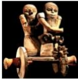
Mezopotámiai harci szakár, Kr. e. II. évszázad

Babilontól északra terült el fő vetélytársa, Asszír. Az asszírok többször meghódították és lerombolták Babilont, de az mindig újjáépült, s végül túlélte az asszír állam bukását.