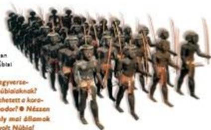
Ez volt a szelidő núbiai zsoldosok

A földművelő civilizációk és a nomádok viszonya nagyon változatos volt. Gyakran együttműködtek, kicserélték termékeiket, előfordult, hogy „beszivárogtak” egymás területeire, munkásként vagy zsoldosként szolgáltak, de gyakran az is megesett, hogy megpróbálták leigázni egymást.