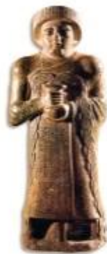
Gudea, a sumer Lagas város uralkodójának szobra Kr. e. 2100 körül készült. A király kezében tartott edényből folyók erednek. A készítő tavasszal, kora nyáron érkező áradásokat mással kellett távol tartani a bevetett földektől, majd a forró nyár folyamán csatornákat, tárolók és vízemelőket segítségével a földekre kellett juttatni a vizet. ● Mit jelképeznek a király kezéből eredő folyók? ● Mi az üzenete a szobornak? Adjon címet nekik!

AZ ÓKORI KELET Kr. e. 7000 és 3000 között a világ számos részén megkezdődött a mezőgazdasági termelés – így Közép- és Dél-Amerikában, Nyugat-Afrikában, Európában, Új-Guineán. Az első földművesek ott számíthattak a legnagyobb termésre, ahol a nagy folyók áradásos területein öntözéses növénytermesztést alakítottak ki a Nílus, az Eufrátesz és a Tigris, az Indus és a kínai Sárga-folyó völgyében. Itt, az ún. ókori Kelet területén alakultak ki Kr. e. 3500 és 2000 között az első civilizációk: lakóik városokat építettek, írásbeliséget, fejlett tárgyi és szellemi kultúrát alakítottak ki, és létrehozták az első államokat.