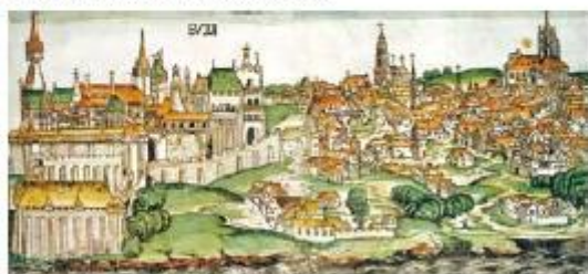
Buda középkori látképe (Michael Wohlgemuth rajza, 1470-es évek)

tették. A corvinák a bőrkötéseken feltüntetett hollós címer (corvinus: 'hollós') után kapták a nevüket – a holló Mátyás címerállata volt. Bár a könyvnyomtatás is megjelent Budán (Hess András), a 15. században még nagyon kevés nyomtatott könyv került kiadásra. Sajnos a Mátyás-időszak reneszánsz építkezései (illetve a korábbiak is) a török kor időszakában megsemmisültek , így azokat csak az írásos források és régészeti feltárások alapján lehet rekonstruálni.