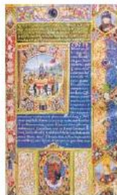
Egy corvina díszített oldala