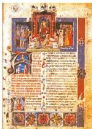
A Képes Krónika címlapja

Az írásos emlékek közül kiemelkednek a történetírók munkái (geszták, krónikák) és az egyházi írók művei (legendák, vallási himnuszok, imakönyvek). Az Árpád-kor szentjeiről (István, Imre, László, Margit, Erzsébet) számos legenda keletkezett. Kultúrtörténetileg érdekesek a kor magyar nyelvemlékeit megőrző művek ( Halotti beszéd, Ómagyar Mária-siralom ).