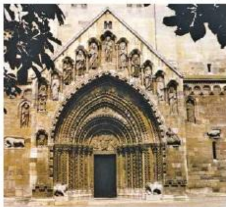
A Jákai templom (13. század)

Magyarországon kis számban maradtak fenn a nyugat-európai stílusirányzatok emlékei. A román korszak (11–12. század) és a gótikus kor (13–15. század) épületeit nagyrészt forrásokból ismerjük. Az állandó királyi székhelyek is csak a 14–15. században jöttek létre, hiszen az országot kíséretükkel körbeutazó királyok kezdetben ritkán rendezkedtek be egyetlen központban. A kialakuló királyi udvar (főnemesek, udvari nemesség, egyházi személyek, csatlósok) kulturális központként is működött. Az Anjou-kori építészetben már a gótikus irányzat érvényesült, nagyobb építkezésekre a királyi központokban, Visegrádon (palota) és Budán került sor. A nyugati lovagkort idéző várepítészet (Diósgyőr) szintén ekkor honosodott meg.