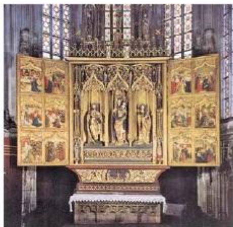
A kassai Szent Erzsébet-templom főoltára (1470-es évek, fából faragott késő gótikus szárnyas oltár)