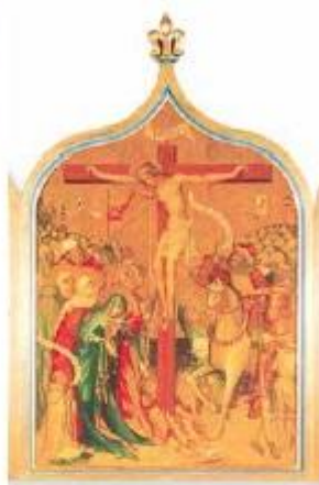
Kolozsvári Tamás: Kálvária – A garam-szentbenedeki apátság oltárképrészlete

A magyar középkor szellemi és anyagi kultúrája jelentős változásokon ment keresztül az évszázadok során. Az Árpád-korban a latin nyelvű írásbeliség és műveltség fő hordozója az egyház volt. Az írásbeliség elterjedésében nagy szerepet játszott a III. Béla által létrehozott királyi kancellária (1181), amely az uralkodói rendeleteket, határozatokat rögzítette. A hazai oktatás (a káptalani és a városi iskolákban) középszintű végzettséget adott, nagyobb műveltségre csak a külföldi egyetemeken lehetett szert tenni. A középkorban az uralkodók háromszor próbáltak egyetemet alapítani (Pécs – 1367; Óbuda – 1395; Pozsony – 1467), de az intézmények rövidesen anyagi gondok, illetve más egyetemek (Bécs, Prága, Krakkó) közelsége miatt megszűntek. Az Anjou-korban a kancelláriákban és a megyei igazgatásban megjelent a hazai képzésből kikerülő világi értelmiség (birtokos nemesek és polgári származásúak). Az egyházi adminisztrációba (például királyi kápolna) ekkor már külföldi egyetemeket végzett klerikusok kerültek.