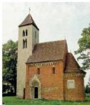
A csempeszikopácsi Szent György-templom (13. század)

Állapítsuk meg, melyik építészeti stílus alapján épültek a templomok! Nézzünk utána, kiknek a szobrai találhatóak a jáki templom bejárata fölött!