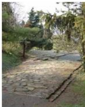
Savaria – Borostyániút

Az egyik legnépesebb város, Aquincum (mintegy 40 ezer lakos) fejlődése az 1. század végén kezdődött. Előbb légiós tábornok telepítették a Dunához, majd mellette a katonaváros jött létre (kiszolgáló személyzet, hadsereg beszállítói stb.). Nemsokára kialakult a polgárváros, ahol főleg veterán katonák éltek, később beköltöztek a kereskedők, iparosok is. Aquincumban nem telepítettek római polgárokat, de a formálódó város a római civilizáció minden vivmányával (vízvezetékek, közfürdők, amfiteátrum stb.) rendelkezett. Vallástörténetileg érdekes Sopianae szerepe. A város csak a késői korban vált jelentősebbé, a 4. században valószínűleg tartományi székhely lett. Ebből az időszakból ókeresztény emlékek származnak: festett falú sírépítmények maradványai. Az egykori temetőkápolnákat a római uralom után is keresztény kultuszhelyként használták. A „viharos” Kárpát-medencei történelem miatt római kori városok, épületek nem maradtak meg épségben napjainkra, a régészet elsősorban a romvárosok feltáráásával rekonstruálja a múltat.