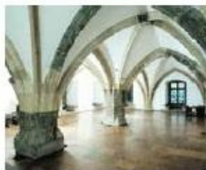
Gótikus lovagterem a budai Várban

A Zsigmond-kori művelődés az Anjou-időszak folytatásának és a lovagi eszmények kiteljesedésének (lovagi tornák, a fejedelmi találkozókát kísérő nagyszabású ünnepek) tekinthető. A királyi udvar kulturális szerepe megmaradt, Zsigmond végleg áttette a székhelyét Budára (Friss-palota építése), és megkezdődött Pozsony átalakítása is. Az európai politikában aktívan tevékenykedő uralkodót elkísérő főurak és udvari nemesek látóköre kiszélesedett. A kor bárói – hatalmas magánvagyonukat fel-