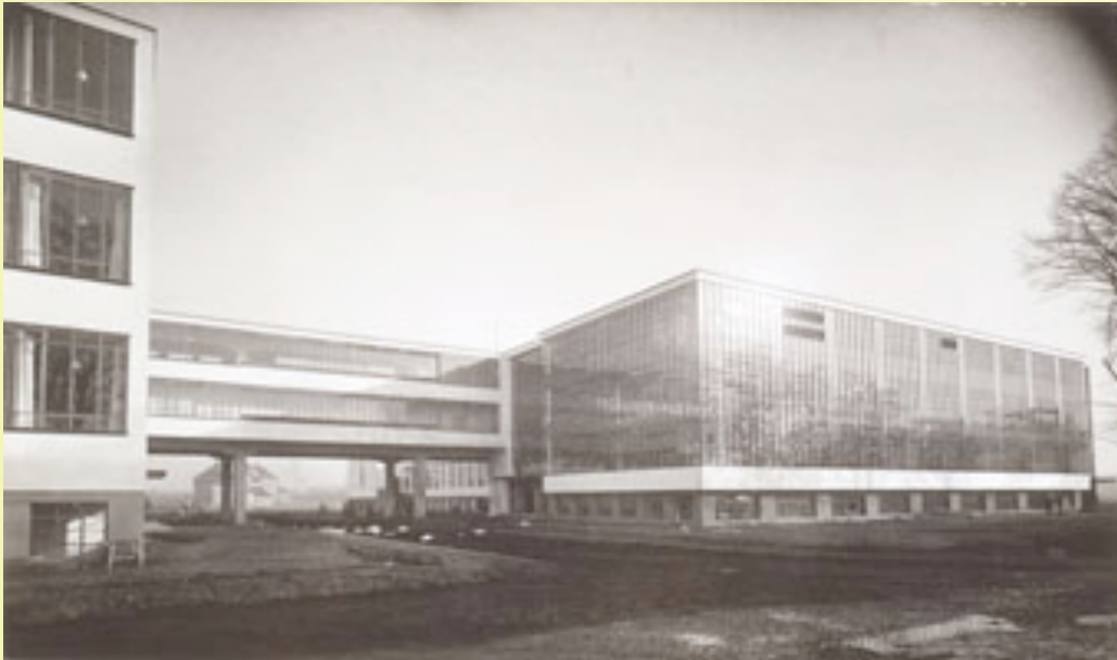
2. ábra: Walter Gropius: Bauhaus Dessau, 1925/26, északnyugati nézet, fotó: Lucia Moholy, 1926

A művészek és a képművesek, a tanítás és a tervezés, a szépművészet és az iparművészet közötti megkülönböztetés hatályát veszítette. „A művészet és a technológia - az új egység”- hirdették, az iparági lehetőségeket ki kell használni, cél a funkcionális és esztétikus design. A Bauhaus-műhelyekben előállított prototípusok célja a tömeges gyártás volt. Végeredményben az I. világháború hatására létrejött gépipari gyártási technológiát használták ki a tömegtermelés céljaira.