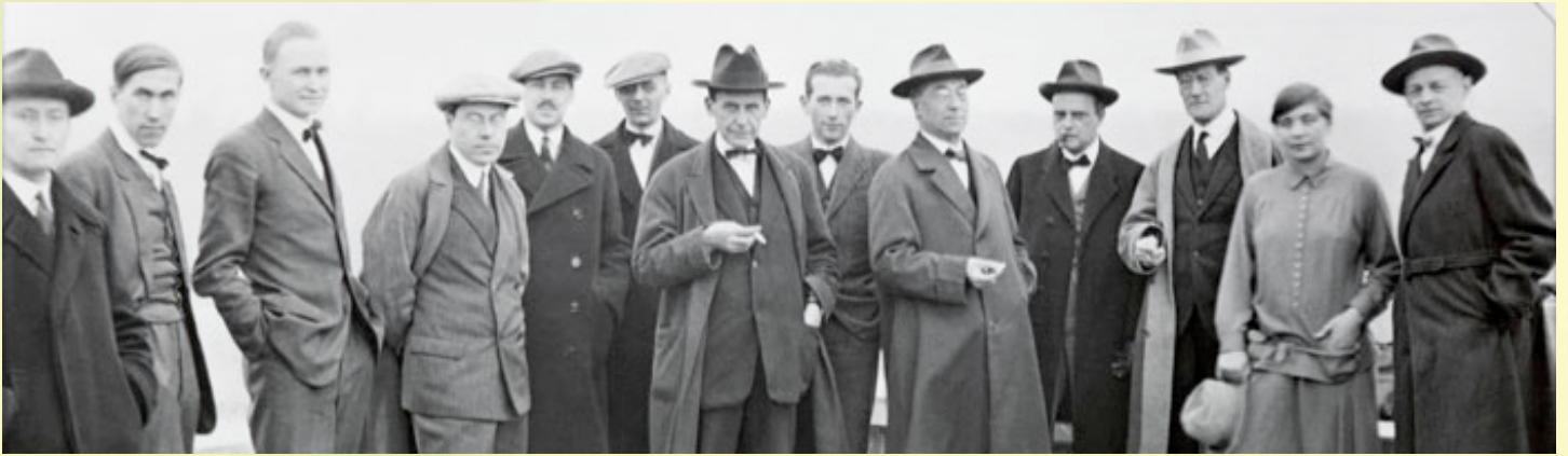
3. ábra: A dessaui Bauhaus-épület tetején, balról: Josef Albers, Hinnerk Scheper, Georg Muche, Moholy-Nagy László, Herbert Bayer, Joost Schmidt, Walter Gropius, Breuer Marcel, Vaszilij Kandinszkij, Paul Klee, Lyonel Feininger, Gunta Stölzl és Oskar Schlemmer.