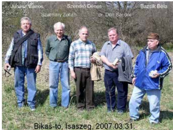
A fotó 2007-ben az isaszegi Bikas-tónál lévő őstelepülés leletkutatásánál készült

Kezdetben saját pénzen fejlesztett, majd drága áron vásárolt profi fémkeresőket használt az Isaszegen és környékén előforduló mágnesezhető anyagok – így a fémből készült