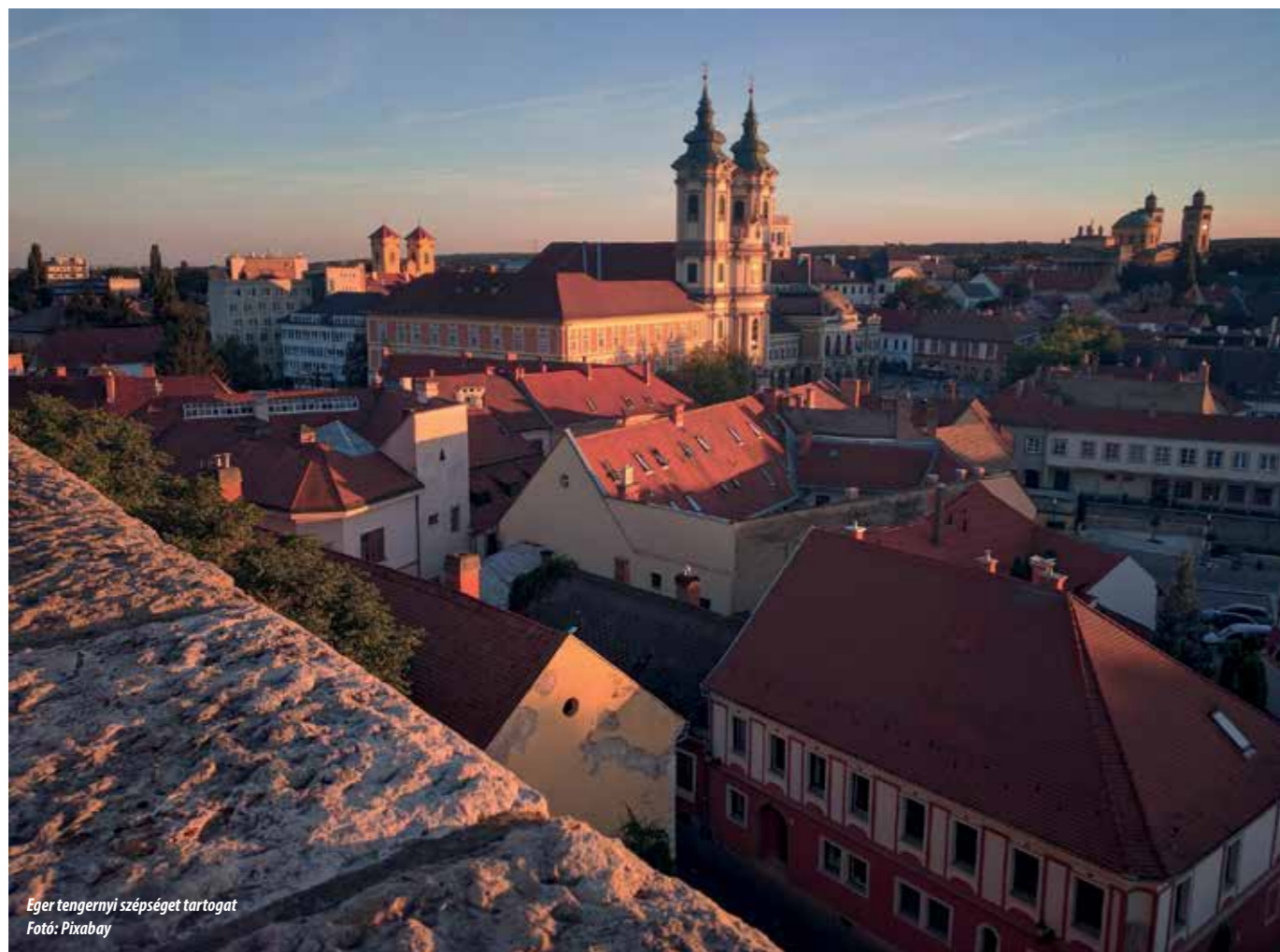
Eger tengernyi szépséget tartogat