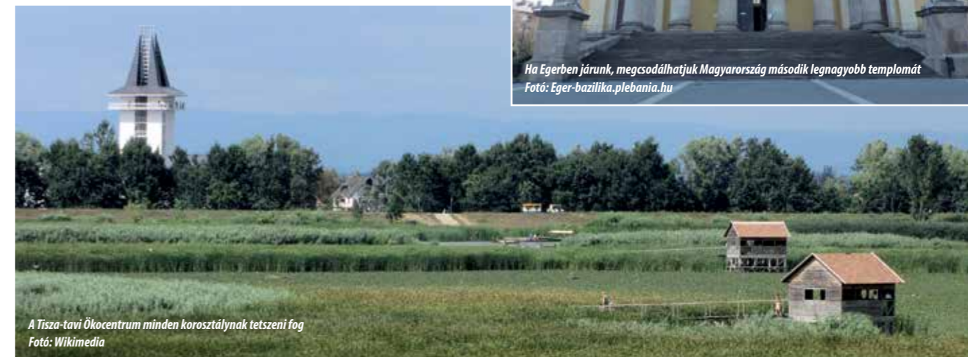
A Tisza-tavi Ökocentrum minden korosztálynak tetszeni fog

Harmadik nap. Körülbelül ötven perccel kell autóznunk, hogy meglátogathassuk a Tisza-tó fénypontjának is nevezett, Poroszlón található Tisza-tavi Ökocentrumot. Ez a hazánkban