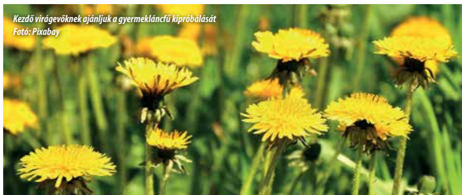
Kezdő virágévőknek ajánljuk a gyermekláncfű kipróbálását

Levendula. Aki járt már Tihanyban, biztosan belefutott a levendulába étermekben. Édes, fűszeres ízű, egyaránt illik a sós és az édes ételekhez. Passzol