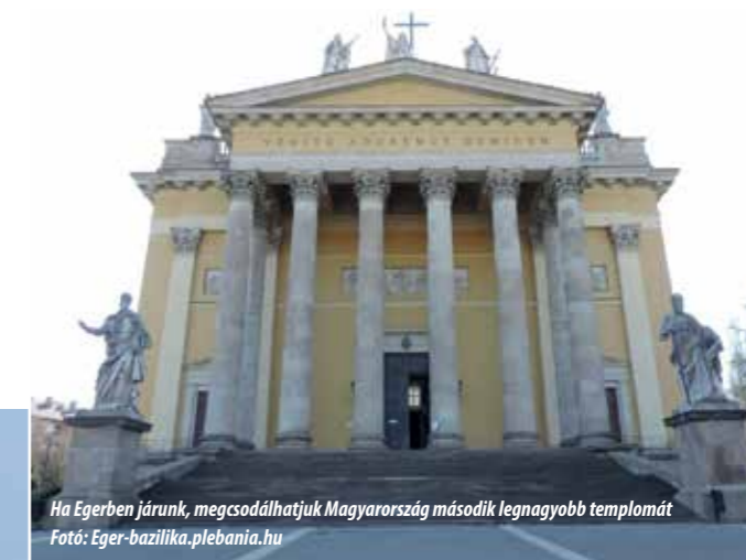
Ha Egerben járunk, megcsodálhatjuk Magyarország második legnagyobb templomát