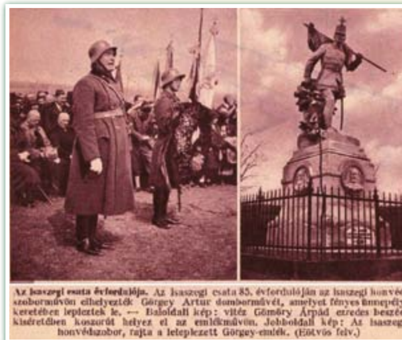
Az isaszegi csata évfordulója. Az isaszegi csata 85. évfordulóján az isaszegi honvéd szoborművön elhelyezték Görgey Artúr domborművét, amelyet fényes ünnepély keretében lepleztek le. — Baloldali kép: vitéz Gömörly Árpád ezredes beszéd kíséretében koszorút helyez el az emlékművön. Jobboldali kép: Az isaszegi honvédszobor, rajta a leplezett Görgey-emlék.

1934. április 8-án, vasárnap Isaszegen az 1901-ben felavatott Honvédszobor talapzatának homlokzatára az országban elsőként került fel Görgey Artúr fővezér kőből készült domborművű mellképe.