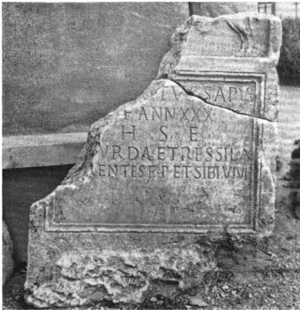
10814. Római sírkő töredéke barbár nevekkél (Sapurda, Ressila) Szabadbattyánból.