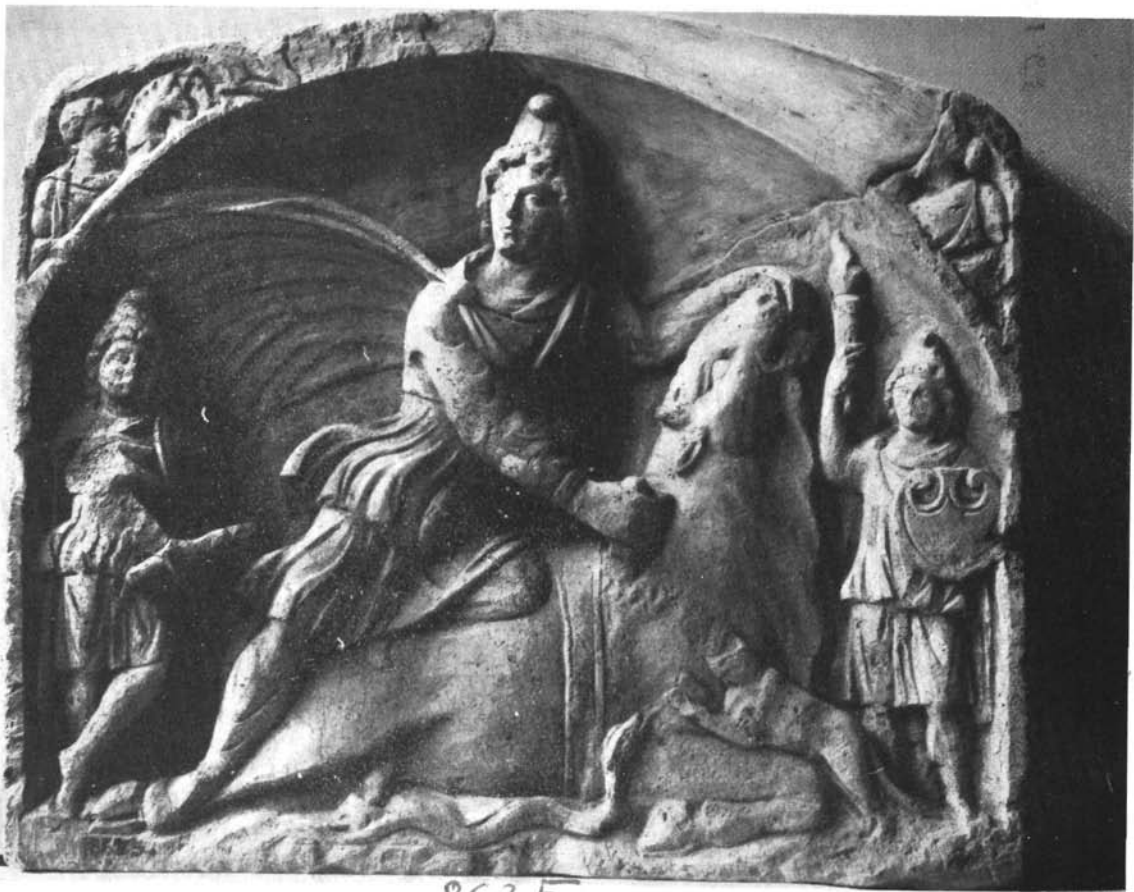
8635 Mithras napistent ábrázoló dombormű Sárkesziből.