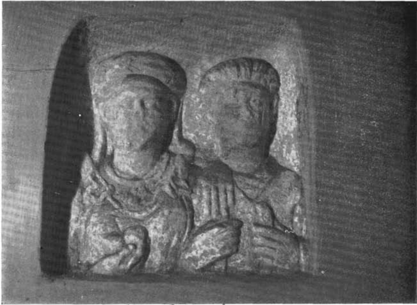
50. 92. 1. Római domborműves kő kelta ruházatú alakokkal. Tác-Fövenypusztáról. (Jelenleg a nagylángi urad. felügy. lakás falában.)