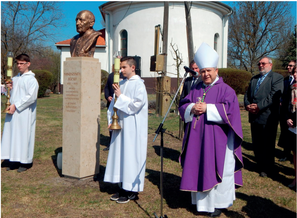
Mindszenty József mellszobra Pálosszentkúton, az előtérben Dr. Bábel Balázs kalocsai-kecskeméti érsek