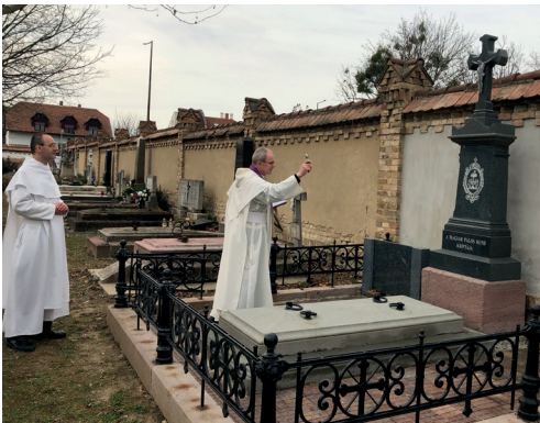
Az új pálos kriptá

2019. március 7-én áldotta meg Botfai Levente pécsi házfőnök atya az új pálos kriptát a pécsi