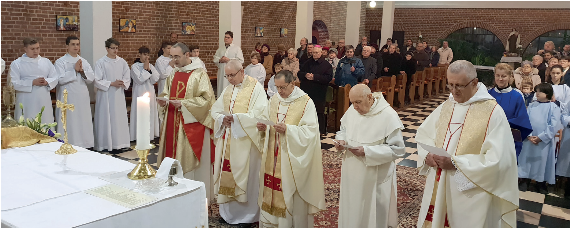
A szerzetesek megújítják fogadalmukat – Pécs

ber 4. és 6. között rendezzük meg a Pálos70-et, hogy ebben az évben is közelebb kerüljünk Istenhez, egymáshoz és igazi önmagunkhoz. Bővebb információ, beszámolók és fotók a Pálos70-ről, valamint jelentkezési lehetőség a palos70.hu weboldalon található.