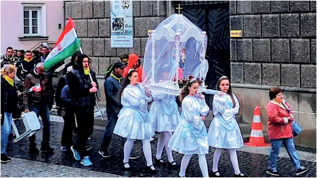
Czestochowa, Jasna Góra, 2019. április 14. – motoros zarándoklat. A szobrot eszédi máriás lányok viszik.

ugyanennyi nadrágot húztam magamra – és még így is volt, mit „felajánlani”... De nemcsak az időjárás viszontagságai jelentettek nehézséget. Megérkezésünk után volt lehetőségünk egymást „elviselni szeretetben”... Nemcsak motoros út ez, a szeretet útja is, ahol elesünk, felkelünk, próbálkozunk, és elsősorban bíz(z)unk Istenben és egymásban.