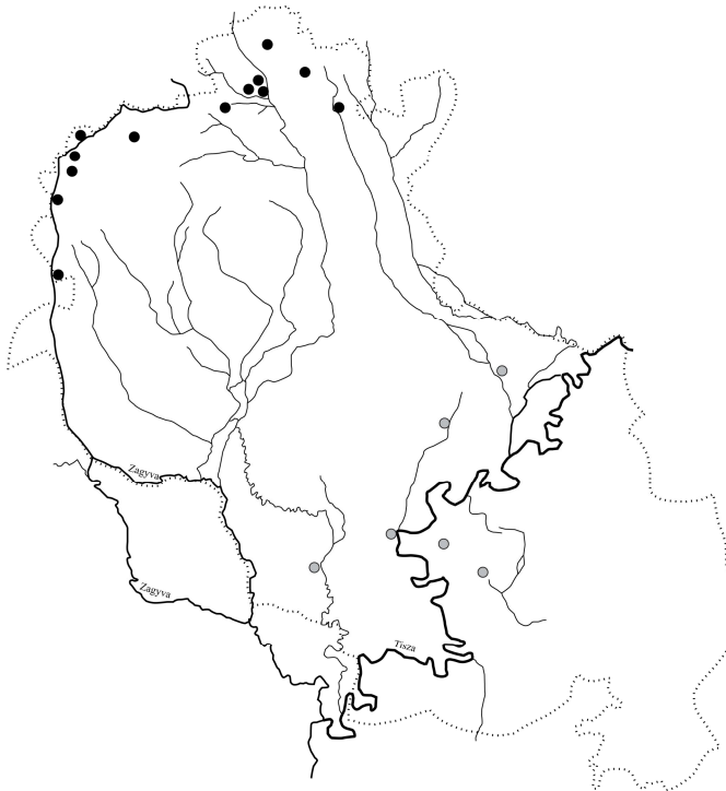
4. ábra. Az ér és a patak szóföldrajza Heves vármegyében

4. Kézenfekvő ugyanakkor, hogy a földrajzi köznevek jelentése a területi elterjedésre olyan módon is hatással van, hogy a szóföldrajzi megoszlás egyben jelentésbeli megoszlást is jelent, ami a földrajzi környezet eltérő jellegéből is fakadhat. A patak és az ér területi elkülönülését közelebbről szemügyre véve például azt látjuk, hogy a Közép-Tisza vidékén a Tisza északi oldalán jórészt csak patak , déli-délkeleti oldalán pedig szinte kizárólag ér adatok jelentkeznek (lásd ehhez az 1. ábrát). Egy szűkebb területre koncentrálva ez az elkülönülés még szembetűnőbb. Heves vármegyében például a két földrajzi köznévi egyaránt adathozható, de a vármegye északi részén kizárólag patak , déli-délkeleti részén pedig csak ér adatokat regisztrálhatunk (lásd a 4. ábrát).