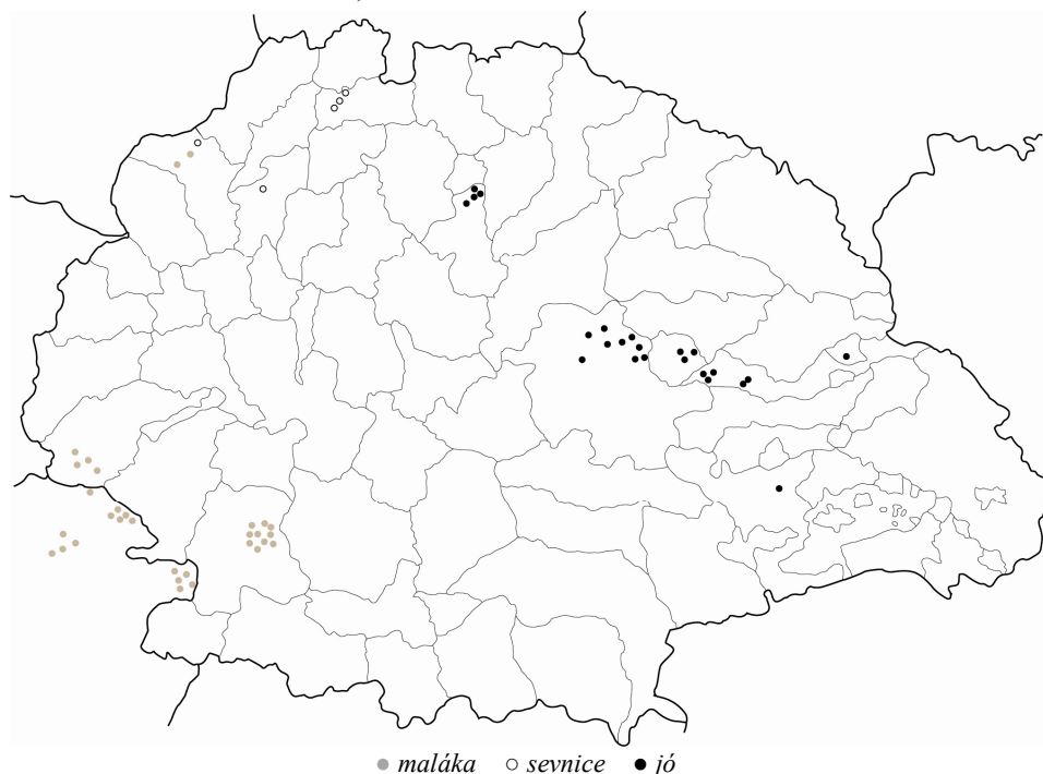
2. ábra. A sevnice , a maláka és a jó szóföldrajza a korai ómagyar korban

A jó földrajzi köznévfő többek feltételezése és a térképi adatok tanúsága szerint szintén nyelvjárási elemként csak az északkeleti és a keleti nyelvjárásokban volt használatos (lásd a 2. ábrát) (vö. HUNFALVY 1867: 6: 356, BENKŐ 1965: 75, KÁLMÁN 1967: 345–347, TÓTH V. 1997: 263, HOFFMANN 2003: 669, GYÖRFFY 2011: 97–99, 100–101).