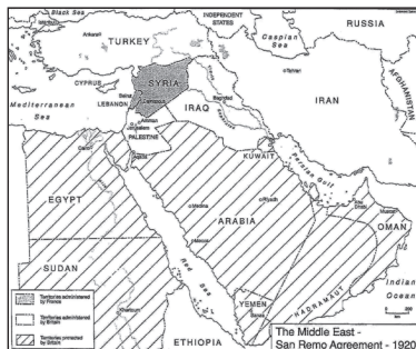
A Közel-Kelet brit-francia felosztása az I. világháború után https://israeled.org/wp-content/uploads/2013/05/1920-San-Remo-Agreement.pdf