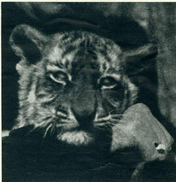
A-vitaminhiányos táplálkozás folytán elhomályosodott szaruhártya.

megszokja, melynek következménye azután a ferde csillagvizsgáló fejtartás. Ellentmond ennek a naiv nézetnek az a körülmény is, hogy a szerencsétlen beteg kölyök mindig egy és ugyanarra az oldalra fordult tartja a fejét! Úgy az egyoldalra fordult