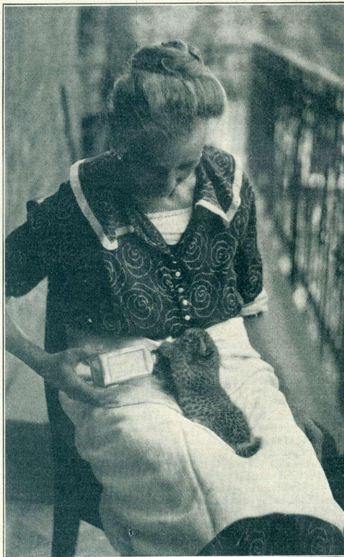
Cerva Friggésné leopárdkölyket szoptat.

Ilyen féltő gonddal figyelték Ara vizilóanyát is és amikor az medencéjében egyoldalára elfeküdt, megtörtént az öröndetes esemény: a kis vizilócsemete szopott! — Az anyaállat étrendje oly takarmányból áll, mely mésztartalomban és vitaminban gazdag, sőt a csontképzéshez szükséges mészsókat is kapja, hogy a kis csemete egészséges fejlődése biztosítva legyen. Mint már említettem, minden rendben van akkor, ha az anyaállat a csemetenivelést maga vállalja. Ez azonban a legtöbb esetben sajnos, nem tapasztalható. Az anyaállat természetellenes életénél fogva az esetek túlnyomó részében és különösen a ragadozó macskaféléknél az újszülötteit fokozottabb mértékben félti. Ezért a nevezett állatokat a közönségtől nem látogatható csendes, el-