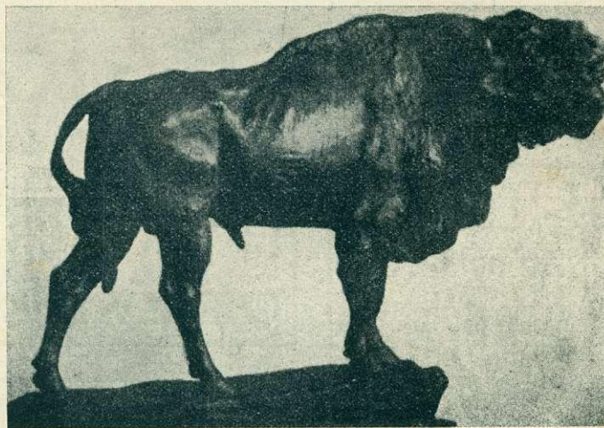
Európai bölénybika. — Maugsch szoborműve.

Őt európai bölény él a megszállott Magyarországnak állatkertjében és a tudományos világ szeme felénk fordul, hogy segédkezet nyújtsunk a bölények kivészésének meggátolására. Az állatkert, amint a múltban, úgy a jövőben is kötelességét végre fogja hajtani. A legnagyobb áldozat mellett a bölény