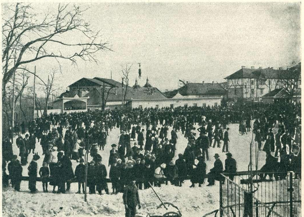
AZ ÁLLATKERTI JÉGPÁLYA.

— A viszontlátásra! Holnap, az állatkertben!