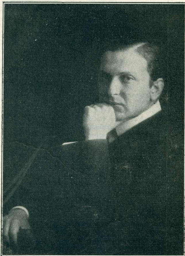
REINER FRIGYES, szász kir. udv. karmester.

Reméljük, hogy ez az eset nem fog bekövetkezni! Bármily jelentős, bármily előnyös Reiner Frigyes művészi pályafutásában drezdai alkalmaztatása és bármennyire örülünk is mi az ő külföldi nagy sikerének: mégis remél-