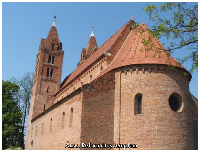
Ákos, Református templom