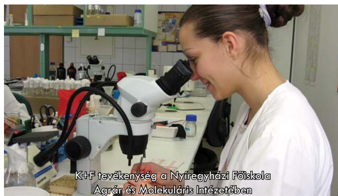
K+F+I tevékenység a Nyíregyházi Főiskola Agrár és Molekuláris Intézetében

A projekt keretében elkészült egy 4 nyelvű, színes, A/4-es méretű kiadvány is, amely széles körben került terjesztésre. A kiadvány magyar, orosz, német és angol nyelven mutatja be Szabolcs-Szatmár-Bereg megye K+F+I befektetési környezetét.