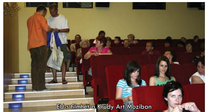
EU-s filmhét a Krúdy Art Moziban

A pályázati téma azonban meglehetősen komplikáltnak bizonyult, mivel összességében kevesebb versenyművet postáztak a diákok, mint ahogyan azt munkatársaink előzetesen várták. Ebből a megfontolásból kiindulva a pályaművek értékelésénél a diákok között nem állítottunk fel helyezési sorrendet, hanem mindenkit egyenlően jutalmaztunk.