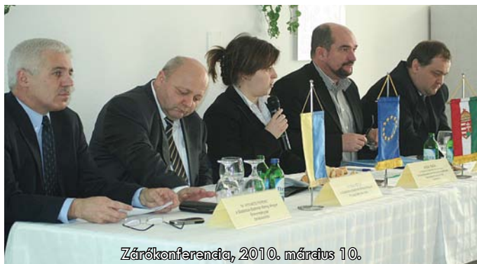
Zárókonferencia, 2010. március 10.

A Megyei Területfejlesztési és Környezetgazdálkodási Ügynökség „Befektetés-ösztönzés a magyar-ukrán határövezetben” című projektje az EGT & Norvég Finanszírozási Mechanizmus társfinanszírozásával 2009 márciusában kezdődött el. Az Ügynökség partnere a Kárpátaljai Megyei Tanács , akinek legfontosabb feladata a potenciális befektetési területek felmérése és koordinálása volt ukrán oldalon.