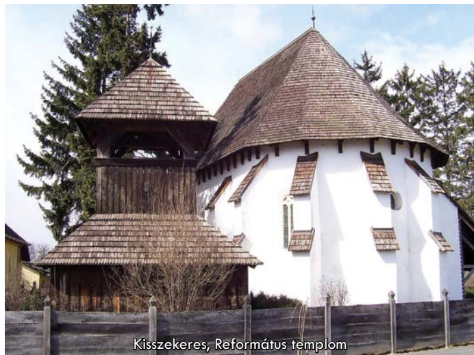
Kísszekeres, Református templom