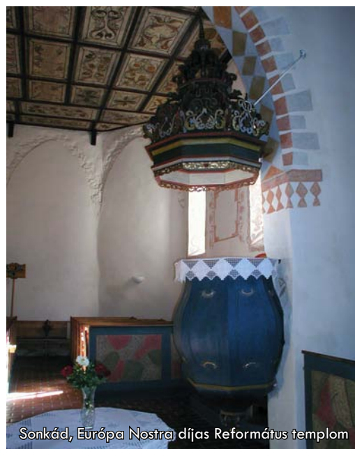
Sonkád, Európa Nostra díjas Református templom