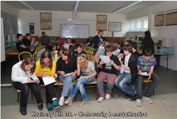
Kazinczy Ált. Isk. - Csehország bemutatkozása

Április havi legérdekesebb programunk egy alapfokú oktatási intézményhez kapcsolódik: április 20-án rendezte meg a nyíregyházi Kazinczy Ferenc Általános Iskola a „Csehország bemutatkozik” című programját, amelynek megszervezéséhez irodánk is segítséget nyújtott.