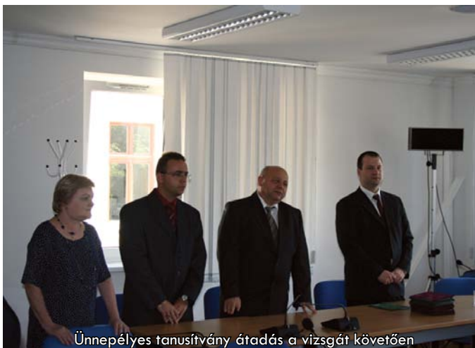
Ünnepélyes tanúsítvány átadás a vizsgát követően

A harmadik és egyben utolsó képzési kurzus 2010. október-november között fog lezajlani, amelyre már most lehet jelentkezni.