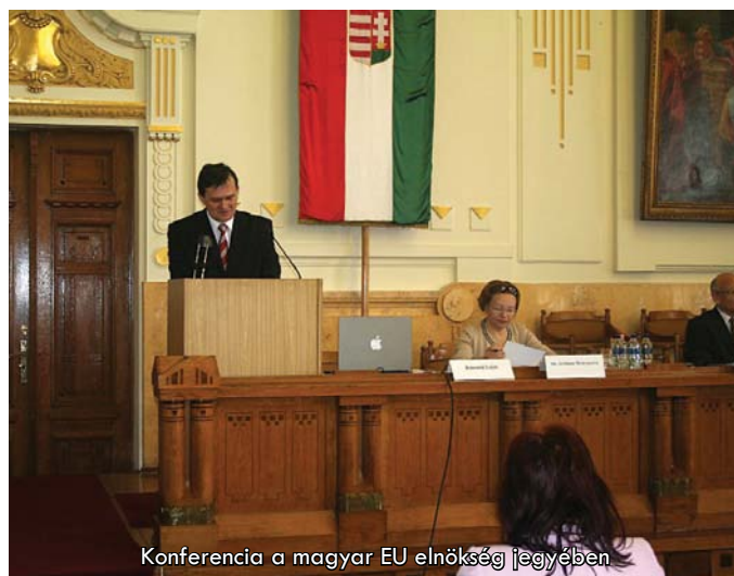
Konferencia a magyar EU elnökség jegyében

És végül, de nem utolsó sorban március 18-án a Megyeháza dísztermében reprezentáltuk hálózatunkat, mégpedig az EuroClip-EuroKapocs Közalapítvány szervezésében megrendezésre került, s szakmailag igen fontos, „ A magyar EU-elnökség 2011: kihívások és lehetőségek ” című konferencián. Ezen a napon nemcsak kiállítóként jelentünk meg a Bessenyei-teremben, hanem felkérésre a konferencia kép- és hangtechnikai lebonyolításában is jelentős részt vállaltunk.