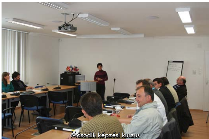
Második képzési kurzus

A fenti célok elérése szaktanácsadási, képzési és PR tevékenységekkel történik.