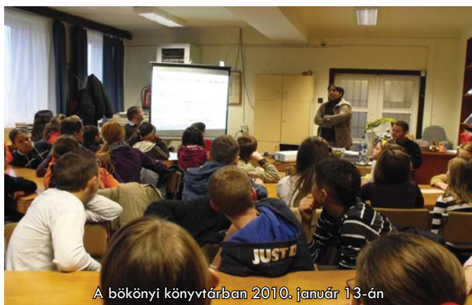
A bökönyi könyvtárban 2010. január 13-án

A Szabolcs-Szatmár-Bereg Megyei Területfejlesztési és Környezetgazdálkodási Ügynökség keretében működő Europe Direct Információs Központ a 2010-es év első felében is – csakúgy, mint korábban – megragadott minden lehetséges alkalmat, hogy teljesítse küldetését. Az Európai Unióval kapcsolatos tájékoztató tevékenység megszervezéséhez a megyében működő partnerszervezetekkel, oktatási és kulturális intézményekkel való együttműködés, valamint a megye különböző pontjain szervezett és tervbe vett rendezvényeken való megjelenés biztosít megfelelő alapot. Az alábbiakban az idei év legérdekesebb eseményeiről olvashatnak röviden.