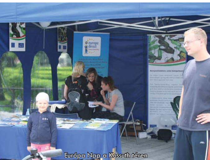
Európa Nap a Kossuth téren

Még ma, 6 évvel az uniós csatlakozásunkat követően sem tudják sokan, hogy május 9-én ünnepeljük kontinens szerte az Európa Napot , amely az Európai Unió politikai-gazdasági egységét hivatott reprezentálni. Éppen ezért irodánk Nyíregyházán a Kossuth téren egy információs sátrat felállítva szólította meg a járókelőket és beszélgetett el velük a közösséghez kapcsolódó témákról. Brüsszelből kapott tájékoztató füzetekből válogathattak az arra járók, valamint EU-s tudáspróbakkal, játékokkal próbálkozhattak a vállalkozó szelleműek.