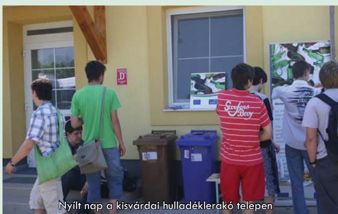
Nyílt nap a kisvárdai hulladéklerakó telepen

A fenti beruházások és beszerzések eredményeként – az eredeti költségkereten belül – a Társulás, ill. az annak tulajdonában álló Észak-Alföldi Környezetgazdálkodási Kft. teljesíteni tudja azon célkitűzését, hogy a tagönkormányzatok számára biztosítsa a teljes körű hulladék-közszolgáltatás ellátását.