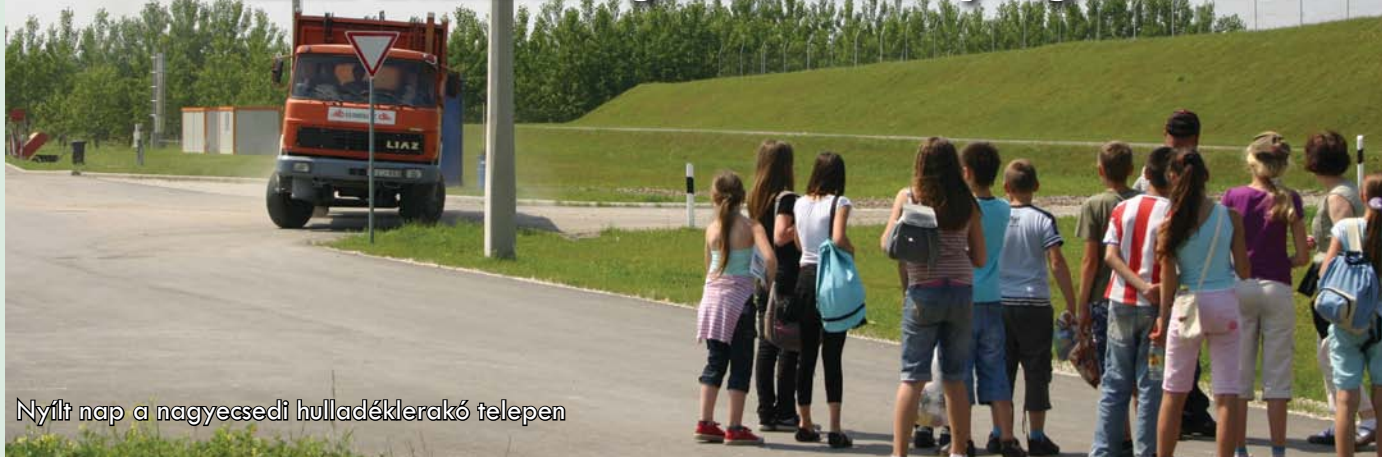
Nyílt nap a nagyecseddi hulladéklerakó telepen

A projekt keretében megvalósult kisvárdai és a nagyecseddi telepeken január elseje óta zökkenőmentes a hulladékok fogadása és lerakása. A két telephely üzemeltetését az Észak-Alföldi Környezetgazdálkodási Kft. végzi. A kisvárdai és a nagyecseddi lerakókhoz tervezett bekötőutak megépítéséhez szükséges területek megszerzése is a végéhez közeledik: Nagyecsedden ez a folyamat már lezárult, így ott a kivitelező már építi az elkerülő utat, mely várhatóan az idén ősszel átadásra kerül.