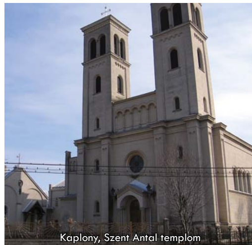
Kaplony, Szent Antal templom

Ez utóbbi tevékenységet egyrészt egy színvonalas weblap, másrészt kiadvány, valamint egy turisztikai film összeállítása tartalmazza. A promóciós eszközök ízelítőt adnak e páratlan kulturális örökségről és reményeink szerint felkeltik az érdeklődők figyelmét a térség iránt. A templomút állomásaihoz egységes szerkezetű tájékoztató táblák kerülnek kihelyezésre, amelyek biztosítják a látogatók számára, hogy nyomon kövessék és megismerjék azt a középkori örökséget, amelyet az egyházközségek hagytak az utókorra.