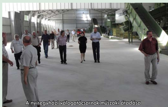
A nyíregyházi válogatócsarnok műszaki átadása