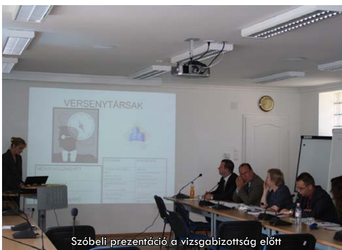
Szóbeli prezentáció a vizsgabizottság előtt

A Vállalkozz sikeresen! program másik központi eleme vállalkozói kompetenciák oktatása. A program keretében három képzési kurzus megszervezésére kerül sor. A vállalkozói képzésen olyan ismeretanyagot adnak át az előadók, amelyek elengedhetetlenül szükségesek egy vállalkozás sikeres működtetéséhez.