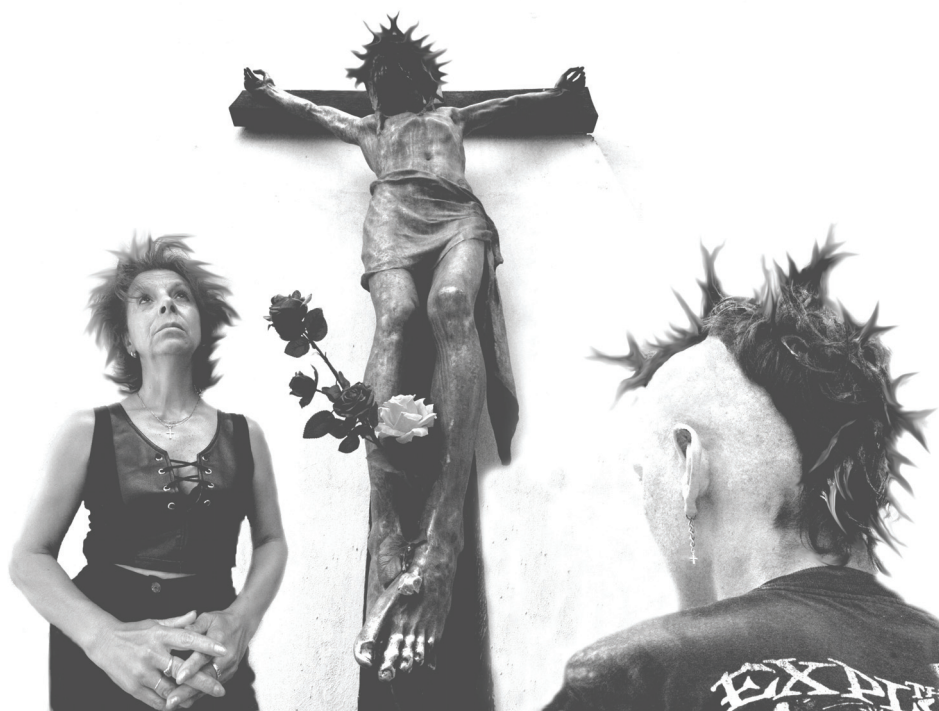
Szita László (APS Stúdió, Budapest): Borzongás Kiállítva: Fotópoézis, Budapest (2006), XVI. Rosti Pál Országos Fotóművészeti Kiállítás, Dunaújváros (2006)

A Magyar Művelődési Intézet és az együttműködő partnerek által felépített tárlatokat kiállítási és közművelődési intézmények számára térítésmentesen kölcsönözzük. Szeretnénk ezzel is segíteni a társintézmények munkáját, ugyanakkor szeretnénk más helyszíneken is népszerűsíteni az autonóm, kortárs fotóművészeti alkotásokat.