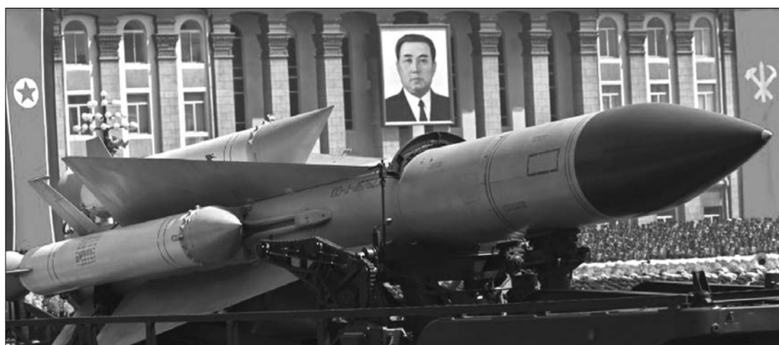
Phenjan fenyegetőzik. Az észak-koreai hadsereg vezetői szerint percekben belül indulhat a pusztító csapás

Az északi hadsereg tegnap közölte: „Ránk jellemző, de általában eddig nem használt, 3-4 percet igénybe vevő különleges eszközökkel és módszerekkel hamuvá változtatjuk az összes patkányszerű csoportot és a provokáció bázisait”, azaz Ri Mjung Bak dél-koreai elnök konzervatív rendszerét és a dél-koreai médiacsoportokat. A közlemény egyebet nem tartalmazott, de a lapkommentárok