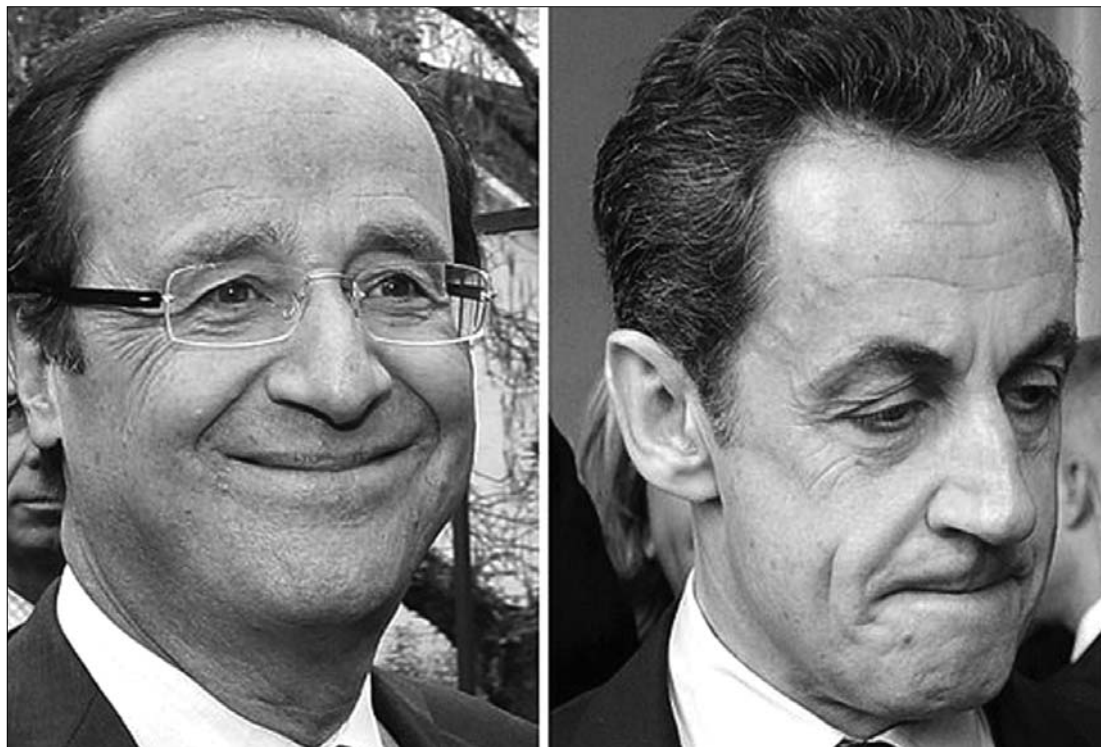
Hollande öröme felhőtlen, Sarkozy lógatja az orrát. Tizenhét év után ismét szocialista lakó költözik az Elysée-palotába?

A vasárnapi előnyserzéssel jelentősen megnőtt az esélye annak, hogy 17 év után ismét baloldali államfője legyen Franciaországnak – az előző a legendás François Mitterrand volt –, miután a második fordulóra az összes felmérés a szocialista jelölt biztos, legalább 54 százalékos győzelmet jelzi előre. ◀