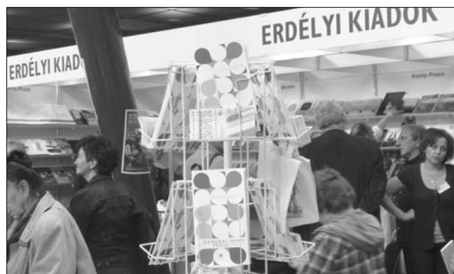
Az erdélyiek standjai a budapesti könyvfesztiválon

Az erdélyi kiadványok közül a legnagyobb érdeklődést Bőjte Csaba legújabb, a Helikon gondozásában megjelent könyve váltotta ki. A ferences testvér közel háromszáz személynek dedikálta könyvét. A Gutenberg kiadónál napvilágot látott Bicsok Zoltán–Orbán Zsolt történelemszerkesztette Isten segédelmével udvaromat megépítettem... Történelmi családok kastélyai Erdélyben című kötet is sikert aratott a vásáron. ◀