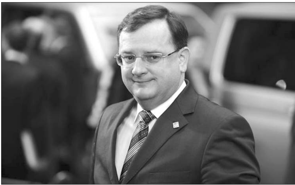
Petr Necas cseh miniszterelnök. Kormánykoalíciója már csak néhány napig marad talpon

Szombaton tízezrek követelték a jobbközép cseh kormány lemondását, és az idő előtti parlamenti választás kiírását Prágában. A Stop a kormánynak elnevezésű or-