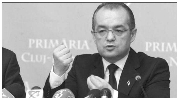
Emil Boc PDL-elnök a bérek teljes mértékű visszaállítását igéri

A 2010-ben levágott bérek visszaállítása szerepel a kormány által elkészített konvergenciaprogramban, amit a kabinet minden évben frissít, és elküld az Európai Bizottságnak. A konvergenciaprogram szerint a bére-