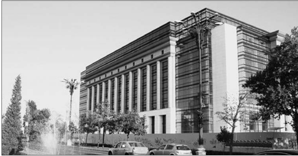
A 400 férőhelyes aulával rendelkező épület terveit a Ceaușescu-rendszer idején készítették.

Kelemen Hunor kulturális és örökségvédelmi miniszter úgy fogalmazott, hogy a könyvnek még hosszú élete lesz, mert az embernek szüksége van a nyomtatott könyvre, az irodalomra. Hozzátette: az államnak nincs joga kivonulni a kultúra finanszírozásából, mert az értékteremtő intézmények nem tudnák önerőből fenntartani magukat. Mihai Răzvan Ungureanu miniszterelnök szerint a könyvtárosok évszázadokon keresztül, viseltek bár „egyházi vagy világi ruhát” hoz-