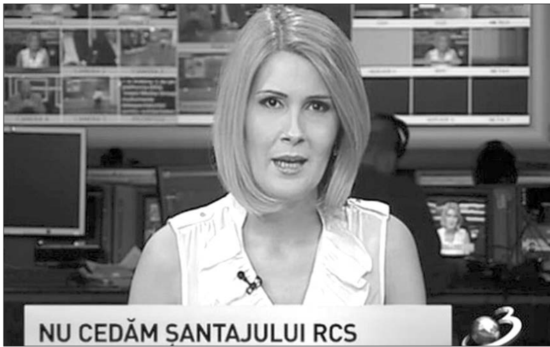
Nem engedünk a zsarolásnak – üzent a nézőknek az Antena3 hírtelevízió

Az sem zárható ki ugyanakkor, hogy politikai háttér is volna az RCS-RDS pénteki lépésének. Az Antena 3 igazgatója szerint – amint az a HotNews.ro-n olvasható – nem véletlen, hogy épp a választási kampány kezdetén próbáltak meg ilyen módszerrel „legálább egy időre csendet teremteni az éterben”. ◀