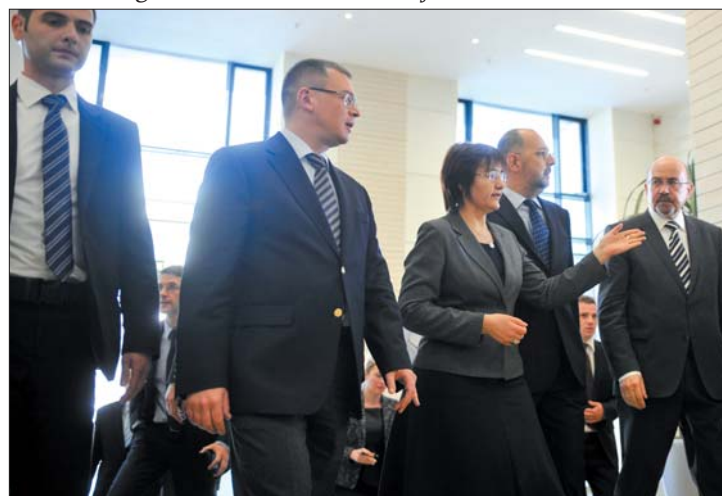
A miniszterelnök Kelemen Hunor és Markó Béla társaságában

nök, Markó Béla miniszterelnök-helyettes és Kelemen Hunor kulturális és örökségvédelmi miniszter jelenlétében. 8. oldal ▶