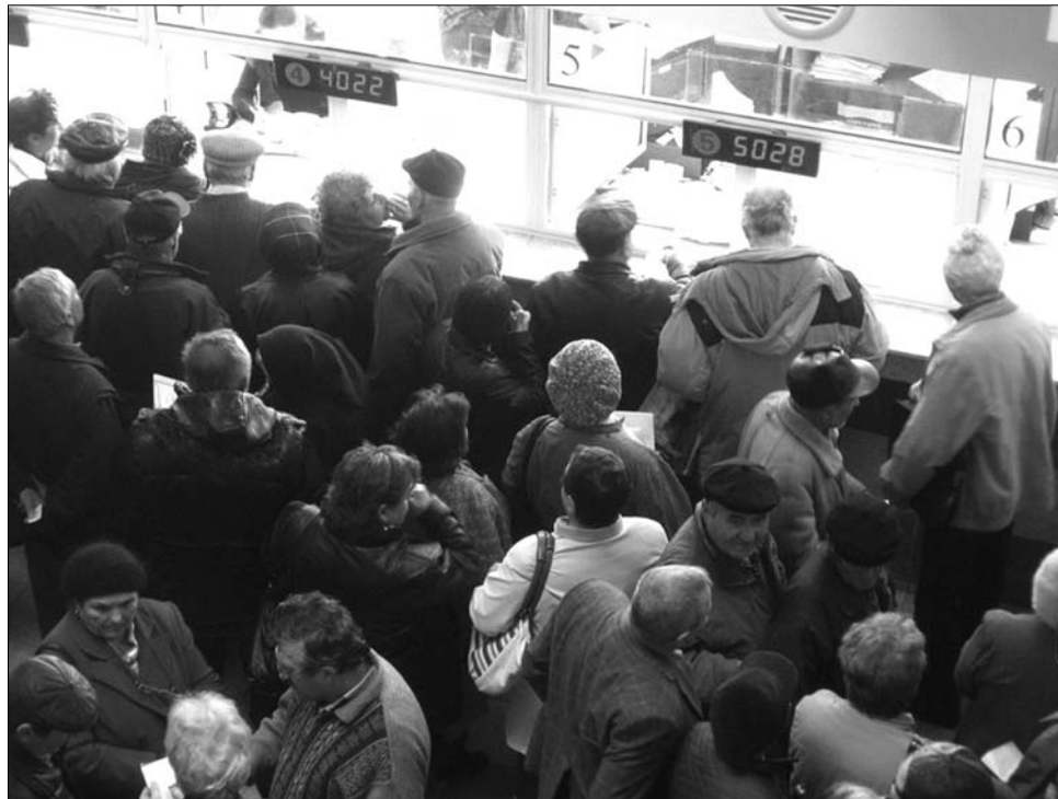
Több hete állnak sorban a nyugdíjasok a bíróságokon, hogy visszaigényeljék a levont járulékokat

A nyugdíjasok rohama látán a Romániai Bírák Szövet-