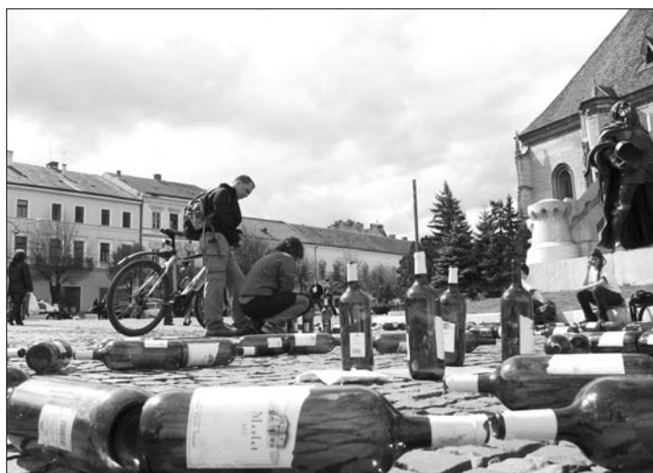
Föld-napi „palackperformance” a kolozsvári Főtéren

pelték tegnap a Föld Napját Erdély-szerte. A résztvevők a környezet megóvására kívánták felhívni a figyelmet. 7. oldal ▶