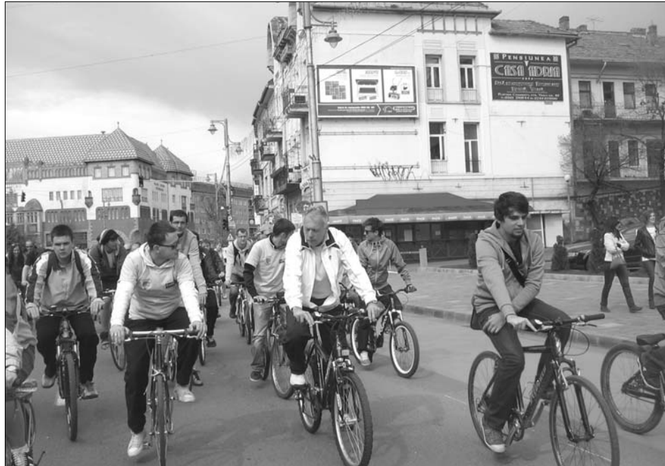
A marosvásárhelyi tegnap délutáni kerékpáros felvonuláson Borbély László képviselő is részt vett