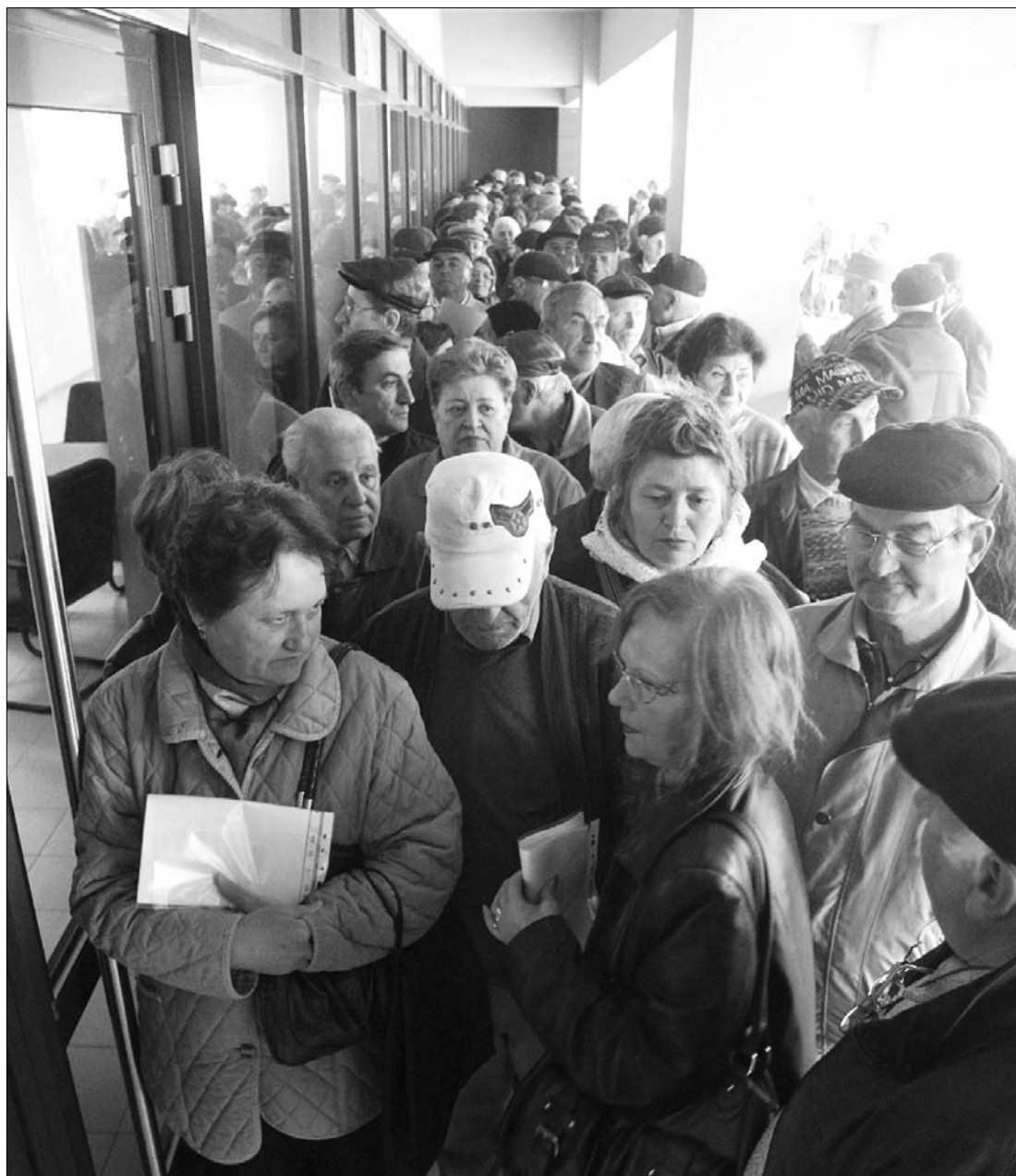
Nem nyugdíjastempó. Az Argeş megyei törvényszéket valósággal megrohamozták a kárvallott idősök.

Megrohamozták a nyugdíjasok a bíróságokat és a nyugdíjosztályokat a járandóságukból csaknem másfél évig jogtalanul visszatartott egészségügyi járulék öszszegének visszaszerzése reményében. A nyugdíjpénztáraknál eddig mintegy százezer személy tett panaszt, a bírósághoz fordulók pontos száma még ismeretlen. A Hargita Megyei Nyugdíjasok Érdekvédelmi Szövetségének elnökétől megtudtuk: várhatóan a teljes tagságuk, mintegy 73 ezer személy készül beperelni az államot, hogy visszamenőleg visszaszerezze elvett jussát. 7. oldal ▶