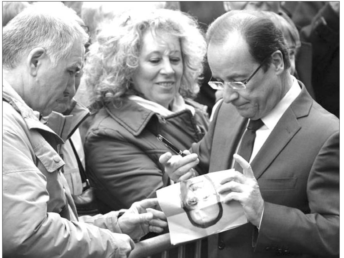
Voksolás előtt. Hollande (jobbra) szórólapját dedikálja egy szavazójának. Megnyugtató előnye van Sarkozy előtt