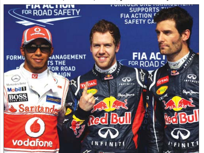
Sebastian Vettel (középen) diadalmaskodott Bahreinben

A kilencedik körben megkezdődtek a kerékcsere, Button, Felipe Massa (brazil, Ferrari) és Rosberg is a boxutcában járt. A viadalt az utolsó harmadban zajló kerékcsere döntötték el. Räikkönen boxlátogatása lassabba sikerült, így a vb-címvédő 3 mp-ces előnyt szerzett, ezzel el is dőlt az első hely sorsa. Mögöttük a finn csapatársa, Grosjean robogott, majd Mark Webber következett. A hétszeres világbajnok német Michael Schumacher (Mercedes), aki váltócsere miatt csak a 22. helyről rajtolt, a 11. volt, majd bravúrral megszerezte a 10., pontszerző helyet is. ◀