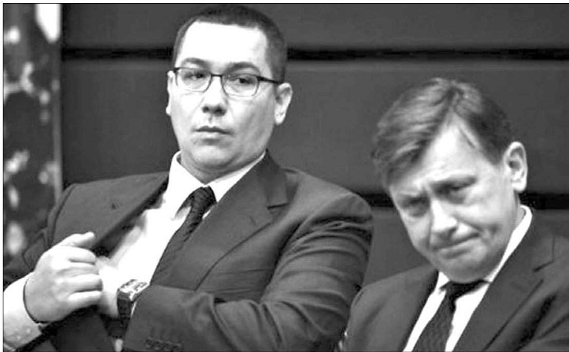
Victor Ponta és Crin Antonescu ismét kormánybuktató bizalmatlansági indítvánnyal próbálkoznak