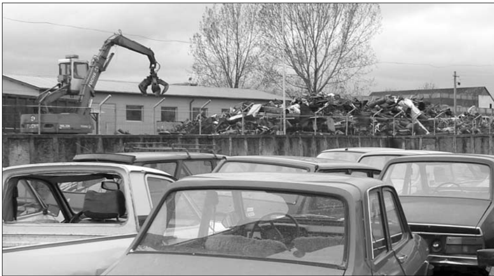
A roncsautóprogramban elérhető értékjegyeket néhány óra alatt elkapkodták