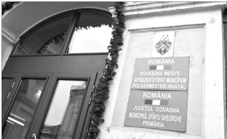
Kétnyelvű felirat Sepsiszentgyörgyön. Székelyföldön nem ütközik akadályokba a nyelvi jogok érvényesítése

A publikációt az RMDSZ és a Nemzeti Kisebbségkutató Intézet közösen adta ki azzal a céllal, hogy összefoglalja mindazokat a jogokat, amelyekkel az erdélyi magyarok élhetnek a különböző