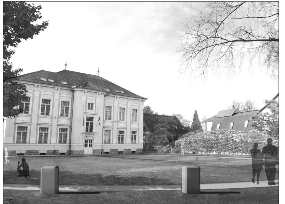
Az emlékpark látványterve. Remények szerint nyáron már „valódi” sétáló népesítik be a létesítményt