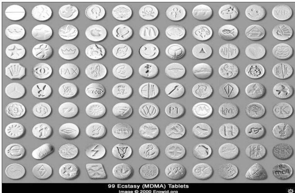
99 Ecstasy (MDMA) Tablets

központi idegrendszerre, lét- rehozhat-e hallucinációkat vagy itélőképességi, magatar- tásbeli, esetleg felfogóképe- ségi zavarokat. Elgondolkod- tató egy fiatal ember történe- te, aki bárhol élhet, és nem- csak az Európai Unión belül. Saját elmondása szerint egy évig rendszeresen, havonta több alkalommal is használta az ecstasy nevű tablettát, nem volt olyan elektronikus parti, ahol ne került volna elő az ő vagy valamelyik társa zsebéből. Az interneten sze- rezte be, egy-két nap alatt meg is érkezett, majd meg- kezdődött a pörgés. Volt ha- tása, órákig tartó eszméletlen ütemet érzett a szívében, többször mondta is a have- roknak, hogy mindjárt szét- robban, annyira érzi a zenét. Az egyik alkalommal há- rom-négy tablettát is bevett, jól időzítve, hogy egész éjjel kitarson az adag. Aztán fá- radtan, lerobbanva indult ha- za, nem is nagyon emléke- zett semmire, csak a másnap volt borzalmas: kiszáradt a szája, amelyet előző este tel- jesen szétrágott, iszonyúan szomjas volt és gyenge, nem beszélve a depresszióról, amely sokszor környékez- te. Napokig ki sem mozdult a la- kásból, egyszerűen bezárko- zott. Valahogy, szakemberek segítségével sikerült a szerről leszoknia. Mostanában nem használ semmit, a bulikban egy-két pohár sörrel is elvan. Arra figyelmeztet, hogy Nyugat-Európában ismét el- terjedőben van az ecstasy. Örök körforgás. ◀