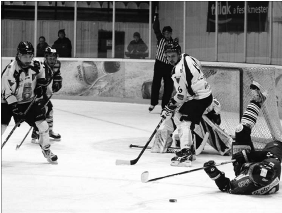
Az U16-os válogatott három játékosát fejenként kétszáz lejre bírságolta a diszkriminációellenes tanács