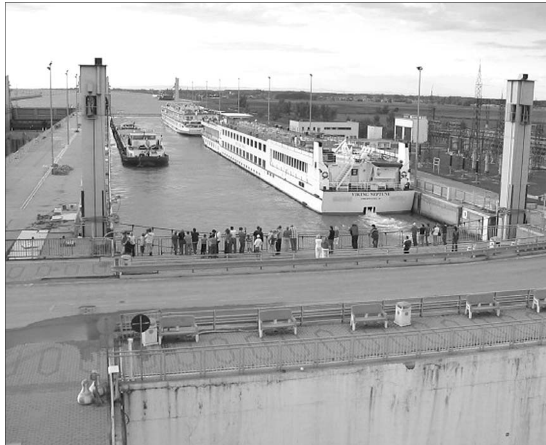
Helyzetkép a Duna elterelése után. A főmeder átkerült Bóshöz: innen indul a nyilegyenes felvízcsatorna

Szlovákia tárgyalna, de csak saját feltételei szerint