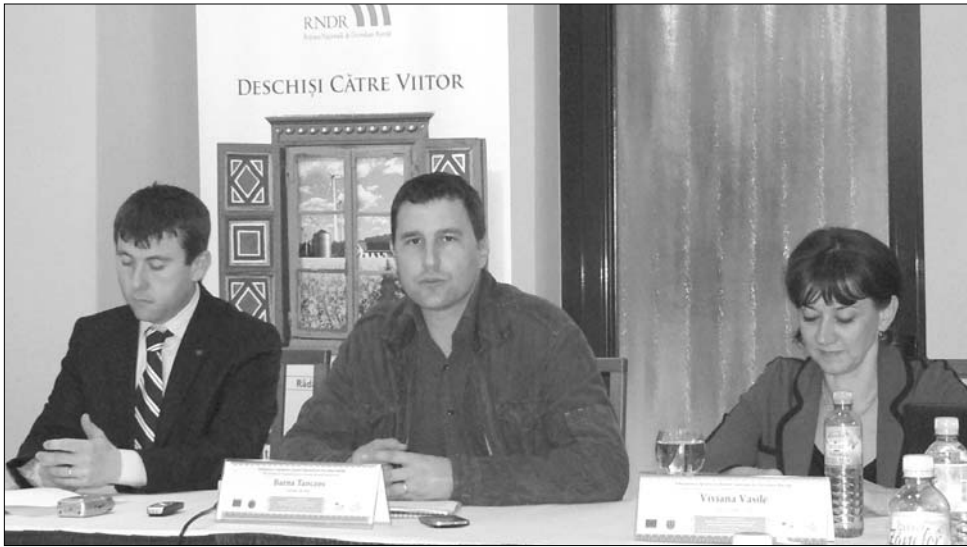
Borboly Csaba és Tánzos Barna szerint a csíki térségben szükség van az agrárberuházások támogatására

A konferencia – amelyet Tánzos Barna vidékfejlesztési államtitkár, a felügyelő tanács elnöke kezdeményezett – előadásai elsősorban a 312-es vidékfejlesztési intézkedés kedvezményezettjeit célozzák meg. Mint ismert, az intézkedés keretében akár 85 százalékos arányban igényelhető finanszírozás műhelyek építésére, berendezések, gépek vásárlására mindazok számára, akik hagyományos termékeket szeretnének előállítani. Az államtitkár ugyanakkor hangsúlyozta: a rendezvényvel fel akarták hívni a figyelmet arra, hogy ez az uniós támogatás nem feltétlenül olyan építkezési gépek vásárlására volt kitalálva, amelyek beszerzésére az utóbbi időben valóságos pályázataradat indult el, hanem inkább olyan termelési tevékenységeket támogatnának, amelyek komoly alternatívát biztosítanak azoknak, akik hagyományos mesterségekből szeretnének megélni.