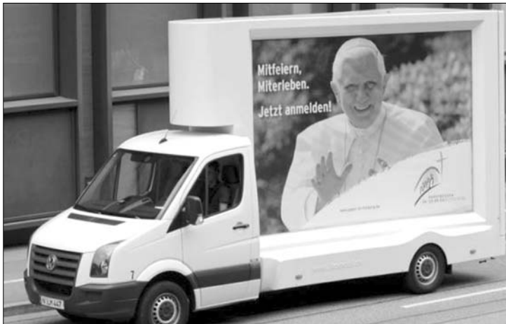
II. János Pál nyomdokain XVI. Benedek. Az utóbbi száz év legidősebb pápája

Hittani Doktrínák Szent Kongregációjának prefektusává nevezte ki a konzervatív nézeteiről ismert Ratzingert, aki 24 éven át vezette