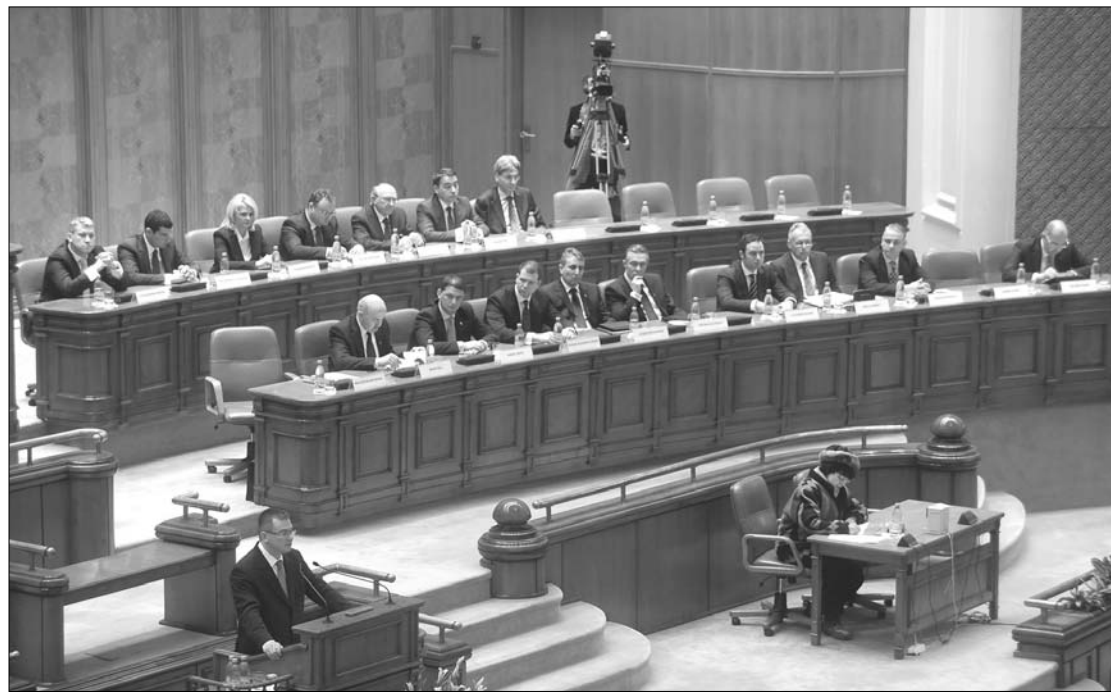
Mihai-Răzvan Ungureanu miniszterelnök kormánya először szembesül az ellenzék bizalmatlansági indítványával.

lelősséget vállal valamely törvénytervezetért. Az indítvány elfogadásához minősített többségre, azaz 231 szavazatra van szüksége az ellenzéknek, a 471 parlamenti mandátumból ugyanis 11 üres. Az USL jelenleg 212 szavazatra számíthat, 66 szenátorra és 146 képviselőre. A kormánypártok az eddigi gyakorlatuknak megfelelően részt vesznek a bizalmatlansági indítvány vitáján, de nem szavaznak róla. Ezt tegnap Sever Voinescu demokrata liberális szóvivő és Kelemen Hunor RMDSZ-elnök is megerősítette. A PDL-s politikus nyíltan kizárással fenyegette meg azokat a kollégáit, akik megszavazzák a kormány megbuktatását célzó kezdeményezést. A sajtó információi szerint az ellenzékiek által készített bizalmatlansági indítványt két kormánypárti honatya is aláírta. ◀