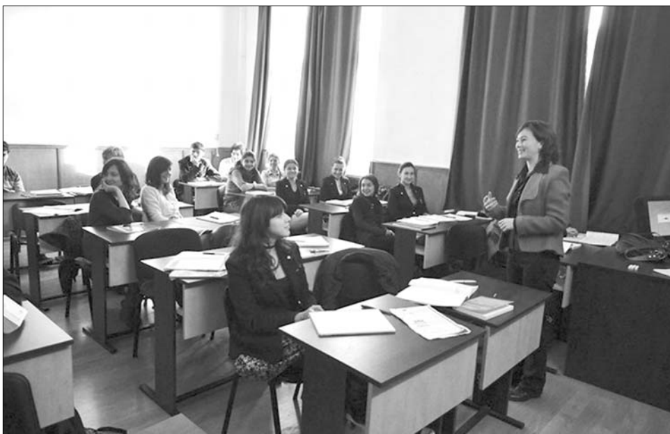
A közoktatásra vonatkozó etikai kódex tervezetéhez május 12-ig lehet javaslatokat benyújtani