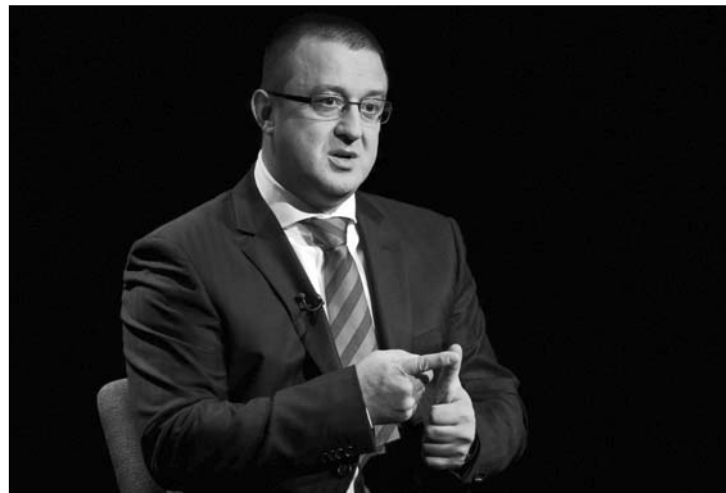
Az országos adóhatóság (ANAF) elnökét felmentették tisztségéből

▶ Felmentette tegnap tisztségéből az országos adóhatóság (ANAF) elnökét, Sorin Blejnart – közölte a kormány szóvivője. Dan Suciú tájékoztatása szerint a hatóság élére Șerban Popot, az ANAF eddigi alelnökét nevezte ki Mihai-Răzvan Ungureanu. 3. oldal ▶