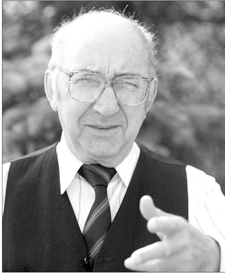
Palásthy György 82 éves korában hunyt el Budapesten

Palásthy György, akinek filmjeiből az életigenlés sugárzik, 1931. január 12-én született Esztergomban. A Balázs Béla-díj és az érdemes művészi cím mellé 2001-ben kapta meg a 32. Magyar Filmszemle életműdíját. ◀