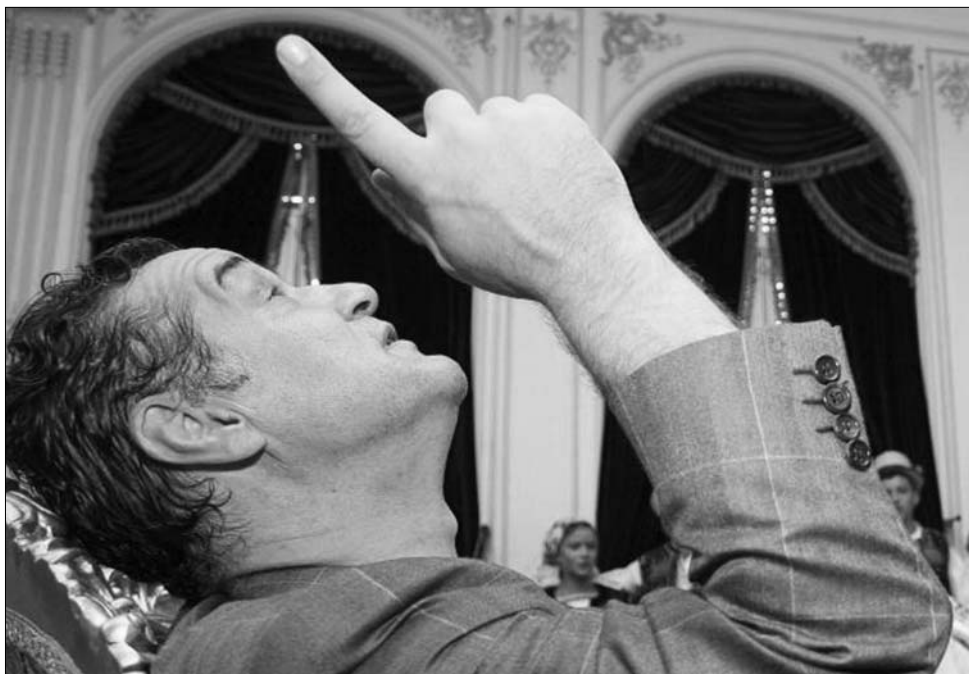
Gigi Becali klubtulajdonos pert nyert a hadsereg ellen és visszakapja pénzes böröndjét is

Kévessel 18 óra előtt, több mint három óra várakozás után, jogerős – de nem végleges – döntés született a híres „böröndgyben” is. Bár az ügyészek négy plusz két év letöltendő börtönbüntetést