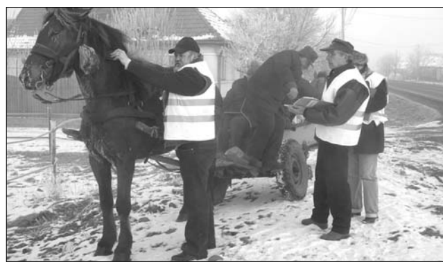
„Menetlel” a mezőre. A papír ugyanolyan fontos, mint a patkó

Suba elmondása szerint, ha valaki éppen csak az udva-