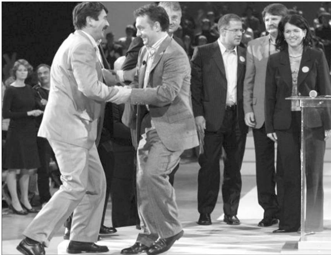
Tánclépésekkel a Sándor-palotába. Áder János magyar államfőjelölt és Orbán Viktor miniszterelnök

Ez a „parkolópálya” meglehetősen furcsa szerepet tölt be az események alakulásában – vélekednek egyes publicisták. A legtöbben abban látják feladatát, hogy a „kétharmados fülkeforradalom” során ne kopjon el a személyisége, s így módon „tisztán” térhessen vissza az országra. A jelöléssel foglalkozott a Berliner Zeitung című baloldali és a Die Welt című konzervatív német,