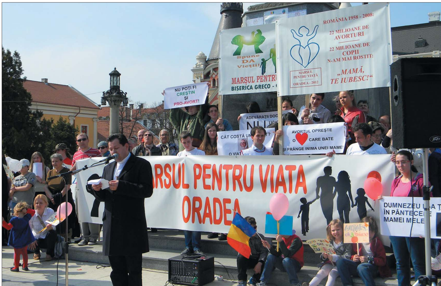
Az egyházak által szervezett Élet menete Nagyváradon. Ellenzői szerint a tervezet egy mélyen vallásos csoport akaratát szeretné megvalósítani

Korlátozná a terhességmegszakítást két demokrata liberális képviselő tervezete