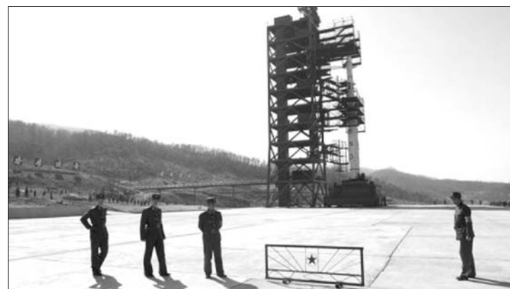
Bármikor indíthatják. Az észak-koreai rakéta később eljuthat az űrbe is

tak a Koreai Köztársaságban tegnap megtartott parlamenti választások befolyásolására. Pedig Phenjan nem riadt vissza a provokatív kijelentésektől. „Amennyiben háború tör ki e földön, Dél-Korea szenved el a legkomolyabb katasztrófát” – áll a déllel való kapcsolattartásért felelős két északi szerv közös közleményében. Mint ismert, az 50-es évek háborúja óta a két állam technikailag ma is hadban áll egymással. ◀