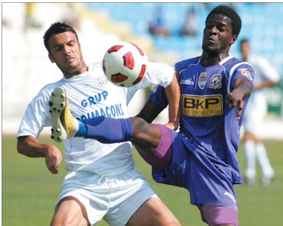
A tervek szerint a másodosztály mezőnye évről évre csökkenni fog: javul a minőség?

Hasonló lebonyolítási rendszere lesz a Liga-3-nak is, csak hat 12-es csoporttal. A rájátszás hat győztese jut fel, s 21 csapat esik ki – utóbbiak helyébe a megyei bajnokok osztályzóinak győztesei lépnek. A Liga-3-ból a 10-12. helyezettek esnek ki (azaz 18 együttes) plusz a három leggyengébb 9. ◀