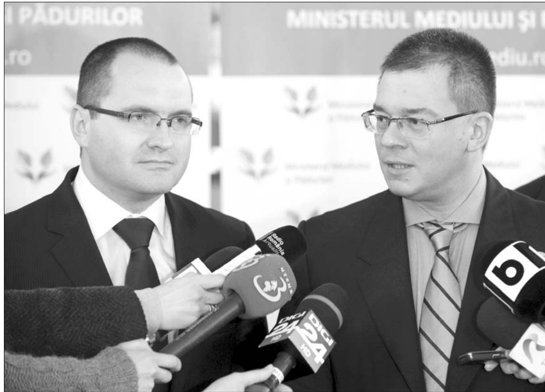
Korodi Attila új környezetvédelmi miniszter és „elődje”, Mihai-Răzvan Ungureanu kormányfő

Verespatakon a kanadai tőkével alapított Roşia Montana Gold Corporation Európa legnagyobb külszíni aranybányáját készülő megnyitni, ahol ciántechnológiás eljárással akár 300 tonna aranyat és 1600 tonna ezüstöt lehetne kitermelni. A bányanyitásra a szakminisztérium eddig nem adott ki környezetvédelmi engedélyt. ◀