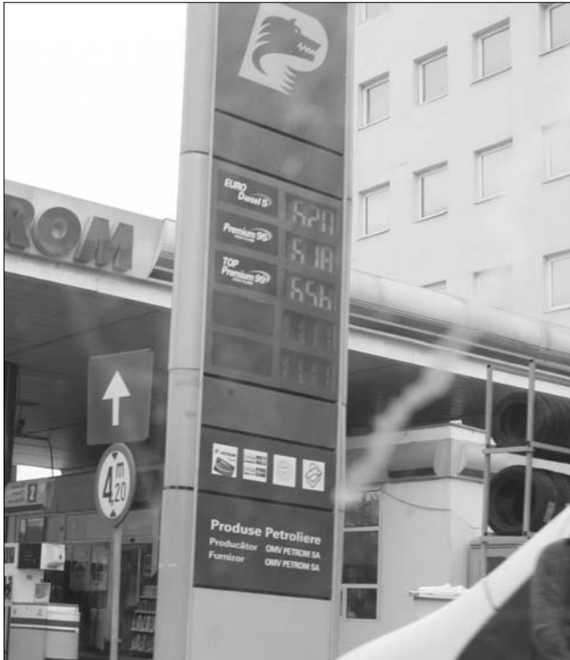
Hamarosan a hatlejes benzinár is „történelem” lehet

Az elmúlt hetekben az amerikai gazdasági mutatók és Irán politikája is „beleszólt” az árak alakulásába, de a geopolitikai történéseken túl a húsvéti ünnep is jelentősen befolyásolta a kőolaj piaci értékét. A fogyasztók Európa-szerte szenvedtek amiatt, hogy a töltőállomásokon – akár csak a téli vagy nyári vakáció idején – az eddiginél