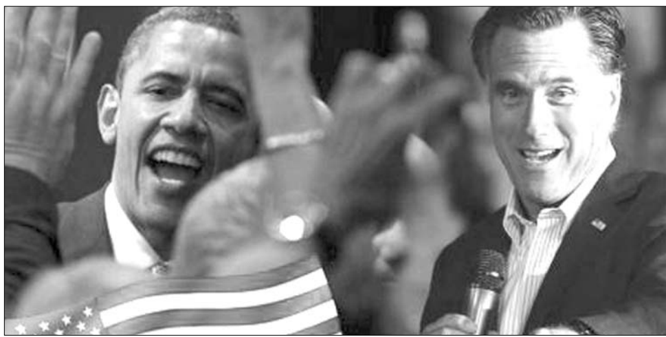
Barack Obama elnök és potenciális kihívója, Mitt Romney (jobbra)

Romney nagy esélye ugyanis abban rejlik, hogy a WP/ABC-felmérés által a megkérdezettek, ha nem is jelentősen, de nagyobb bizalmat szavaztak neki a gazdaság (47:43 százalékos arányban), az energiapolitika (47:42) és a szövetségi költségvetési deficit csökkentésének kérdésében (51:38), mint Obamának. Az amerikaiak a