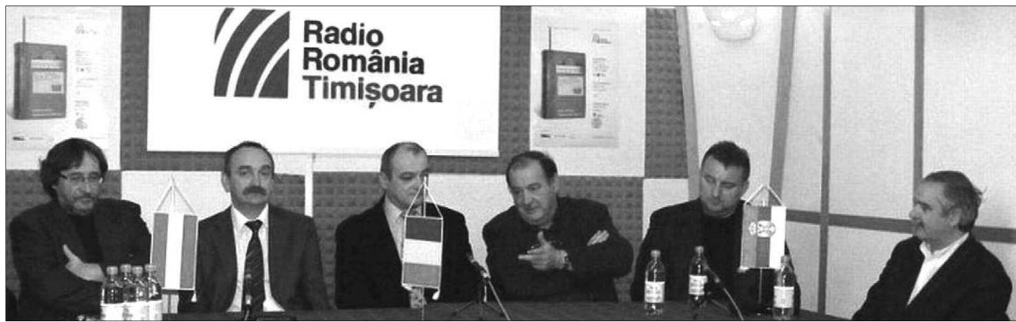
Évfordulós ünnepség a Temesvári Rádió szerkesztőségében: az együttélés értékeinek továbbadását tekintik feladatuknak

Vajdaságban sugárzott 55 perces adás a Duna–Körös–Maros–Tisza Eurorégió eseményeiről, közéleti, gazdasági, kulturális és civil kapcsolatairól, a határon átnyúló együttműködésről szól. További feladatuknak tekintik az emberi sorsok, a helyi értékek, a többnyelvűség, multikulturalitás, az együttélés értékeinek lehető legteljesebb feltérképezését és továbbadását. A magyar nyelvű műsor a temesvári rádióban minden második szombaton 14 órától hallható. ◀