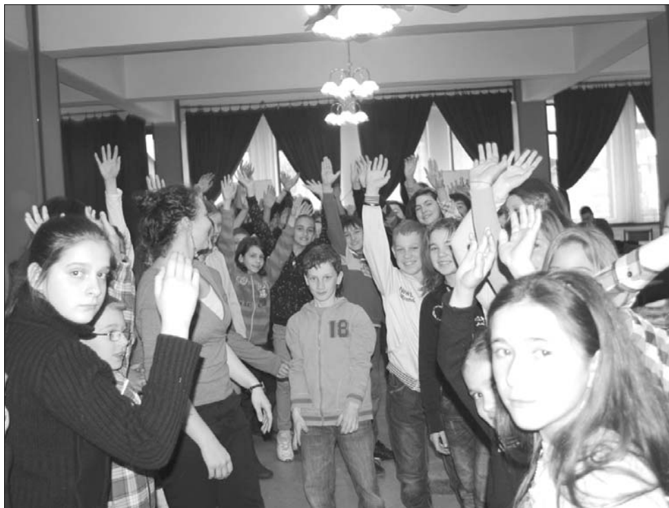
A fiatalok jelképes családokba rendeződve bizonyították rátermettségüket

A nemzetközi gyermekkönyvnapot április 2-án, Hans Christian Andersen dán meseíró születésnapja tiszteletére világszerte megrendezik. ◀