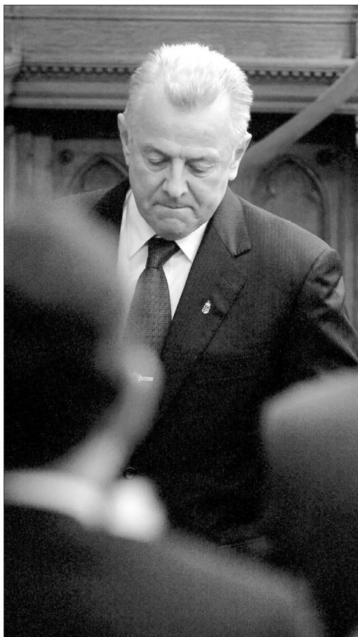
Egy mondat a lemondásról. Schmitt negyedórát magyarázkodott

Előzőleg arról beszélt, hogy a politika világában szinte „semmi sem szent”, támadás okává válhat „betegség, rokonság, ifjúkori tett, szülők bűne”, számtalan olyan dolog, amelynek semmi köze a politikus alkalmasságához, helytállásához. Felidézte, hogy egy internetes portál januárban azzal vádolta meg: húsz évvel ezelőtti kisdoktori dolgozatában meg nem engedett módszert alkalmazva „túl sokat idézett” mások műveiből anélkül, hogy az eredeti szerzőket az előírt módon feltüntette volna. „Még meg sem indult a tényfeltárás, még egy kommunikát sem adhattam ki, az itt ülő képviselők közül néhányan máris megbélyegeztek, csalónak kiáltottak ki, és lemondásomat követelték. Rögtön felröppent a hír, hogy az elnök csal, lop és hazudik. Gondoskodtak arról is, hogy ez a megalapozatlan vád külföldre is kijusson” – mondta.