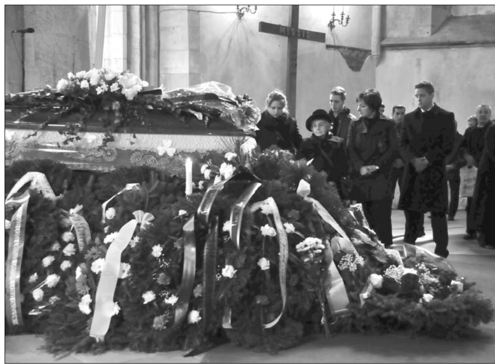
A Szent Mihály templomban felavatalozott koporsónál több százan rótták le kegyeletüket

A szentmise után gyászolók népes tömege kísérte el utolsó útjára a 85 évesen,