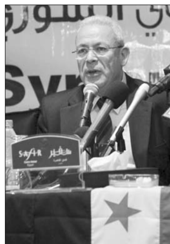
Burhan Galiun. Az ellenzék szervezője

„Népemnek segítségre van szüksége. Ütközőzónát kellene létrehozni a civilek védelmére. Szeretnénk, ha jobban támogatnák a Szabad Szíriai Hadsereget” – mondta Isztambulban a lí-