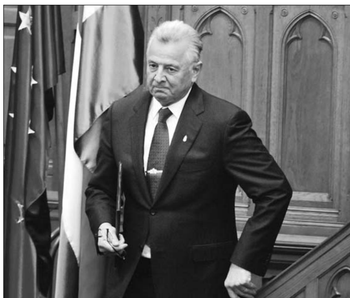
Schmitt Pál dicstelenül távozott a magyar államfői tisztségéből

▶ Elfogadta a Magyar Országgyűlés Schmitt Pál köztársasági elnök lemondását tegnap. Az új államfőt harminc napon belül kell megválasztania a parlamentnek. Schmitt Pál megbízatásának megszűnésével – az új köztársasági elnök hivatalba lépéséig – az államfői feladat- és hatásköröket Kövér László, az Országgyűlés elnöke tölti be, de a választott elnökhöz képest csökkentett hatáskörben. Amíg Kövér László látja el az államfői feladat- és hatásköröket, a parlament döntése alapján a fideszes Lezsák Sándor alelnök tölti be a házelnöki posztot. Az új államfőt harminc napon belül kell megválasztania a parlamentnek. A