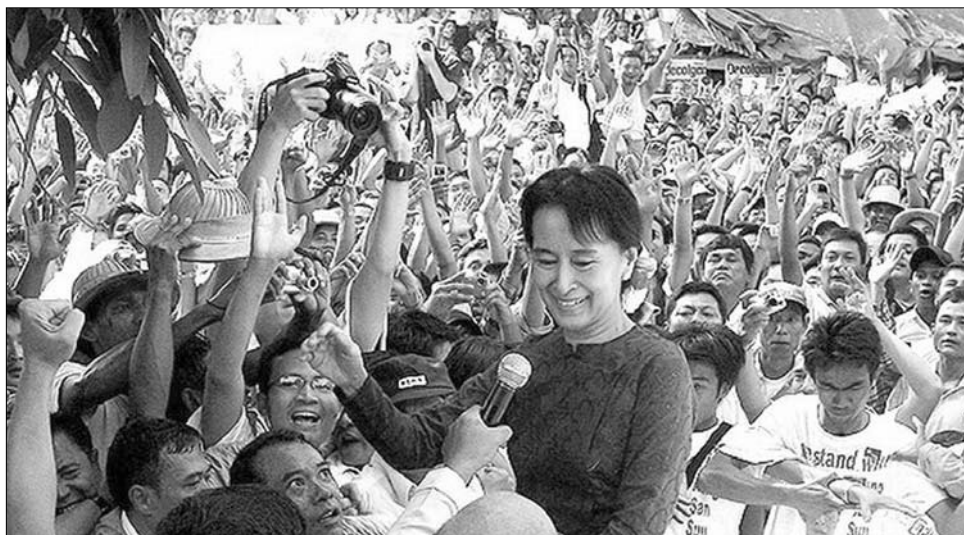
Aung Szan Szú Kji, a mianmari ellenzék házi őrizetből szabaduló vezetője az ünneplők körében

akkor, amikor Szú Kji közleményt adott ki, azt azonban már tudni lehetett, hogy ő maga is képviselő lett, Kavmu körzetben. Végleges eredmény néhány napon belül várható. A siker azonban pusztán szimbolikus jelentőségű, mert az NLD győzelmével együtt is elenyésző kisebbségben marad a két kamarás törvényhozásban és a regionális parlamentekben, ahol az összesen 1160 képviselői hely nagy részét a katonai hatalomátvitel után – a katonai junta a következő évben, 1989-ben nevezte át az országot Burmáról Mianmarra – először 2010 őszén tartottak parlamenti választásokat. A tavaly márciusban megalakult – hivatalosan polgári, de döntően továbbra is a hadsereg tisztjeiből álló – kormány számos fontos reformot léptetett életbe, valamelyest kiterjesztette a politikai szabadságjogokat. A nemzetközi közösség ezért némileg enyhített a délkelet-ázsiai or-