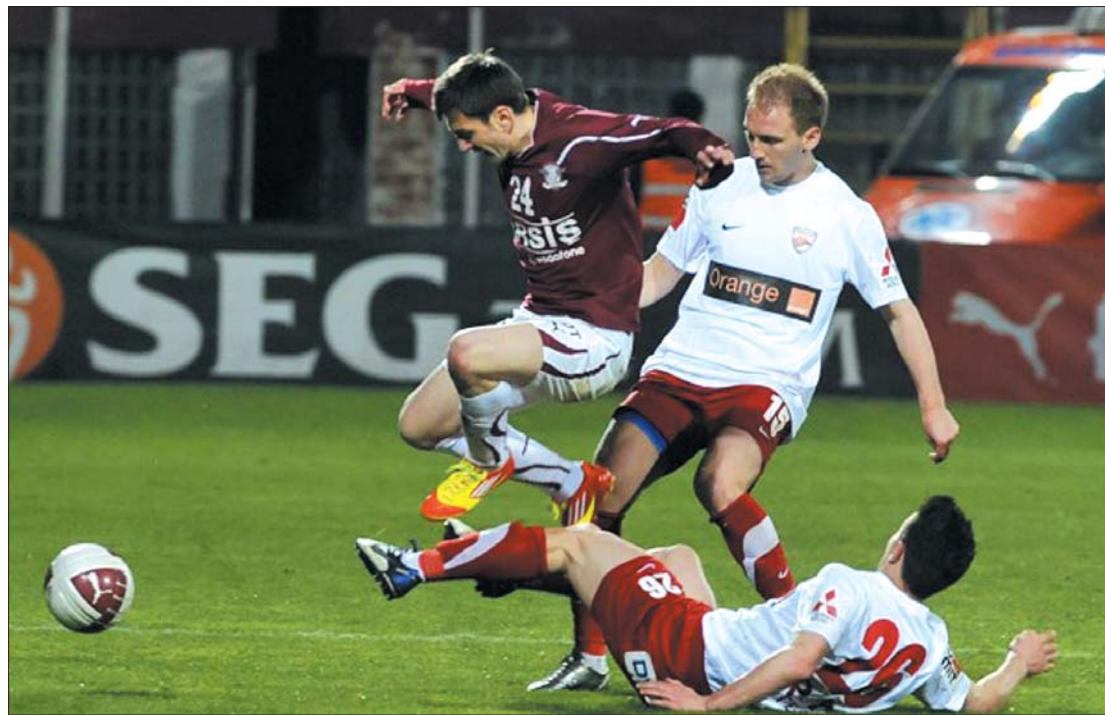
A Surdu (bordó mezben) elleni dinamós szabálytalankodásért tizenegyest követelt a Rapid

kozó lapzártánk után fejeződött be, de ettől függetlenül a Szamosparti „vasutasok” állnak az összetett élen, a Dinamo 46 ponttal a második, míg a Rapid 42 ponttal az ötödik helyen áll. ◀