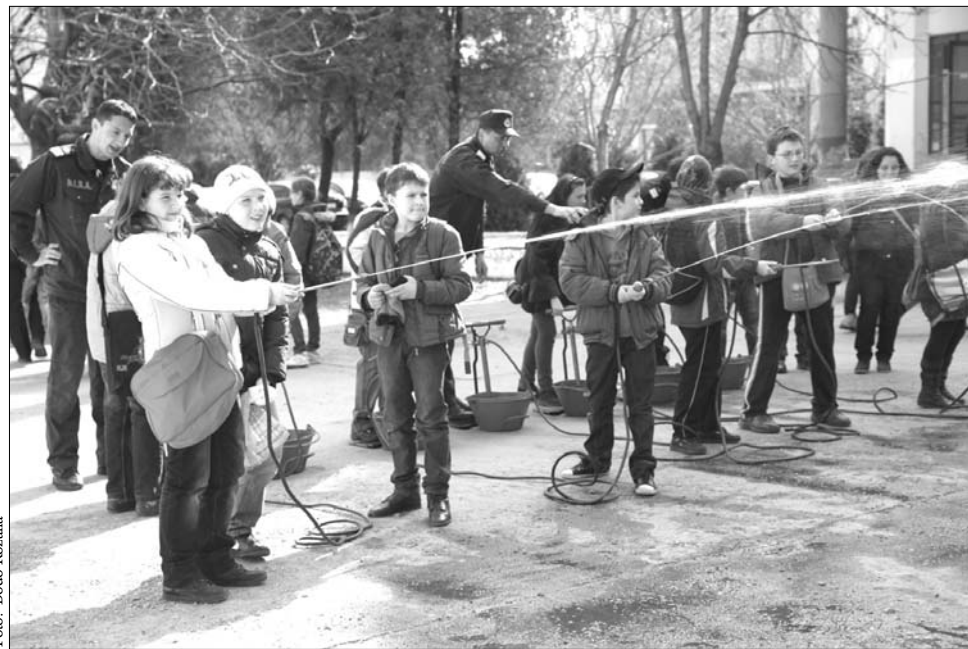
A renghagyó iskolahéten a Kolozsvár környéki diákok a tűzoltó szakmával is megismerkedhetnek