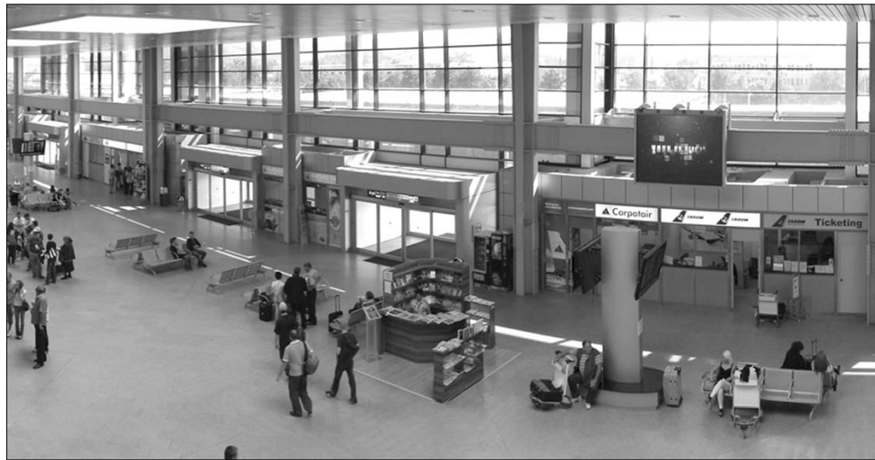
Az idei nyári szezonban több járatral és néhány új célponttal gazdagodott az erdélyi repülőterek kínálata

A légitársaságok kolozsvári indulásaik számát is növelték: a Tarom hetente öttel több járatot bocsát a Bukarest Otopeni-be tartó utasok rendelkezésére, míg a WizzAir kettővel több repülőgépet indít London és Forlí célállomásokra. A Kolozsvári Nemzetközi Repülőtérrel emellett Dortmund, Beauvais, Madrid, Barcelona, Valencia és Zaragoza felé is eggyel több gépmadar