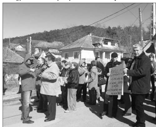
A marosújvári kórház bezárásának évfordulóján tüntettek a helyiek

A kormány a Nemzetközi Valutaalappal kötött hitelszerződésben vállalta, hogy 2011. június végéig 133 ezerre csökkenti a kórházi ágyak számát az akkori 135 200-ról, az év végéig viszont 129 500-ra korlátozza a számukat. A kormány azt is vállalta, hogy tíz százalékkal csökkenti a kórházban kezelt betegek számát a 2009 végén regisztrált létszámhoz képest. ◀