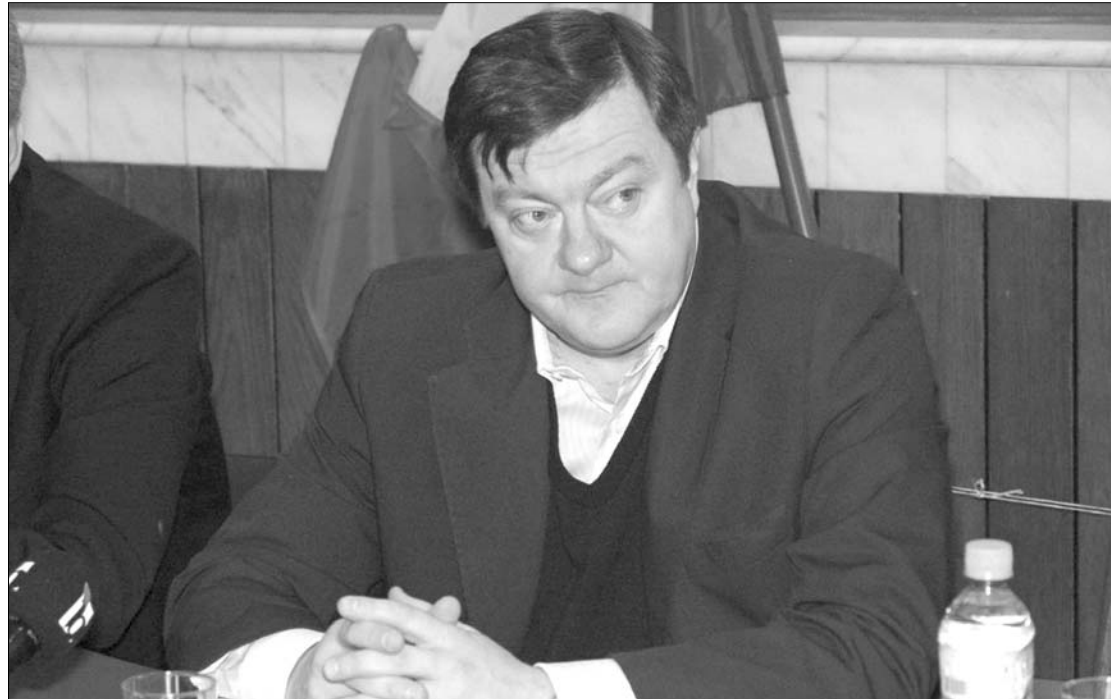
Sorin Frunzaverde a teljes Krassó-Szörény megyei szervezetétől megfosztotta az Emil Boc vezette PDL-t