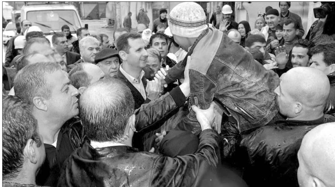
Aszad elnök látogatása a felkelők egykori fellegvárában. Homsz városában még a gyerekek is ünnepelték

„Szíria elfogadta a béketervet” – jelentette be Kofi Annan, az ENSZ és az Arab Liga szíriai ügyekben megbízott közvetítője Pekingben, miután találkozott Ven Csia-pao kínai miniszterelnökkel. A damaszkuszi döntés „fontos kezdő lépés, amely véget vehet az erőszaknak és a vérontásnak”. A Biztonság Tanács által