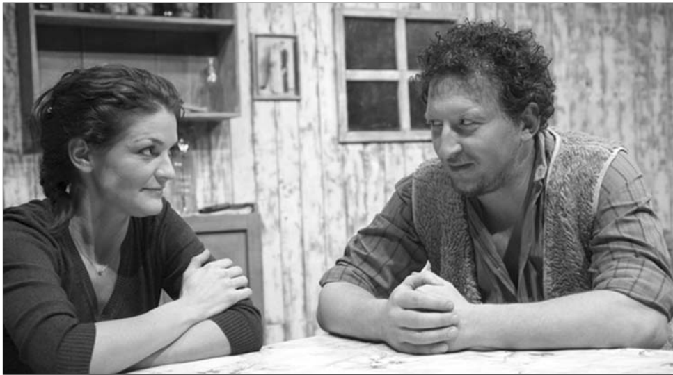
A Bányavirág tipikusan székely témájú előadás, de a magyarországi rendezők is kedvet kaptak hozzá

A Nemzeti Színház egyébként tizenegy bemutatót tervez a jövő évadban – jelentette be Alföldi Róbert igazgató, aki azt is elárulta, jövőre, mandátuma lejártával újra pályázik a vezetői posztra. Az igazgató kiemelte: a színház idei költségvetése mintegy fele a négy évvel ezelőttinek, de az intézményt számos cég támogatja, segítve a jövő évi program megvalósítását. A Nemzeti Színházban szeptember 28-án