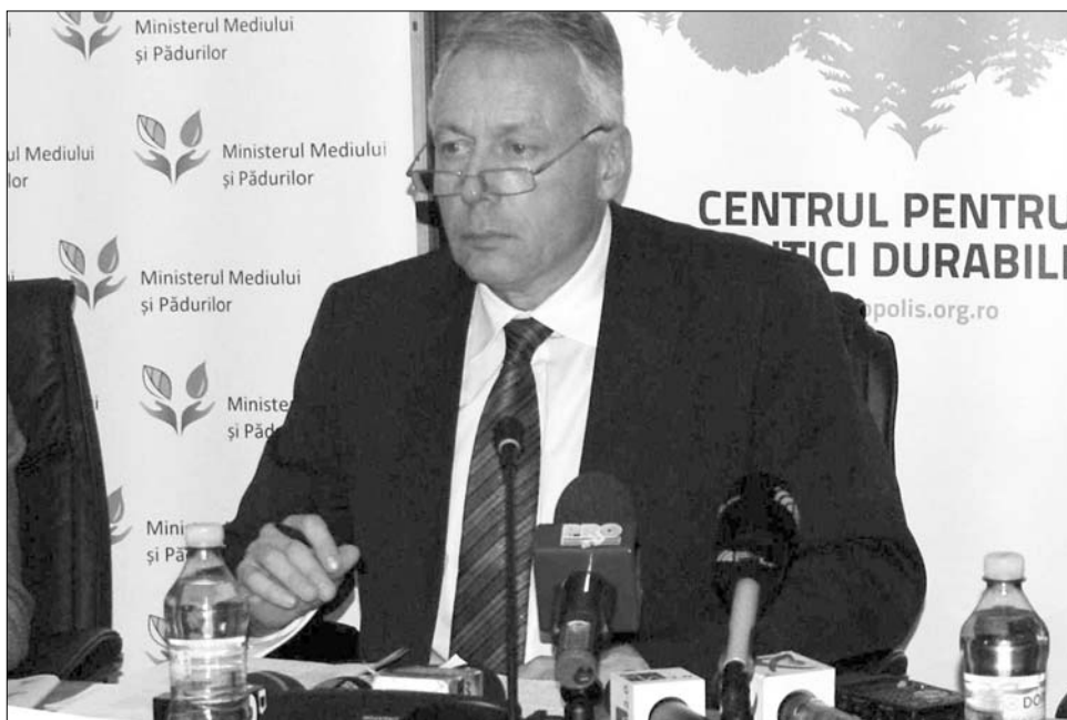
Borbély figyelmeztetett: június végéig el kell készíteni a finanszírozási szerződés dokumentációját

► „A Környezetvédelmi és Erdészeti Minisztérium hathatósan támogatja Máramaros megye fejlődését, hiszen jelenleg a minisztérium különböző programjai keretében összesen 455 millió euró értékben eszközölünk beruházásokat Máramaros megyében” – nyilatkozta Borbély László környezetvédelmi és erdészeti miniszter tegnap Nagybányán. A miniszter Máramaros megye prefektusával, a megyei tanács elnökével, a megye szenátorai, képviselőivel és polgármesterekkel ismertette a szaktárca 2012-es programjait, valamint a vissza nem térítendő uniós pénzekre való pályázási lehetőségeket. Borbély szerint az európai uniós forrásokból finanszírozandó fejlesztések közül a legfontosabbak a megye integrált hulladékmenedzsmentjének és vízinfrastruktúrájának megépítését szorgalmazó átfogó tervek. A beruházások értéke több mint 177 millió euró. „A megye vízinfrastruktúrájának európai szabványokkal kompatibilissá tételét szorgalmazó befektetés finanszírozási szerződését a minisztérium aláírta, ezt kö-