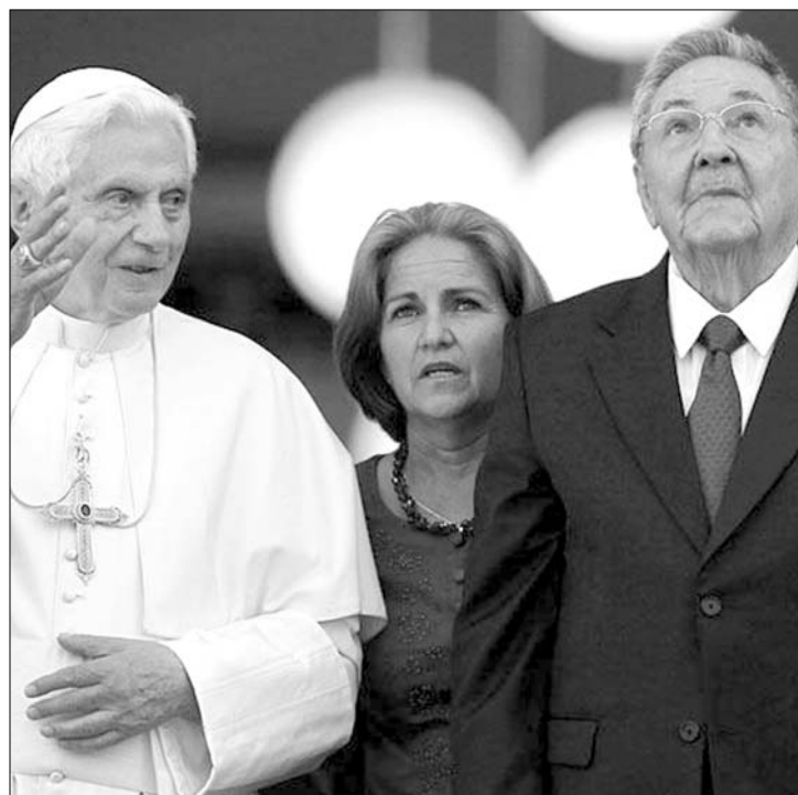
XVI. Benedek és Raúl Castro. A pápa a nagypénteki ünnepről beszélt

XVI. Benedek pápa találkozott kedden Raúl Castro kubai elnökkel a kommunista rezsim központjában, a havannai Forradalmi Palotában, ennek végeztével nem nyilatkoztak a sajtónak. Fidel Castro nem volt ugyan jelen a találkozón, de kedd este – a kormány honlapja szerint – bejelentette, hogy szerdán „boldogan” találkozik a katolikus egyházfővel. (A „Máximó Líder” tizen-négy esztendővel ezelőtt Havannában fogadta II. János Pál pápát; Fidel akkor elegáns sötét öltönyt viselt, ígéreteiből azonban vajmi kevés valósult meg.) Raúl Castro a Kuba védőszentjének számító Virgen de la Caridad del Cobre másfél méteres szobrát ajándékozta a katolikus egyházfőnek, a pápa egyébként helyi idő szerint kedd délelőtt maga is felkereste a Szerető Szűz szentélyt Santiago de Cubában.