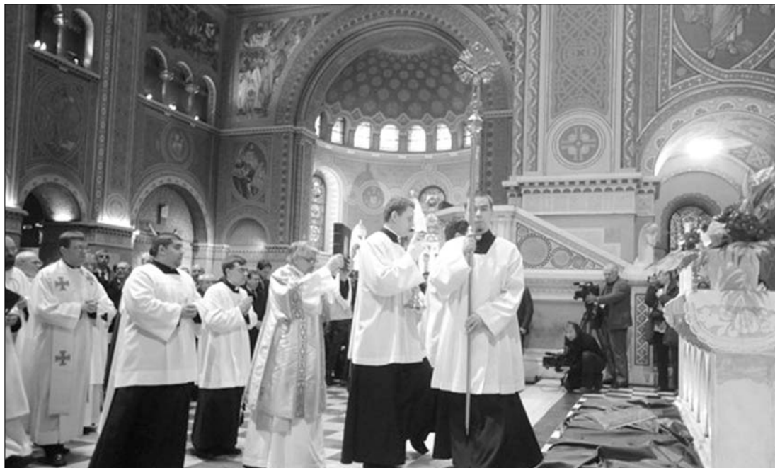
Egyházi szertartás, a háttérben munkájukat végző sajtósokkal. Hol a határ, amit nem szabad túllépniük?

tolikus egyházban, de nem kirívóbb, mint máshol, illetve amellett eltörpülnek egyéb, pozitív dolgok. Potyó Ferenc szerint a katolikus egyház nem akar elrejtőzni. „Főleg nem a média előtt, mely első számú segítőnk akár az újraevangelizálásban” – fogalmazott. Kijelentette: amíg a riporter csak fülel és jegyzetel, „nem bolyong látványosan ide-oda, nem mészik lencséjével a prédikáló vagy az imádkozó arcába”, addig nem csak megtört, de kimondottan szívesen látott vendég az egyházi szertartásokon. ◀