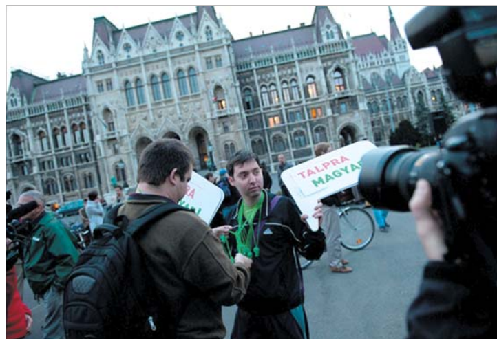
Az államfő lemondását követelő flashmob a parlament épülete előtt

▶ Schmitt Pál nem mond le a köztársasági elnöki posztról – jelentette ki a magyar államfő a dél-koreai Szöulban. A The Economist lemondólevel-mintákat tartalmazó linket küldött Schmitt Pálnak. Az MSZP népszavazást tartana az ügyben. Kedd este flashmobot tartottak Budapesten. 2. és 4. oldal ▶