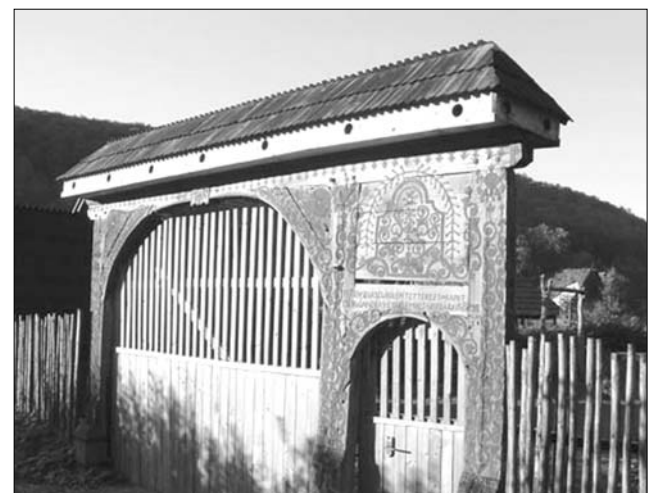
Székely kaput állíthatnak a háromszéki gazdák